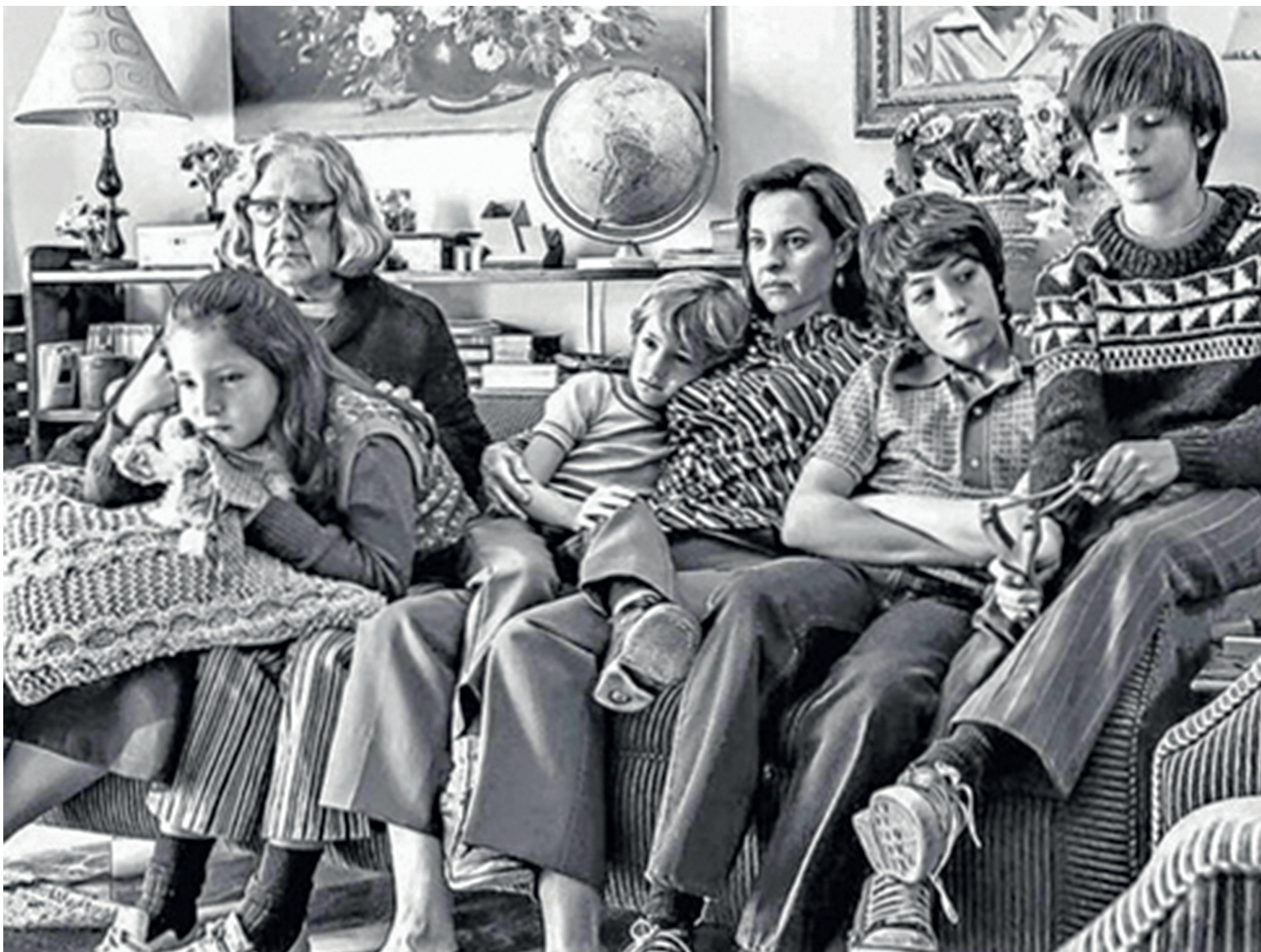
La familia del film "Roma"