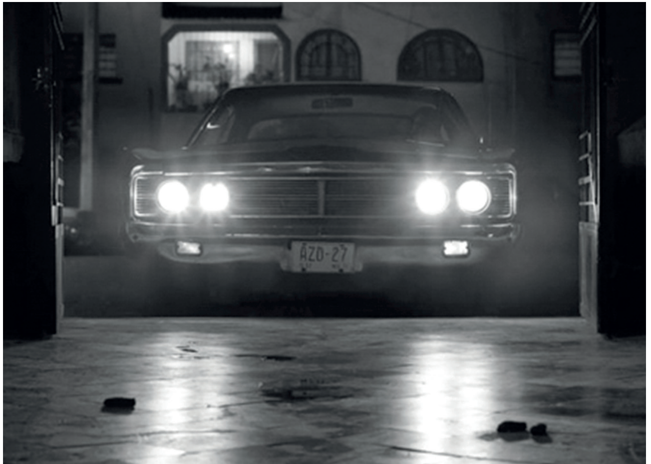
El coche Galaxy entrando en la casa

El espectador ve cómo la vida en estado puro pasa. Asiste a ese maravilloso espectáculo, el espectáculo. Sin aditamentos, farsas o gritos.