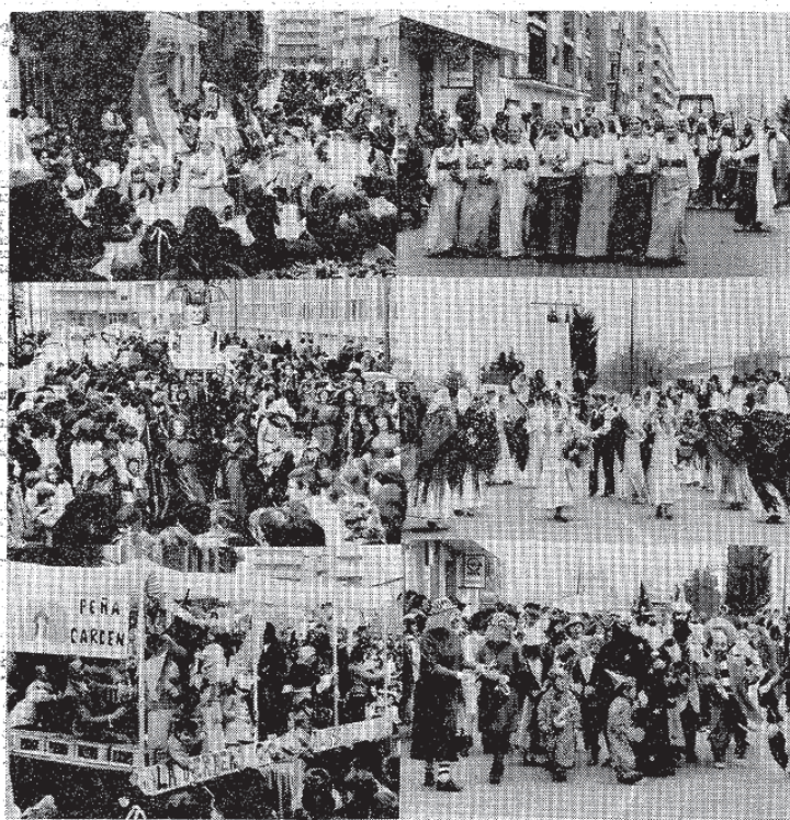
Arriba, dos aspectos del desfile de la carroza y comparsa de «Moros y cristianos», de Torralba, primer premio; en el centro, «Vampiros», de Moral, y «Las chilupapas», de Pozuelo; abajo, la carroza de la Peña Garden, organizadora de la cabalgata y un grupo de máscaras de toda clase y edad.

Carroza de Calatrava, con un harén y grupo de moros y cristianos, con banda de música, trofeo del Ayuntamiento y veinte mil pesetas. Segundo premio a la Peña Góndola, copa y quince mil pesetas. Tercero, carroza "Dominó" de la Peña "La Cuadrilla", trofeo y cinco mil pesetas. Charangas: Peña "El Molino" de Moral de Calatrava, representada por "La sepultura de los monstruos", copa y diez mil pesetas.