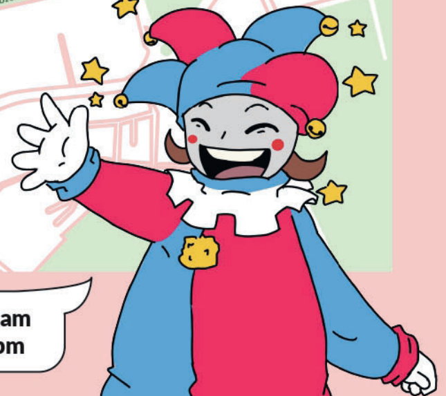
ILUSTRACIÓN: PILAR MOYA

Comienzo del desfile: 11:00 am Entrega de premios: 17:30 pm