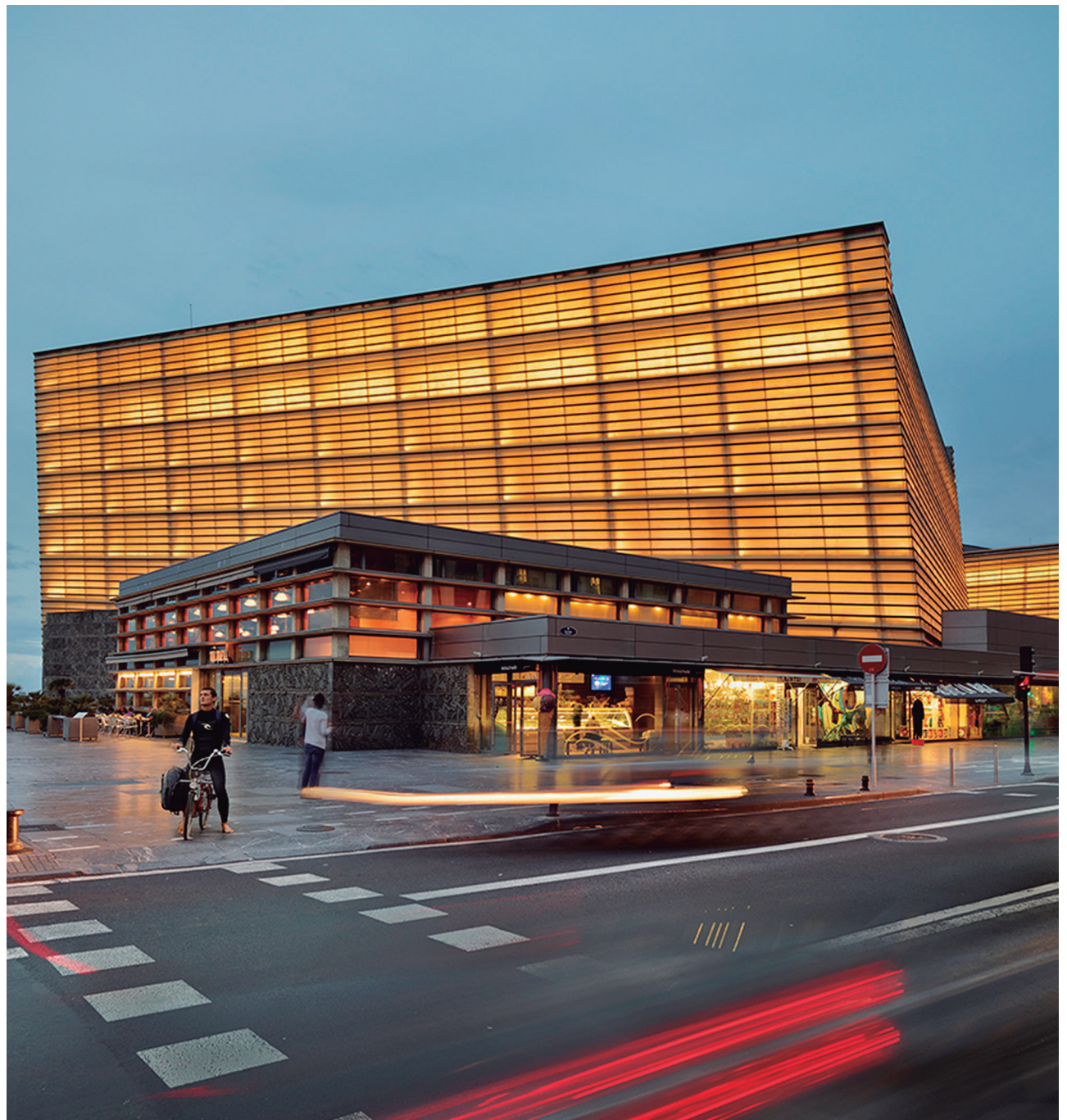
El Kursaal, sede principal del Festival de Cine

No puedo decir lo mismo de la película de Víctor Erice, Cerrar los ojos. Gran maestro de cine español que, sin embargo, ha pinchado en esta entrega suya con fallos de principiante.