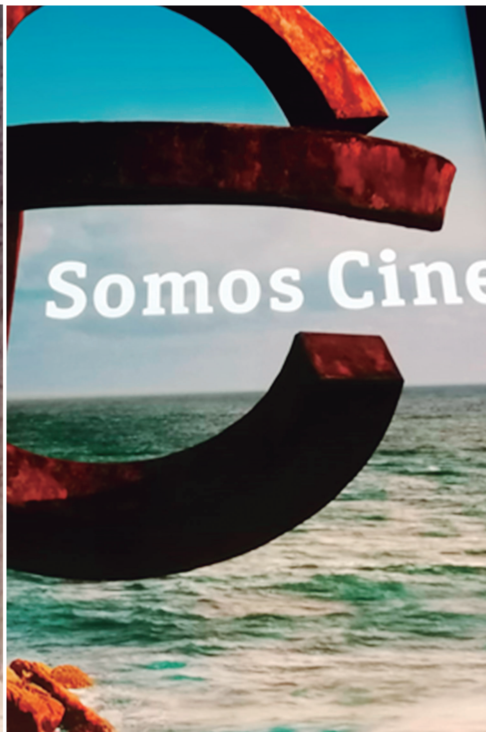
(Izq.) Cartel publicitario de San Sebastián decimonónico (Dcha.) Cartel de la 71 edición del Festival de cine de San Sebastián