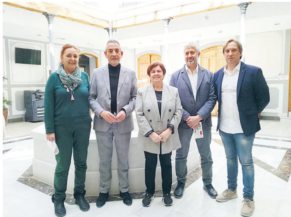
LA REUNIÓN COMARCAL DE COOPERATIVAS CELEBRADA EN VALDEPEÑAS

La directora general felicitó al Ayuntamiento de Valdepeñas porque la ciudad está muy bien, con muchos comercios y empresas, “señal de que el