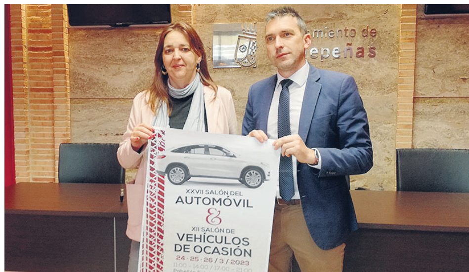
PRESENTACIÓN DE LOS SALONES DEL AUTOMÓVIL Y DEL VEHÍCULO DE OCASIÓN / M. G.

Estarán presentes Automóviles Gómez de Santa Cruz de Mudela, Automóviles Tecnicar's; Autos Carabaño; Autos Carretero Sport, que se reincorpora a la feria como concesionario de Mazda y Jaguar; Ciudadauto de Ciudad Real y Valdepeñas, concesionario de Peugeot, DS y Opel; Inbado, concesionario de Renault y Dacia; Mecoval