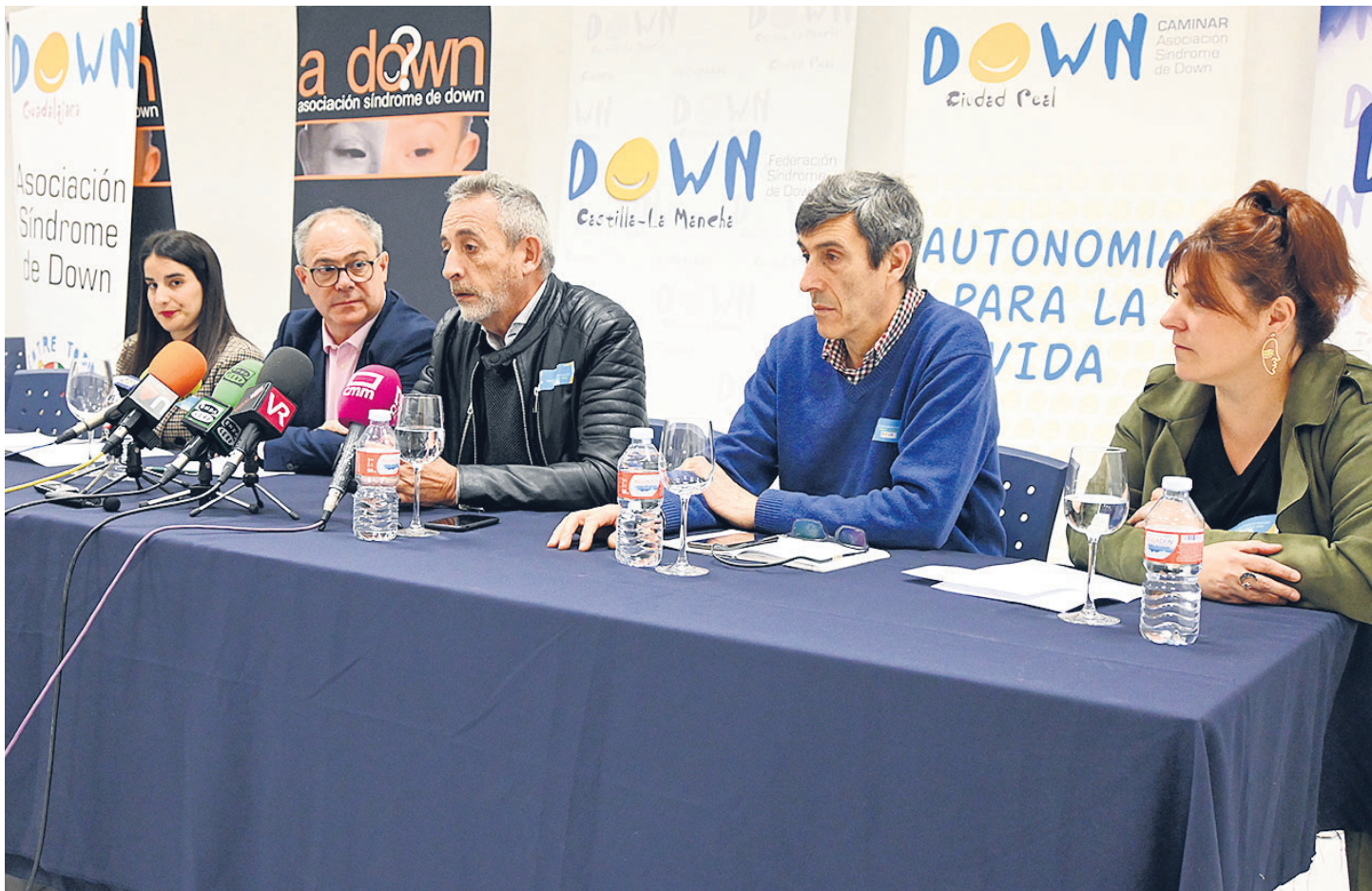
PRESENTACIÓN DE LAS JORNADAS “LAS MUJERES CON SÍNDROME DE DOWN CUENTAN Y NOS RELATAN” / LANZA