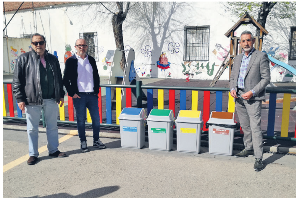
PRESENTACIÓN DE LOS CONTENEDORES

Por su parte, el director del Colegio Maestro Juan Alcaide alabó esta iniciativa que contribuye a los objetivos de Desarrollo Sostenible y sirve para