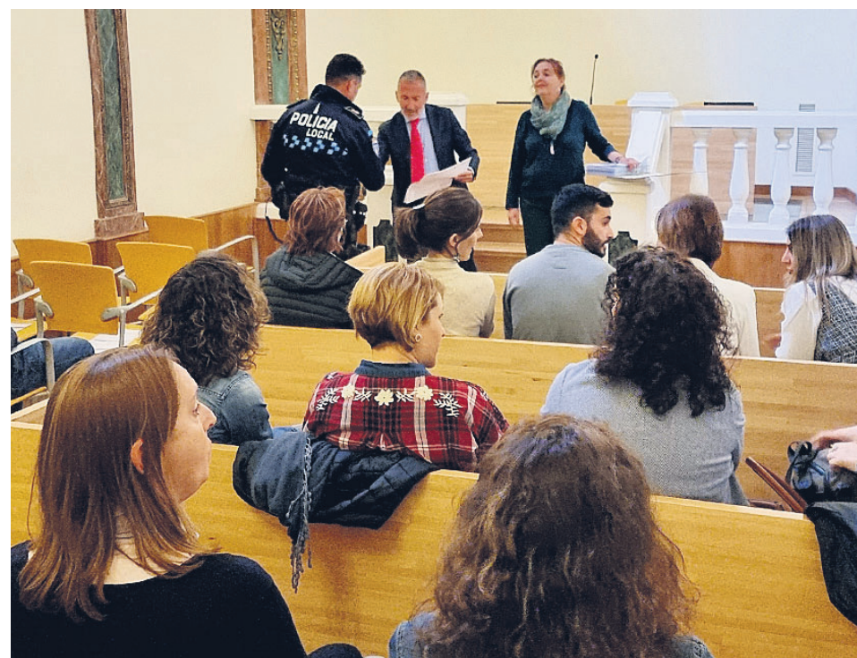
ENTREGA DE DIPLOMAS A EMPLEADOS MUNICIPALES / LANZA

El teniente de alcalde afirmó que los recursos que se emplean en este tipo de formación son una inversión, no un gasto, y adelantó que el ayuntamiento seguirá intensificando los procesos formativos en sus trabajadores.