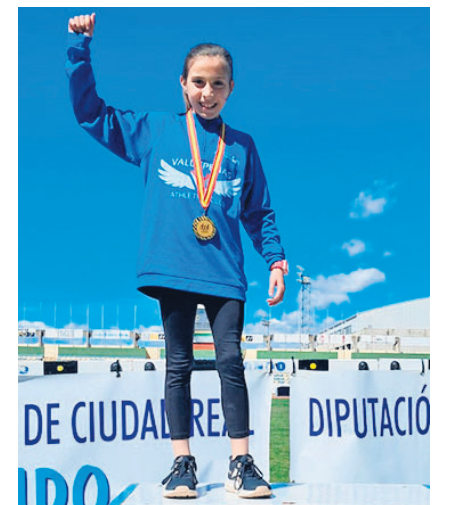
LOS JÓVENES ATLETAS DE VALDEPEÑAS QUE CONSIGUIERON MEDALLA