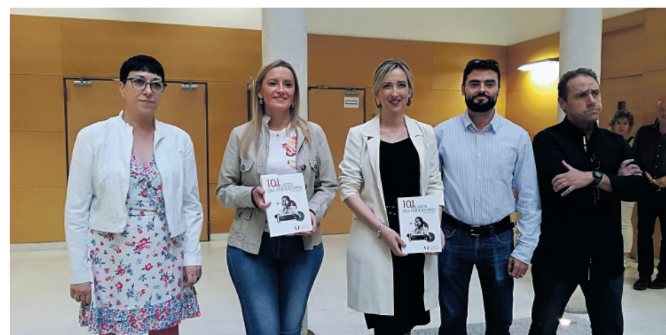
PRESENTACIÓN DEL LIBRO "101 RELATOS DE PERIODISMO. 101 AUTORES/AS"