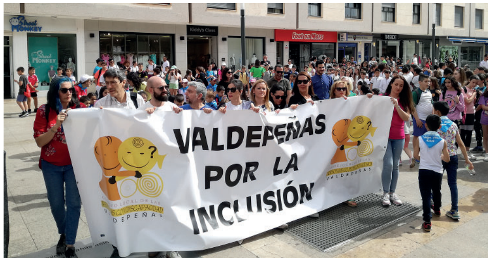
LA VI MARCHA POR LA INCLUSIÓN DE VALDEPEÑAS / M. G.

Señaló que el Consejo Local de las Personas con Discapacidad lleva a cabo diversas actividades a lo largo del año para sensibilizar en los centros educativos, no ciñendo sus actividades solo al Día de la Discapacidad del 3 de di-