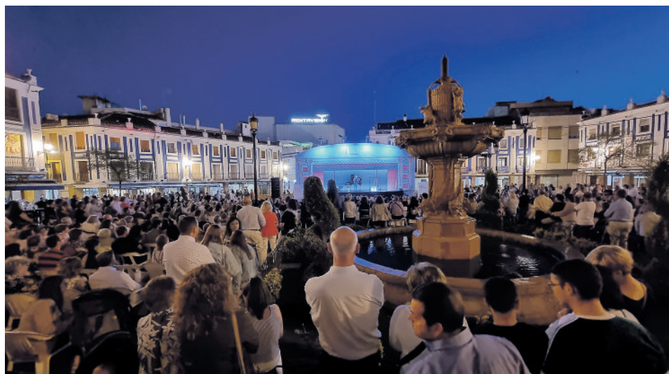
LA CARROZA DEL TEATRO REAL Y LA PLAZA DE ESPAÑA LLENA / LANZA

nos ofrece. Esta iniciativa surge, en primer lugar, como muestra de afecto y de agradecimiento a la ciudad de Valdepeñas, cuyo Consistorio me nombró por unanimidad Hijo Adoptivo de la ciudad y, en segundo lugar, porque en Grupo Oesía somos patrocinadores del Teatro Real desde 2019".