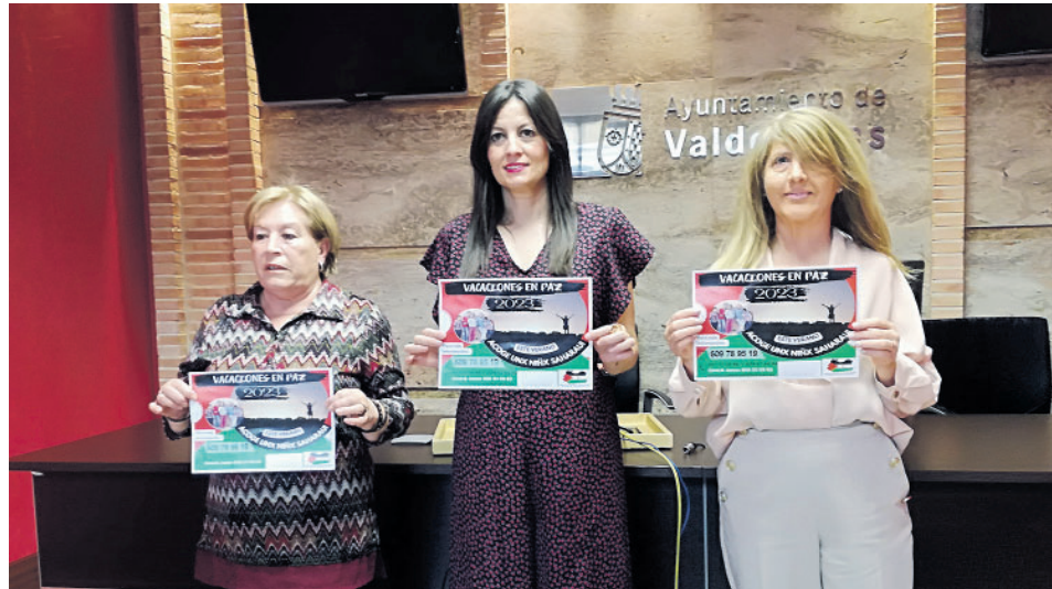
PRESENTACIÓN DEL PROGRAMA "VACACIONES EN PAZ" / M. G.

bido a la pandemia de la COVID-19, no vinieron niños de los campamentos saharauis y que el año pasado vinieron algunos a esta zona, menos días de los habituales, pero que no vino ninguno a Valdepeñas.