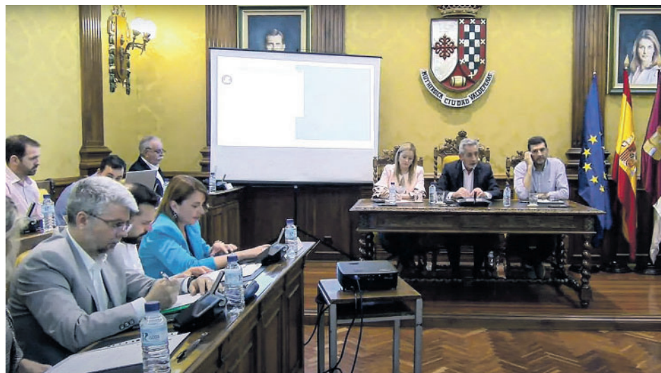
EL PLENO ORDINARIO DE MAYO DE VALDEPEÑAS / LANZA

En cuanto a las modificaciones presupuestarias, por una parte, una de ellas fue por suplemento de crédito y por importe de 2.912.305 euros. Está compuesta por 18 partidas, entre las que destacan la redacción de proyecto de ejecución de infraestructura verde parque fluvial para la defensa de la avenida del arroyo de la Veguilla desde Valdepeñas hasta el río Jabalón con estudio de seguridad y salud y documento de evaluación ambiental, la ejecución de obras de proyecto de mejora y movilidad urbana sostenible relacionado con la obra de la calle Alegría, obras de cubrición del Canal de la Veguilla y creación de zona de bulevar, amortizar la décima anualidad del edificio de La Molineta Agua y Salud, murales en vías públicas, publicidad y promoción de Valdepeñas en la equipación del equipo Viña Albalí, reparación y acondicionamiento de la actual pista de atletismo de La Molineta, actividades deportivas diversas, eventos de Feria y Fiestas de la localidad, mejora de la fosa estanca del Centro Municipal Canino, ampliación del punto limpio, cartelería informativa en materia medio ambiental, control de colonias felinas, actuaciones derivadas del Plan de Empleo 2022, material para construcción de obras en vías públicas, asfaltado de calles, equipamiento informático de la Escuela de Música y