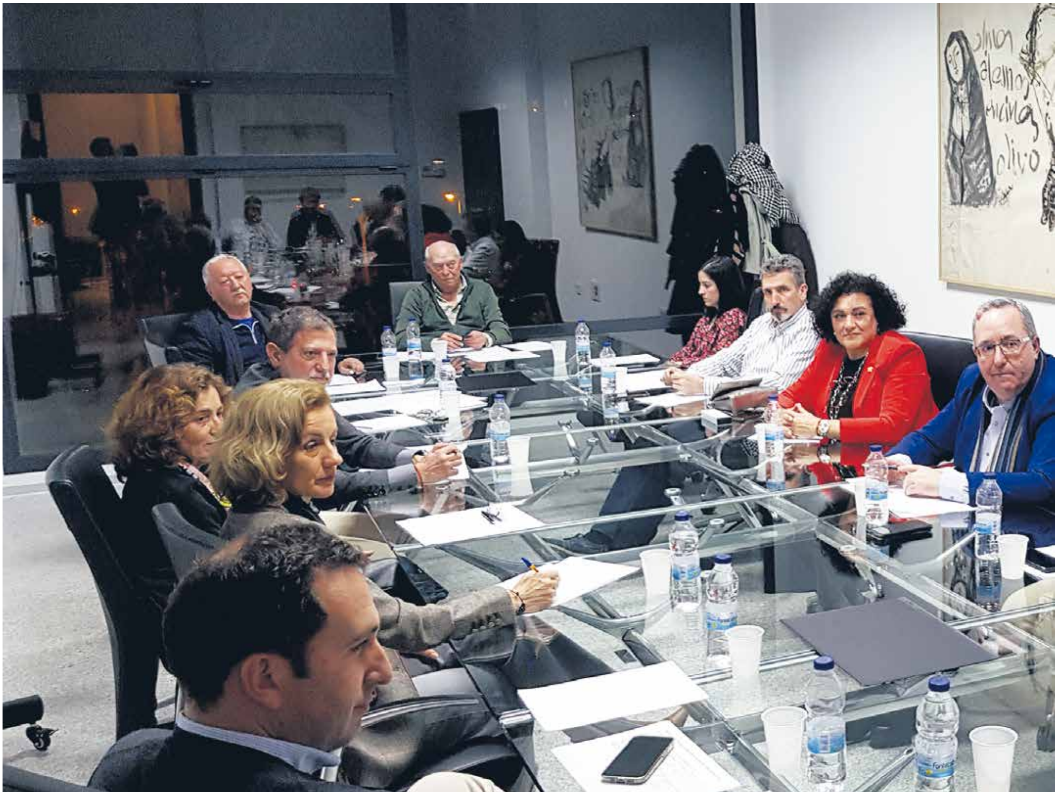
Asamblea anual de la Unión Interprofesional que integra a 17 profesiones