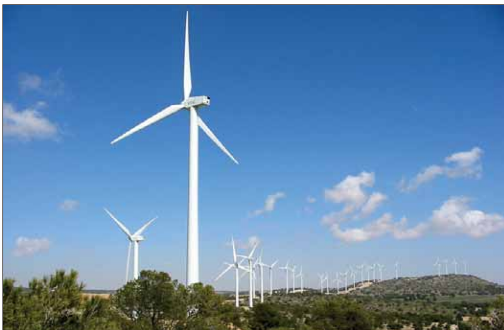
Las energías renovables constituyen una apuesta decidida del Gobierno de la Nación.

En la Estrategia Española de Cambio Climático y Energía Limpia se establece un conjunto de medidas para la consecución de los objetivos, junto con un sistema de seguimiento y una serie de indicadores. En especial se han elaborado medidas para aquellos sectores que peor comportamiento han tenido en el inventario nacional de GEI desde 1990.