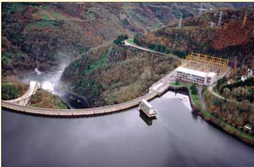
El incremento de la producción hidroeléctrica ha influido decisivamente en la reducción de GEI.

Todo ello permite anticipar que en 2006 las emisiones habrán mostrado una clara estabilización , o incluso una reducción , respecto al año anterior.