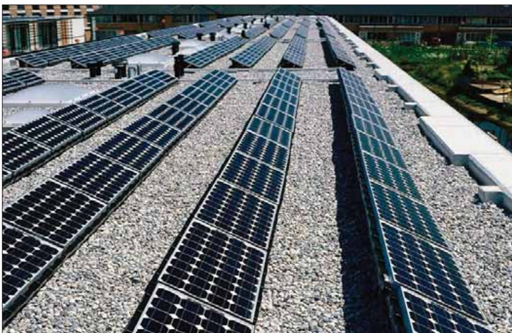
La proliferación de instalaciones de energía solar fotovoltaica genera una fuerte demanda de profesionales en el sector

Este marco regulatorio de 25 años es una garantía que aporta seguridad jurídica para el productor, proporcionando estabilidad al sector y fomentando el desarrollo de instalaciones de energía solar fotovoltaica con una regulación estable y una tarifa muy subvencionada que asegura la amortización de las inversiones, así como la rentabilidad de varios años de explotación.