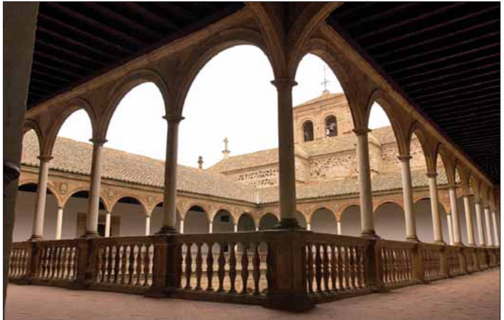
El Convento de la Asunción de Calatrava es el de arquitectura más ambiciosa y espectacular de Almagro.

La Iglesia de San Bartolomé o de los jesuitas fue fundada por licencia de Felipe III en 1602 y financiada por los fondos de los fieles, especialmente de la familia de los Mera. Las obras, que comenzaron en 1625, se prolongarían durante decenios. Los jesuitas se encargaron de ella y en 1777, fecha de la expulsión de los jesuitas,