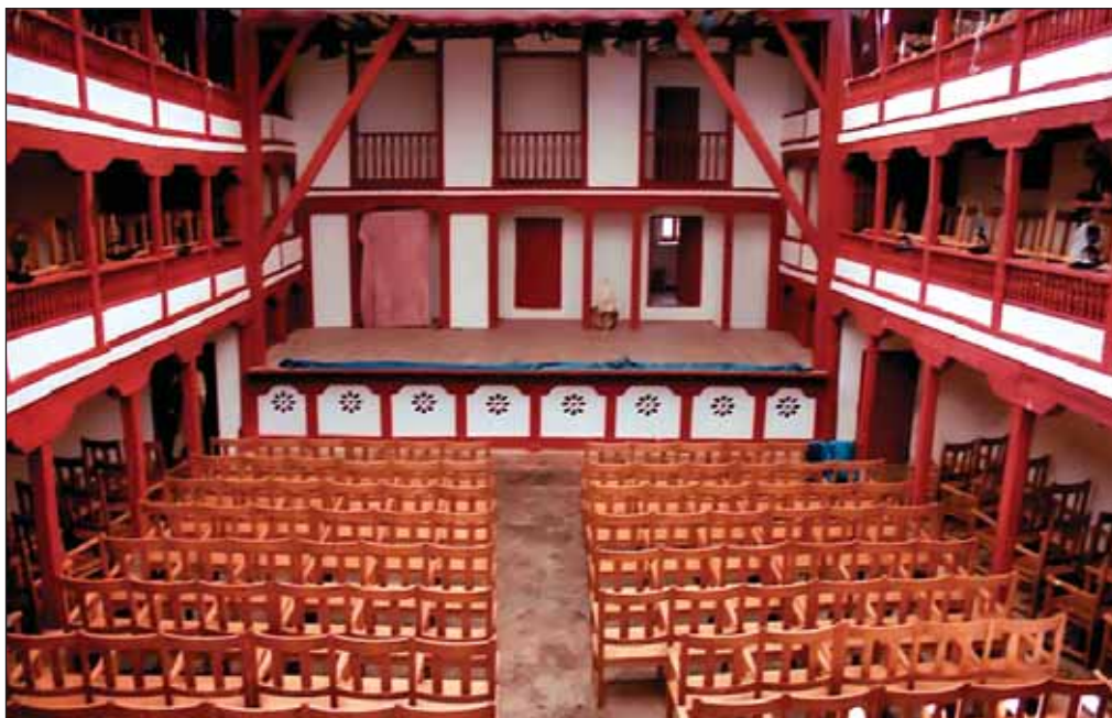
El Corral de Comedias de Almagro fue construido en 1628 por Leonardo de Oviedo.

En la actualidad, con un aforo para 300 personas, el Corral de Comedias de Almagro sigue utilizándose para la