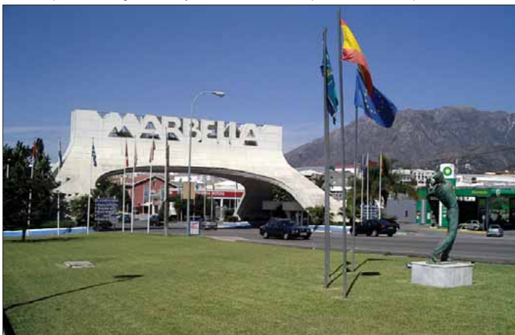
Marbella, a parte de otros lugares, constituye un claro referente de corrupción inmobiliaria en España.

tas se consideraban muy poco graves y, por lo tanto, los jueces no podían hacer nada. El actual incremento de las penas ha hecho que éstas se correspondan con la realidad de los hechos”, asevera, puntualizando que la modificación y el incremento de las penas en el Código Penal no va a poner fin de repente a la violencia de género pero “sí ha acabado con la impunidad de los agresores y la soledad de las mujeres”, asegura el catedrático de Derecho Penal y ex-rector de la Universidad de CLM. →