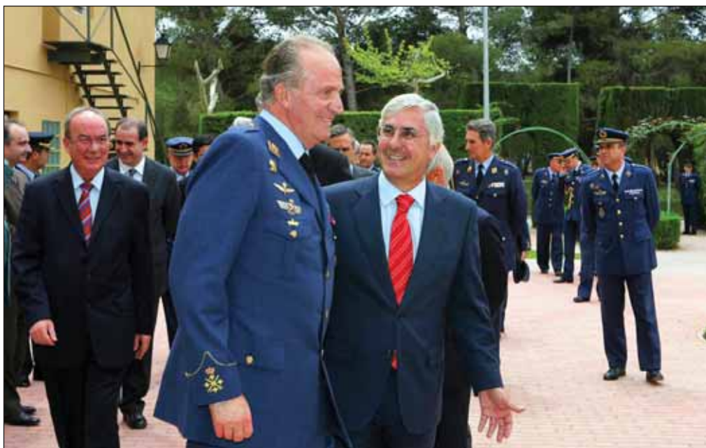
José María Barreda, presidente de Castilla-La Mancha, saluda a S.M. el Rey Don Juan Carlos durante la visita que el Monarca realizó este año a la Maestranza Aérea de Albacete.

También en el terreno de los derechos sociales, nuestro Estatuto avanza y consagra ideas de protección de los derechos de última generación, como la satisfacción de las necesidades educativas de las personas con necesidades especiales; el acceso a la vivienda de jóvenes y sectores sociales desfavorecidos; el reconocimiento de rentas de subsistencia a los colectivos en situación de pobreza; la protección de nuestro incalculable patrimo-