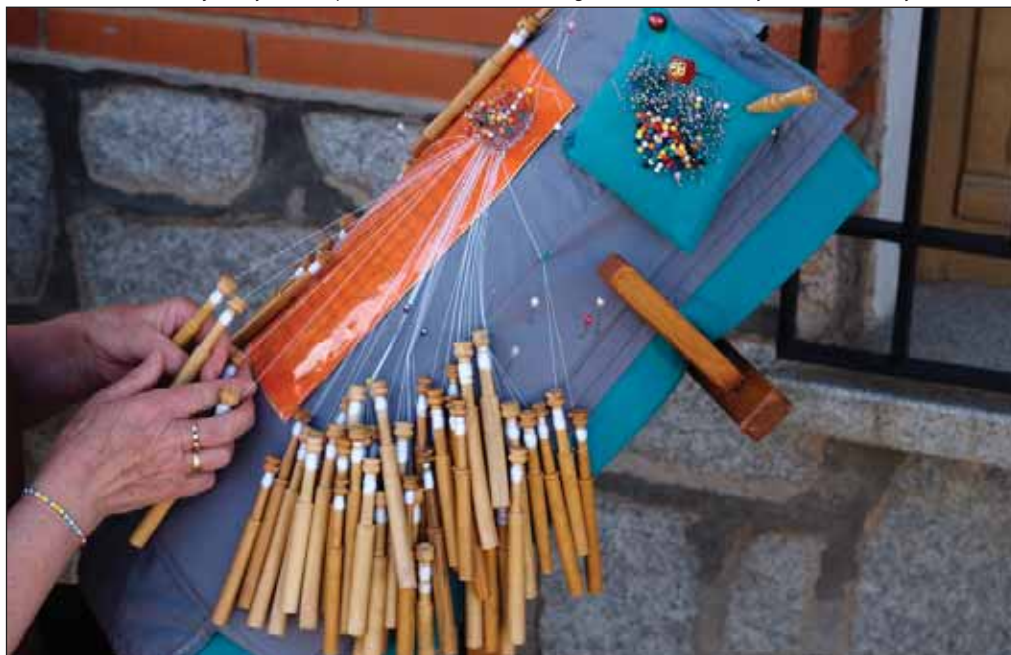
La industria de blondas y encajes forma parte de la artesanía de Almagro. En la foto, una mujer haciendo encaje de bolillos.

El corral de comedias es uno de los edificios más importantes de la arquitectura barroca que responde al cam-