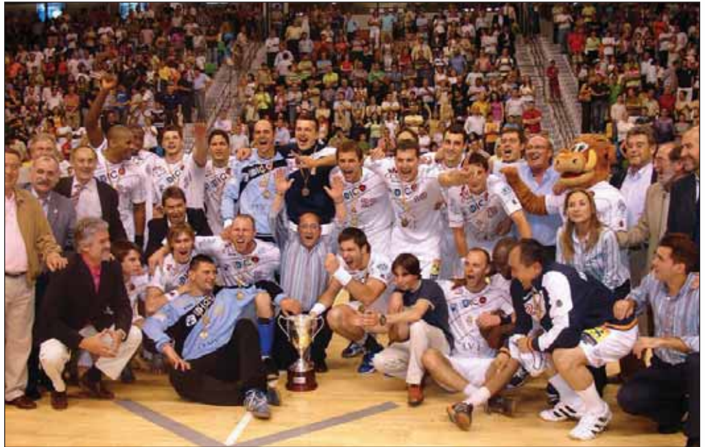
Equipo del Balonmano Ciudad Real ganador de la Liga Asobal 2006-2007.

Sin embargo, Talant Dujshabaev, el entrenador del Balonmano Ciudad Real que empezó de nuevo a jugar debido a una lesión del central del equipo, Uros Zorman, ha sido sancionado con un año de suspensión a causa de los incidentes que ocurrieron casi al final del partido del 8 de junio contra el conjunto argelino del Mouloudia. Esta sanción no le impedirá que pueda desarro-