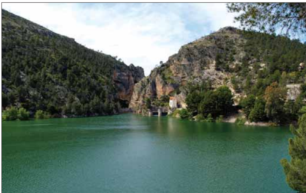
La reforma del Estatuto de Autonomía refuerza la posición negociadora de Castilla-La Mancha en el tema del agua. Foto Pantano de Camarillas en Hellín, Albacete.

Todos formamos la Nación española, que es nuestra patria común e indivisible. Con motivo de este XXV aniversario del Estatuto de Autonomía de Castilla-La Mancha, en el amor a España convoco a todos a trabajar por los derechos de los castellano-manchegos. ■