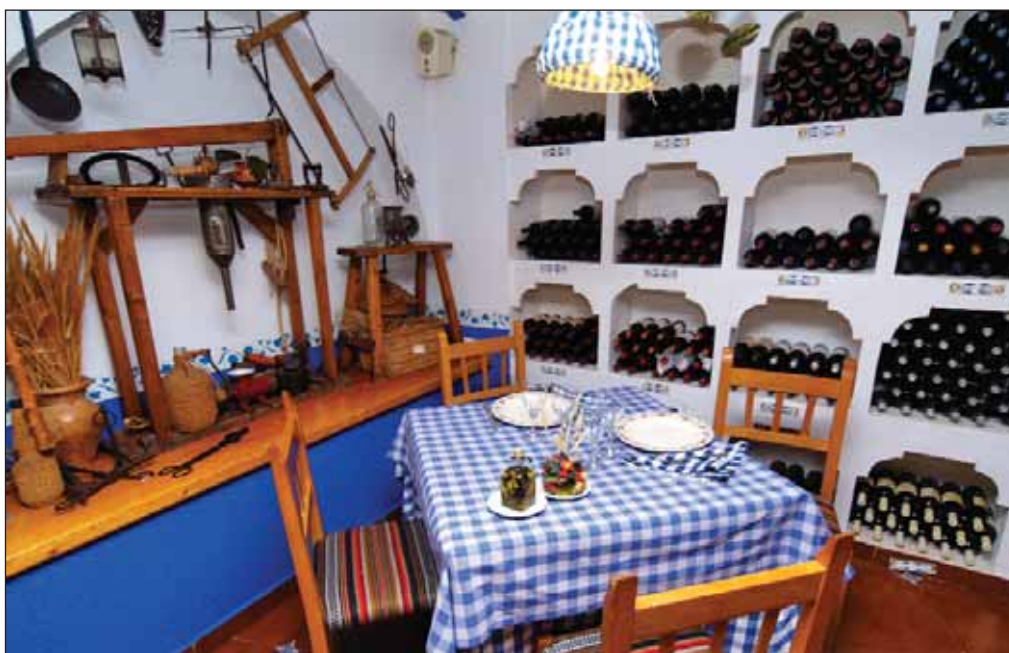
Los distintos rincones del restaurante Nuestro Bar nos acercan a la cultura y tradición de La Mancha.

De hecho, Nuestro Bar, desde su apertura, gozó siempre de una gran aceptación, "sentando un precedente porque ahora en muchos restau-