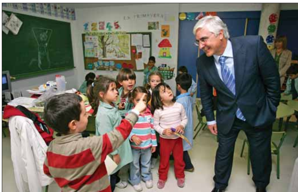
La protección integral de los menores y su educación, constituye un objetivo prioritario del Gobierno Regional.

Estado residual, entre otras cosas porque las comunidades autónomas son parte fundamental del Estado y porque el Gobierno de la Nación tiene que asegurar la igualdad entre todos los españoles. Las aspiraciones de las comunidades autónomas, de todas ellas, deben ser la coordinación y la cooperación, entre sí y con el Estado, y la profundización en las formas de gestión y mejor actuación de nuevas funciones en beneficio de los ciudadanos. Es el nuevo debate que se abre en el proceso de reformas esta-