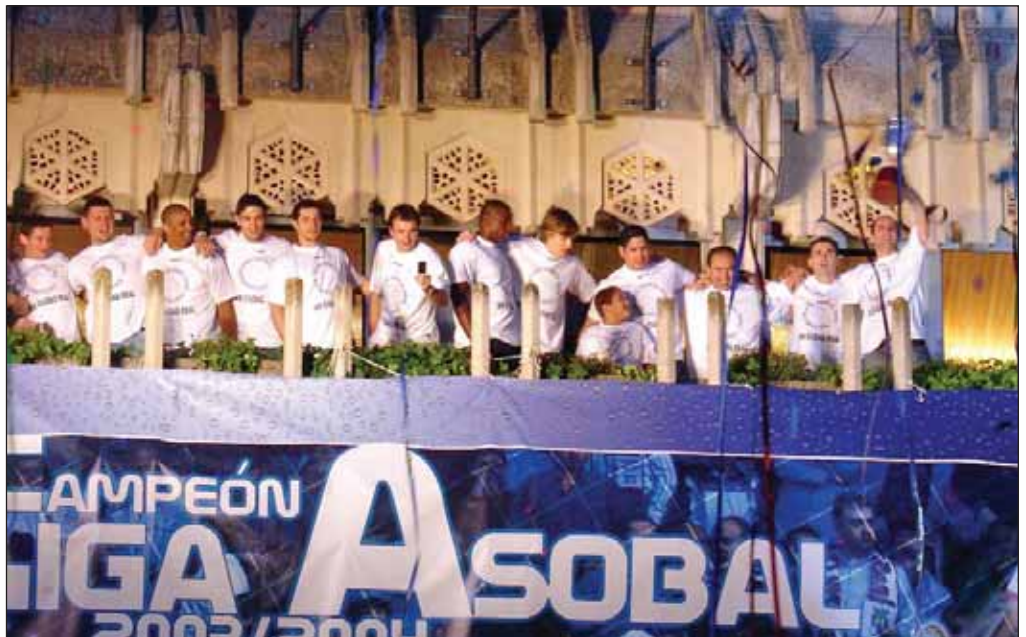
La plantilla del Balonmano Ciudad Real que ganó por primera vez la Liga Asobal, se presentó ante su afición desde el Ayuntamiento de Ciudad Real.

En esta misma temporada el equipo conseguía alzarse con la Copa Asobal y quedaba