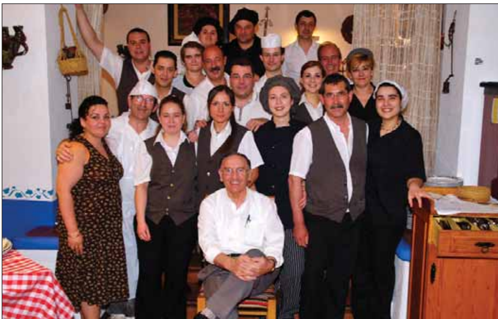
Algunos de los miembros de la gran familia del restaurante Nuestro Bar.

Para cumplir con todas las exigencias de la marca de calidad, es necesaria la colabora-