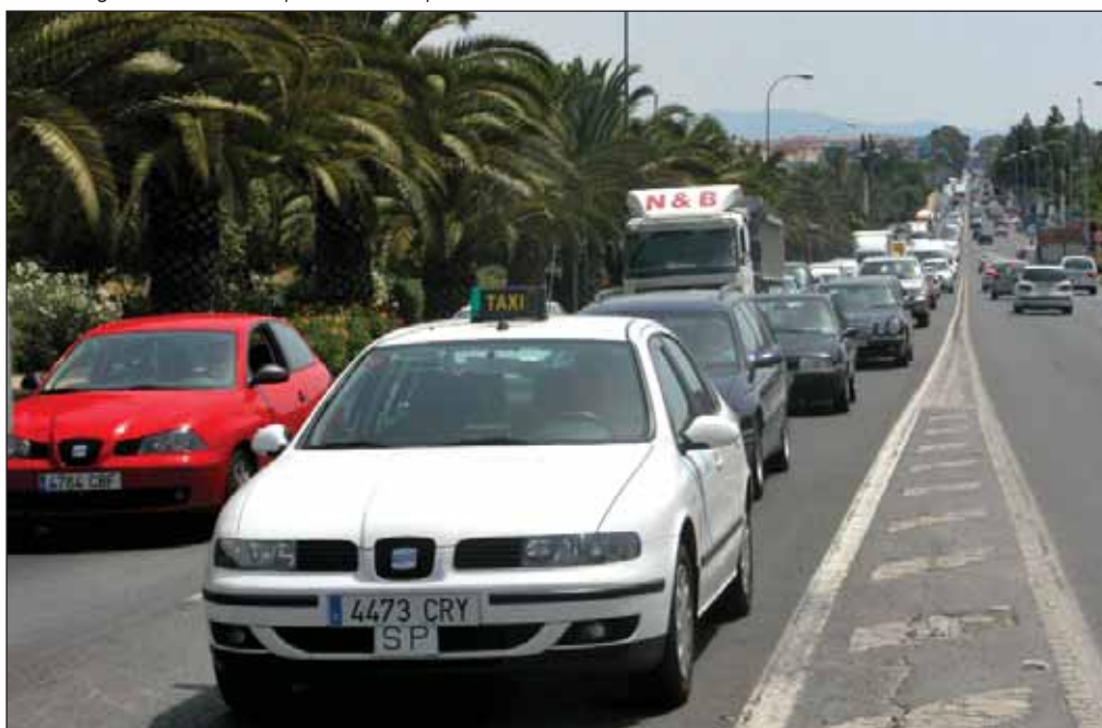
La Estrategia dedica todo un apartado al transporte sostenible.

Para dar ejemplo dentro de este conjunto de medidas, el Gobierno se propone para 2007 que todos los edificios de la Administración General del Estado aborden un programa de auditoría energética y de planes de ahorro y eficiencia energética, así como la incorporación progresiva de más utilitarios limpios en las flotas de vehículos oficiales y el uso de biocarburantes. Se trata de recomendaciones que se pretenden extender al resto de administraciones públicas. →