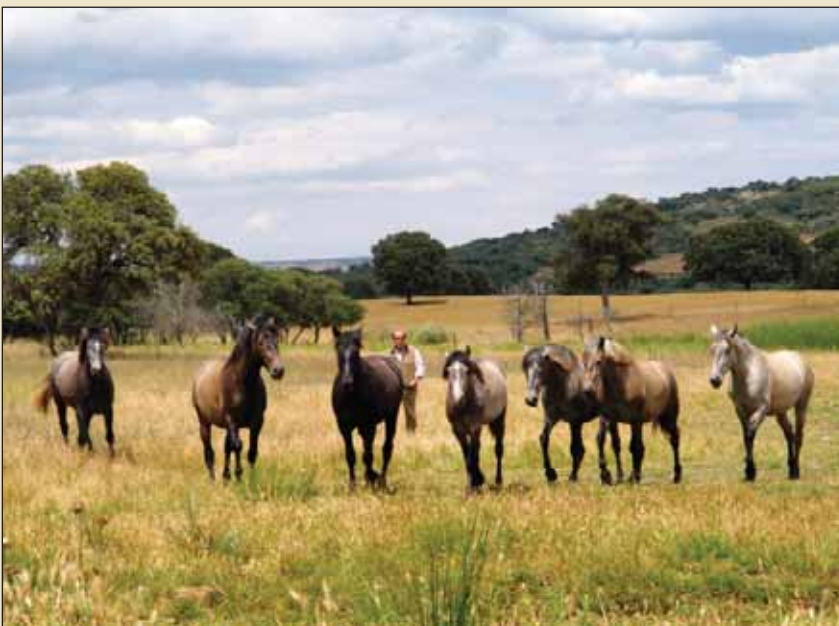
La yeguada de pura raza española ya ha comenzado a cosechar importantes éxitos.

Además, han empezado a asistir a concursos, en los que ya se han empezado a cosechar triunfos: "Últimamente ya hemos ganado un concurso, el de Jaén, con una yegua de dos años que se quedó campeona en su sección y subcampeona de la raza", apunta, añadiendo que sería toda una ilusión conseguir ser campeones de España.