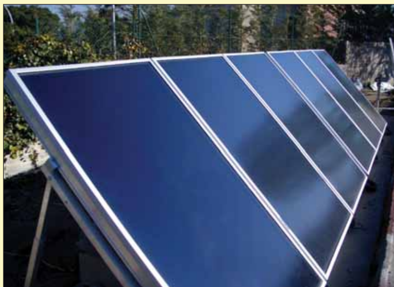
Actualmente, en toda la provincia de Albacete hay 24.300 kilovatios en producción.

Sin embargo, en la actualidad, la delegación de Industria y Tecnología de Albacete tiene tramitados en toda la provincia 629.328 kilovatios, de los cuales tendrán prioridad para ejecutar los proyectos los primeros que tengan todas las autorizaciones necesarias (Medio Ambiente, Urbanismo, Patrimonio y Sanidad) y los demás irán dependiendo de su estado de tramitación administrativa , ya que aunque actualmente no existen problemas para la evacuación de la energía , sí podría haberlos en caso de que todos los expedientes de huertos solares que han sido tramitados por la delegación de Industria y Tecnología para su funcionamiento consiguieran todas las autorizaciones necesarias para su ejecución. Además, existen algunos proyectos cuya entidad hace que su tramitación se realice a través de la dirección General de Industria y Tecnología , ya que tienen una evacuación distinta en la red de transporte .