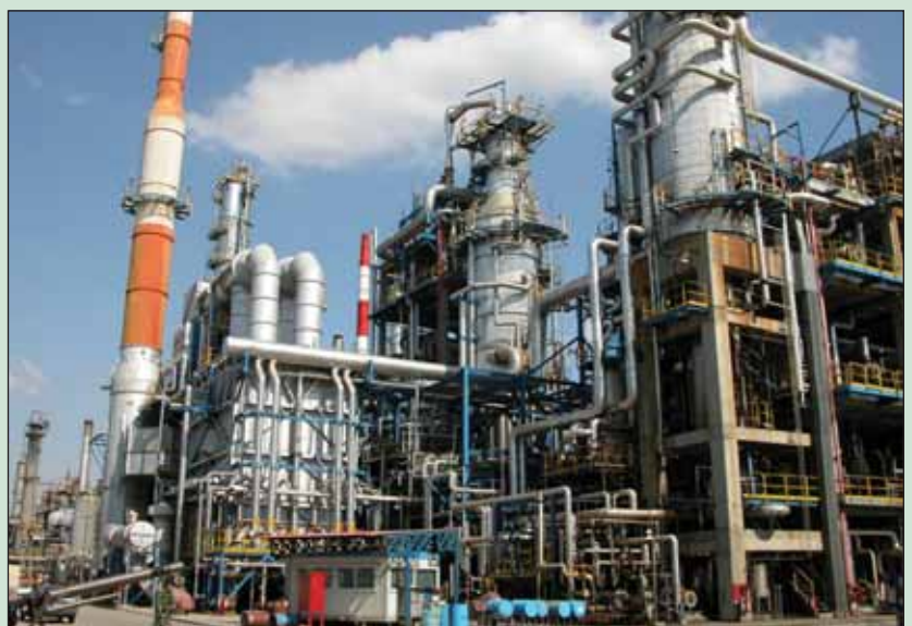
Los suministradores deberán reducir las emisiones de GEI ocasionadas por la producción, transporte y uso de sus combustibles en un 1% anual por unidad de energía hasta 2020.

Con respecto a la reciente propuesta de revisión de la Directiva de Calidad de Carburantes , es importante conocer que a partir de enero de 2009, los suministradores de combustibles de-