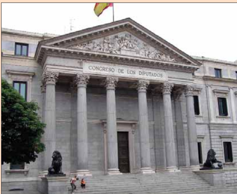
España lleva 30 años de democracia, convivencia pacífica, tolerancia y progreso.

Ese 15 de junio de 1977, continúa, “inauguramos el ciclo de mayor prosperidad de nuestro país. En 30 años, España se ha convertido en la octava potencia económica del mundo y es un ejemplo de democracia estable y de desarrollo social . Ese día comenzamos a conquistar el futuro . Ese día nos enseñaron el camino a seguir y nos mostraron una forma de hacer política”, aprecia el presidente de las Cortes castellano-manchegas .