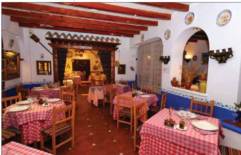
Todo el sabor de La Mancha se refleja en las distintas dependencias del restaurante Nuestro Bar.

Según indica el propietario de Nuestro Bar, entre semana la mayoría de los clientes que frecuentan su restaurante son personas de fuera de Albacete que se encuentran en la ciudad por motivos laborales,