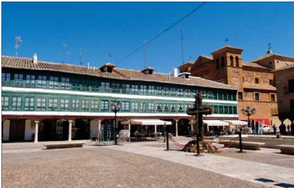
El Convento del Santísimo Sacramento de los Agustinos, a la derecha de la imagen, se encuentra situado junto a la característica y típica Plaza Mayor de Almagro.

La Iglesia de la Madre de Dios está ubicada en lo que fue el Hospital de Nuestra Señora de La Mayor, en solares comprados por la Villa en 1546. De estilo gótico tardío con tímidos matices renacentistas, se levanta sobre una lonja y responde al tipo de iglesia columnaria y de salón, modelo muy extendido por La Mancha. La torre, inacabada y construida en el lateral derecho de la fachada, es obra de Benito de Soto, arquitecto vecino de Almagro, en el siglo