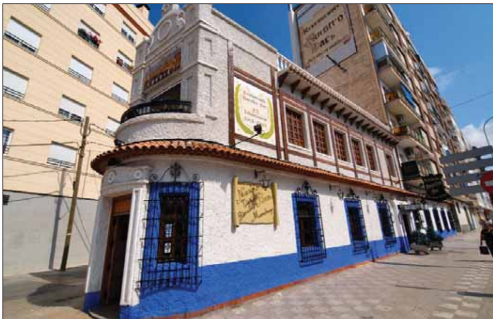
El restaurante Nuestro Bar lleva más de 40 años con la calidad por bandera en el servicio.

Desde sus inicios, Nuestro Bar ha ofrecido a sus comensa-