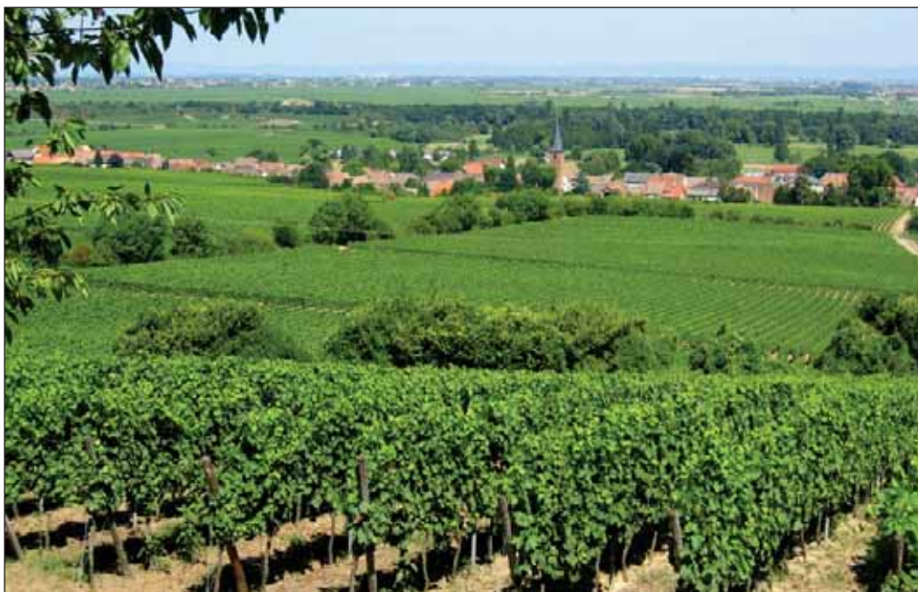
La reforma de la OCM del Vino fue uno de los distintos debates realizados con motivo de FENAVIN 2007.

Para De Lara, un factor positivo de la feria es que la capital de la provincia está apareciendo en las revistas más cualificadas del mundo con alabanzas firmadas por los