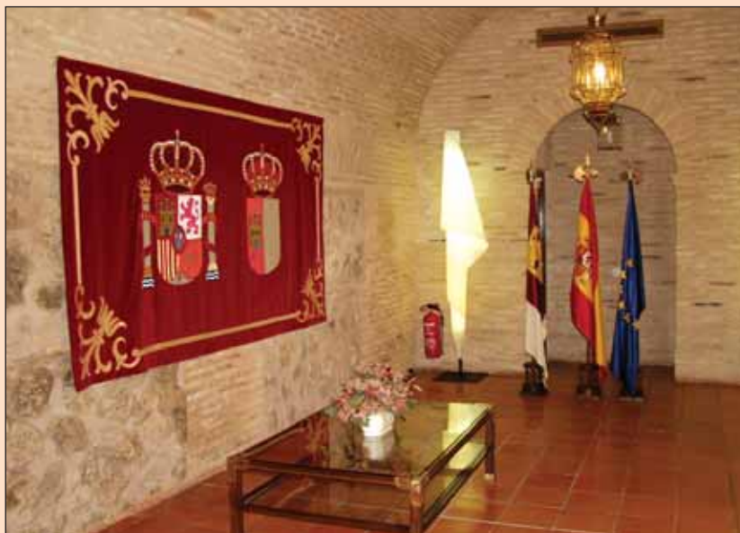
El Convento de San Gil, conocido popularmente como Los Gilitos, data del siglo XVII.

El edificio conventual pasó a utilizarse como cárcel provincial de 1936 a 1951, como cuartel de la Guardia Civil de 1952 a 1968 y como parque municipal de bomberos de 1958 a 1985, fecha a partir de la cual se restauró para servir de sede de las Cortes de Castilla-La Mancha .