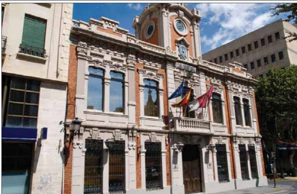
Albacete, es una de las cinco provincias de Castilla-La Mancha que mayor progreso ha tenido en estos 25 años.

Aunque anteriormente el territorio de Castilla-La Mancha no constituyó como conjunto una entidad política propia, no invocó como fundamento de su derecho a la autonomía fueros viejos o privilegios que vinieran de antiguo ni apeló al pasado para ornarlos con el simbolismo de nombrarlos derechos históricos, en palabras de Francisco Pardo, “sentimos orgullo de pertenecer a Castilla-La Mancha, una región que integra