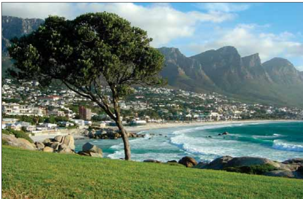
El aumento de temperaturas en las regiones próximas al litoral, será más atemperado que en las regiones interiores.

En la II fase, asimismo, se intentará incorporar a los grupos universitarios nacionales que trabajan en este campo, ya que su experiencia de trabajo y los resultados por ellos obtenidos hasta el momento son de indudable interés para alcanzar los objetivos del proyecto. La Cerca