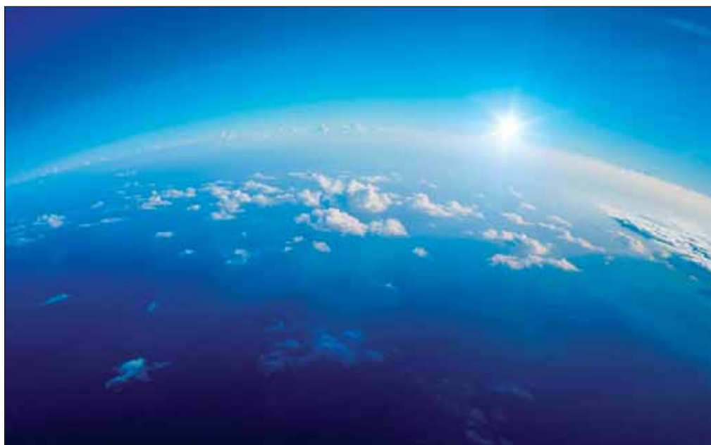
Las emisiones de efecto invernadero se reducen de manera considerable con el uso de productos agrícolas alternativos a los carburantes convencionales.

Estos estudios de análisis de ciclo de vida permiten detectar las etapas donde se pueden introducir mejoras que