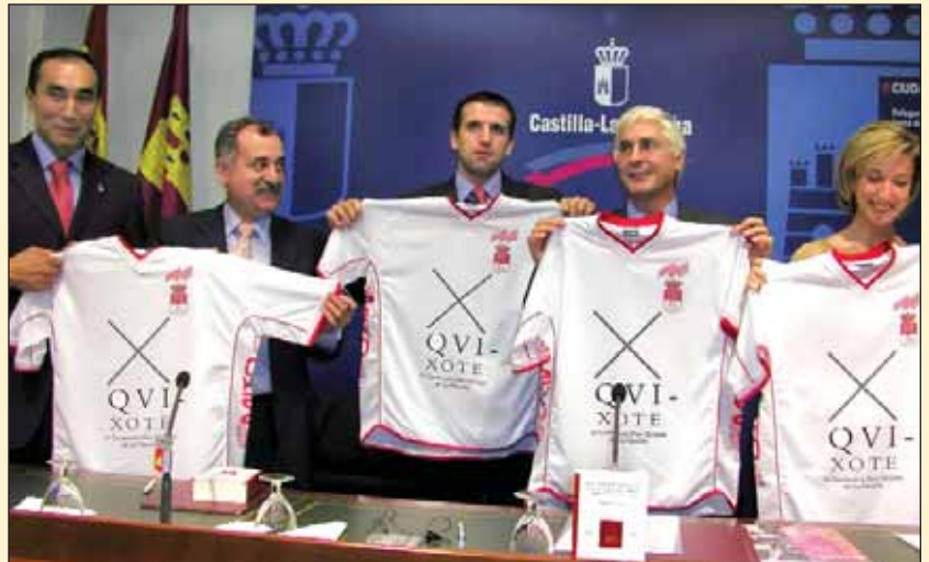
Mediante el acuerdo firmado con la JCCM, durante la temporada 2006-2007 los jugadores del Balonmano Ciudad Real han seguido luciendo en sus camisetas el logo del IV Centenario.

El Balonmano Ciudad Real se convertía en uno de los principales vehículos promocionales del IV Centenario del Quijote fuera de Castilla-La Mancha en virtud de este convenio, que ha sido renovado año tras año de manera que durante la temporada 2006-2007 los jugadores del Balonmano Ciudad Real han seguido luciendo en sus camisetas el logo del IV Centenario , un claro intento por parte del Gobierno Regional de que el IV Centenario perdure en el tiempo.