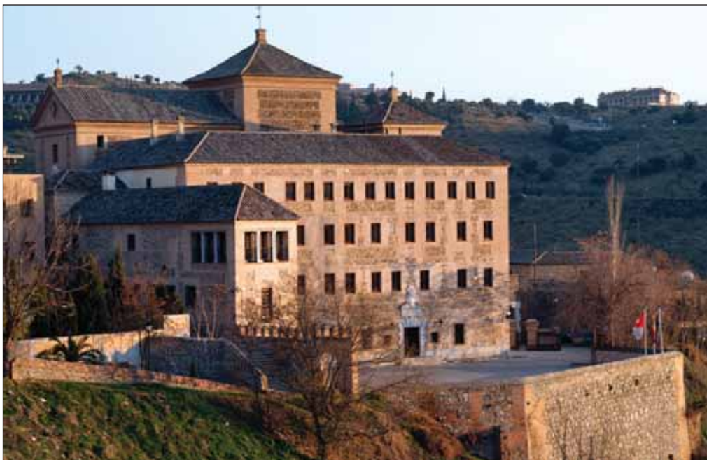
Convento de San Gil, sede de las Cortes de Castilla-La Mancha.

La entrada principal, de exclusivo uso para las grandes solemnidades, está constituida por una portada de estilo clásico, a la manera del siglo XVII, y utiliza elementos de la antigua puerta, enriqueciéndola con un escudo de la Región tallado en piedra. La puerta de uso más corriente se abre a la plazuela de aparcamiento, y está configurada por jambas almohadilladas, un escudo regional y la cartela con