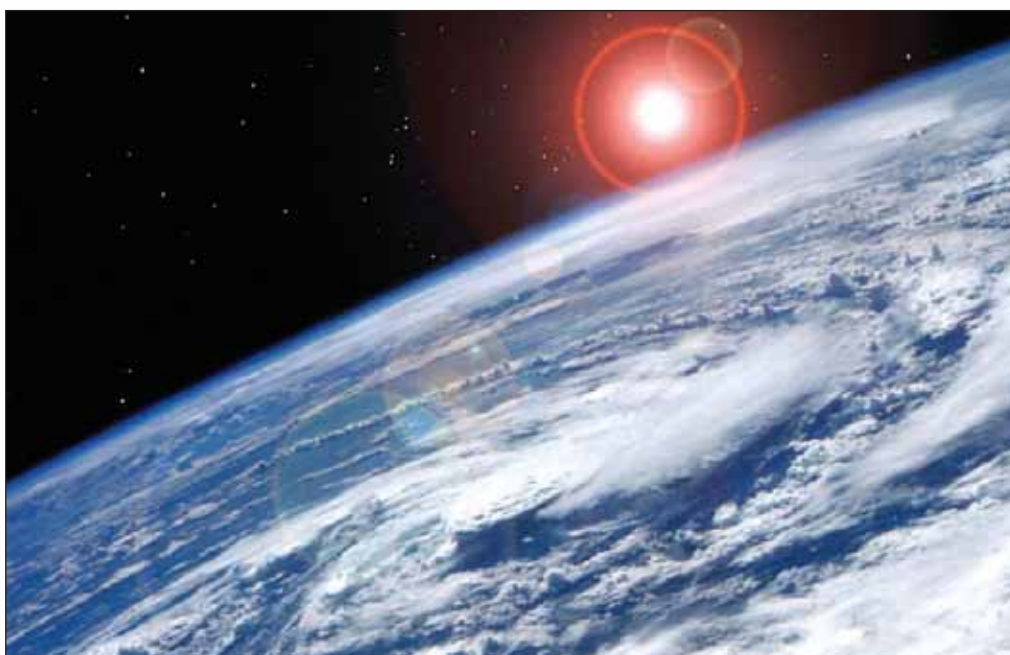
La energía solar que llega a la Tierra es limpia, renovable y abundante.

Una instalación solar fotovoltaica puede situarse casi en cualquier lugar y en instalaciones de diferente tamaño. Se trata de una tecnología renovable de generación de electricidad fácilmente instalable y cuya producción puede distribuirse directamente en los