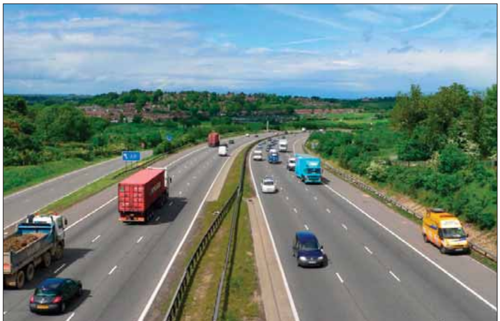
El sector del transporte es uno de los grandes emisores de gases de efecto invernadero (GEI).

Respecto de los sistemas estudiados con bioetanol en comparación con la gasolina