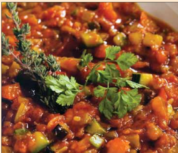
El típico pisto manchego es otro de los famosos platos que se pueden degustar en el restaurante Nuestro Bar.