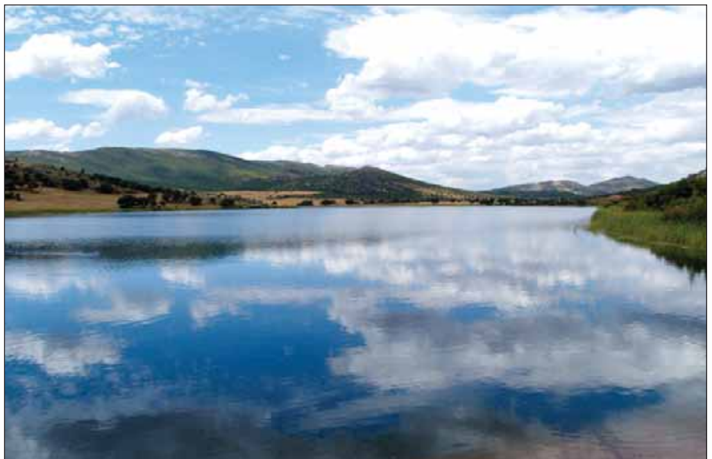
Vista del lago artificial ubicado en la finca El Palomar.

dero, “estamos entrando con toda la fuerza que podemos en las energías renovables, tanto de energía eólica como de energía fotovoltaica y fototérmica; estamos promocionando en la zona una almazara para la producción de aceite ecológico; hemos declarado la totalidad de nuestra ganadería de carne de vacuno de las dehesas de Sierra Morena como ganadería ecológica para producir carne ecológica; y estamos llevando adelante las infraestructuras necesarias para derivar las explotaciones agro-