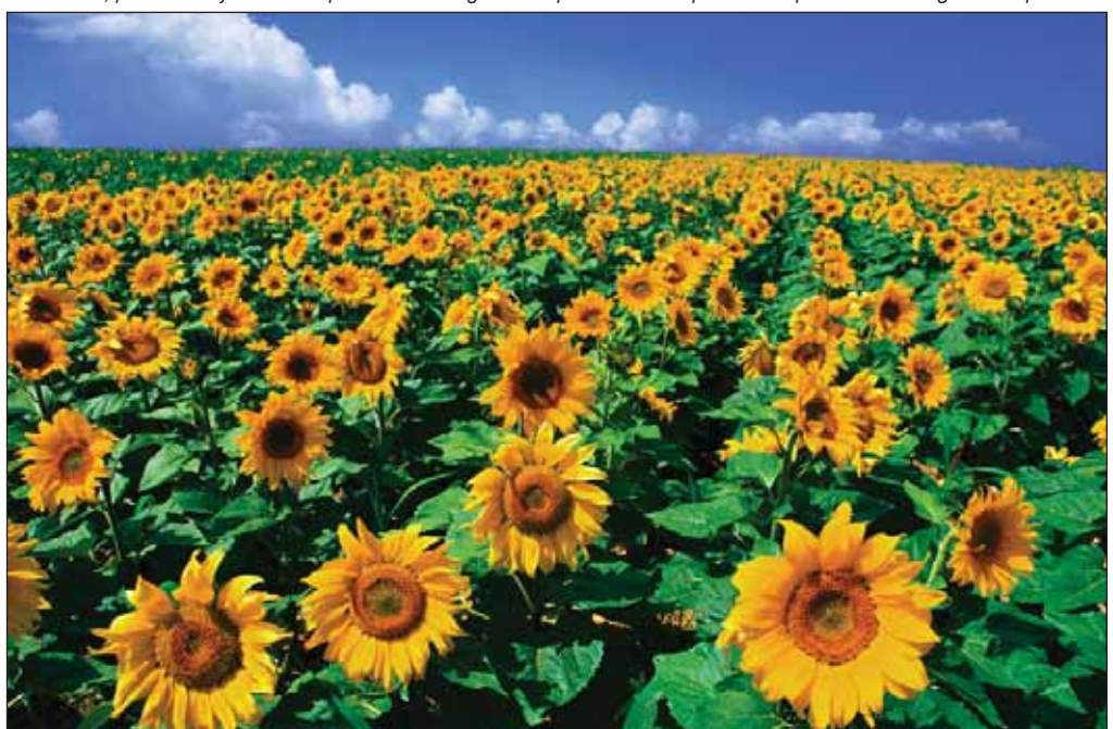
El fomento, promoción y cultivo de productos energéticos representa una oportunidad para el sector agrícola español.

Los resultados sobre emisiones de gases de efecto invernadero (GEI) expresados, en la mayoría de los casos, como emisiones evitadas por la utilización de las distintas mezclas de biocarburantes, pueden resumirse en los siguientes términos: →