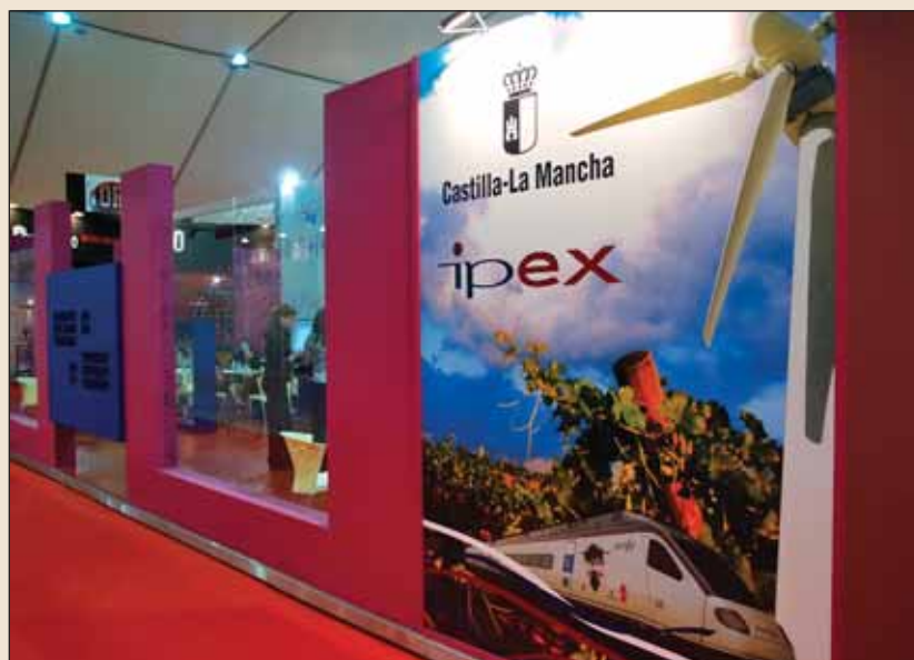
El IPEX contó en FENAVIN con un stand propio, actuando como centro de negocios de CLM.

Es interesante la labor de conexión realizada para conectar la oferta y la demanda semanas antes de la Feria: a los importadores se les facilitó toda la información de los expositores de la Región que se habían interesado por este programa y los expositores, a su vez, recibieron cierta información de estos importadores para facilitarles el contacto comercial antes de iniciar la Feria.