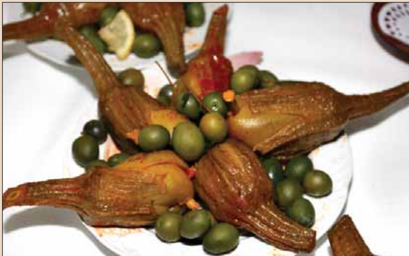
Las berenjenas de Almagro constituyen un santo y seña de la gastronomía de la localidad.

Otros productos que destacan son el tomate , el pepino y el pimiento , así como la producción de frutas , especialmente la sandía y el melón .