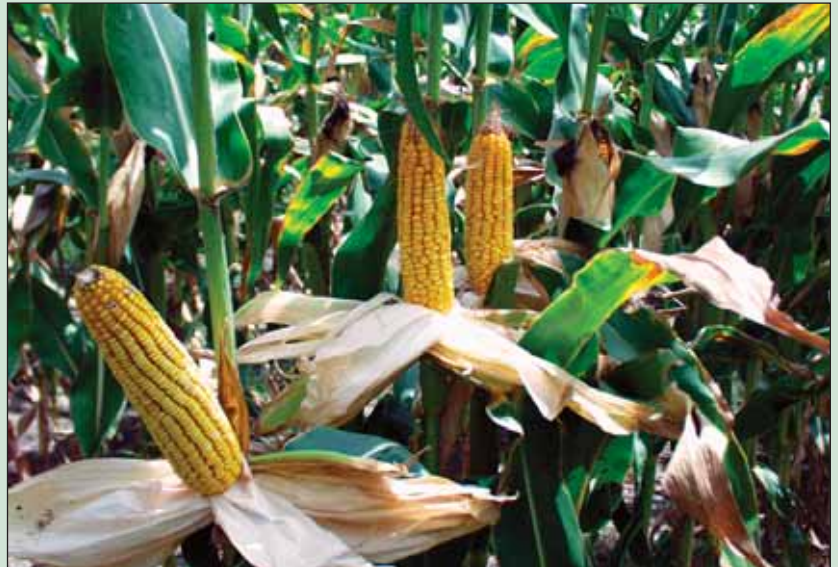
Las condiciones favorables para la producción de productos agrícolas energéticos ha dado como resultado que España sea en la actualidad el primer productor de bioetanol de la Unión Europea.

La proyección del reparto en el inventario nacional de GEI refleja, para el quinquenio 2008-2012, una tendencia al crecimiento más acentuada en los llamados sectores difusos , en particular en el transporte y en el residencial frente al industrial y energético . Esta es una razón, entre otras, por la que, en el marco de la Estrategia Española de Cambio Climático y Energía Limpia , recientemente presentada a las CCAA , se ha propuesto que en el año 2020 se pueda asegurar la aportación mínima del 10% de biocarburantes en el transporte .