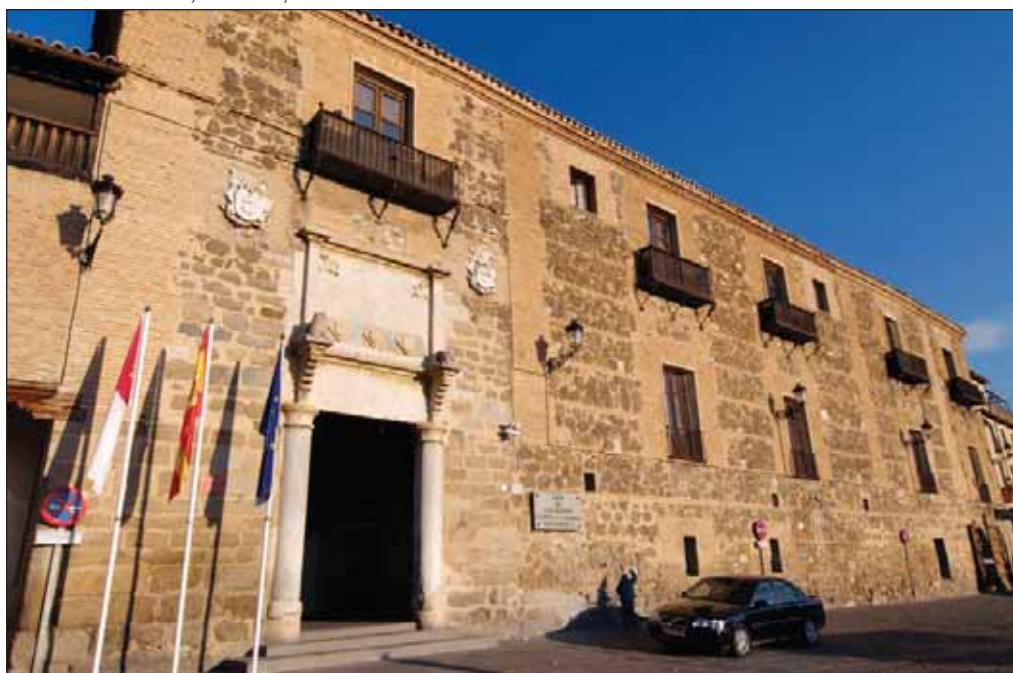
Palacio de Fuensalida, en Toledo, sede del Gobierno de Castilla-La Mancha.

Castilla-La Mancha reclama un lugar entre los mejores, no por su pasado sino por su saber hacer actual y por su proyección de futuro. Sin renegar de nuestro pasado, porque sabemos que el futuro tiene un corazón muy antiguo. En este marco es donde