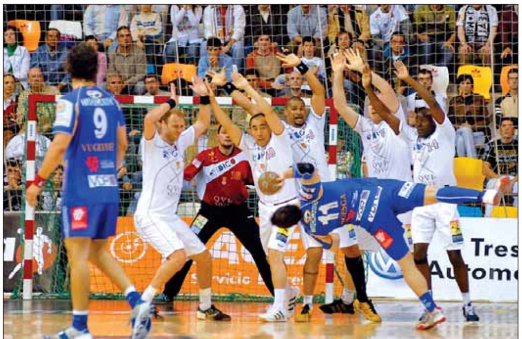
La afición manchega está disfrutando como nunca con los éxitos del Balonmano Ciudad Real. →