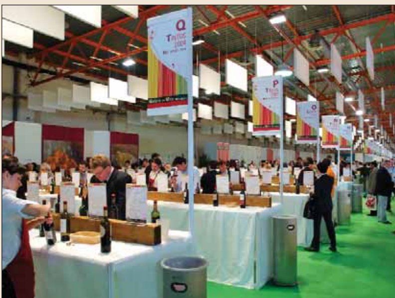
La Galería del Vino ha gozado de un enorme éxito en FENAVIN 2007.

Como otros años, junto a cada vino expuesto figuraba su correspondiente ficha , en español e inglés, con los datos más relevantes del vino en cuestión —nota de cata, origen, variedades, tipo de elaboración, precio...— y con la ubicación en la Feria del stand de la bodega correspondiente. En el cuaderno de cata que cada comprador recibe al entrar en la Galería se puede ir tomando las notas oportunas para planificar adecuadamente las posteriores entrevistas de negocios .