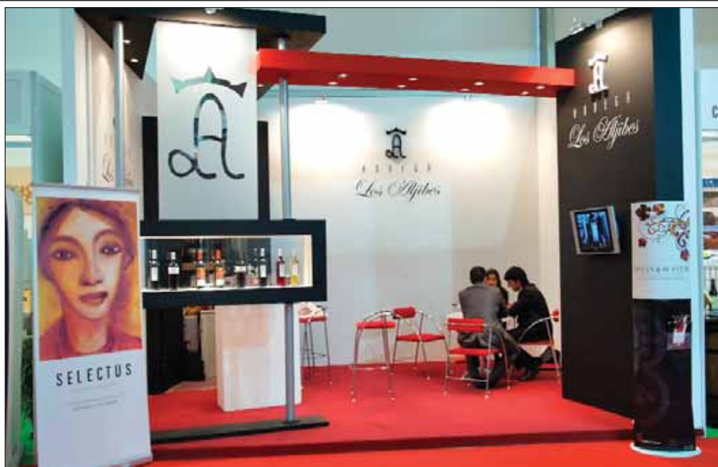
FENAVIN 2007 tuvo una importante representación de bodegas castellano-manchegas.

Asimismo, la celebración de FENAVIN 2007 ha servido, bajo su punto de vista, para dejar claro que la Organización Común de Mercado "debe ser un reto para nosotros desde la unidad del sector", destacó, defendiendo que el nuevo documento que verá la luz en julio no debe apostar por el arranque porque "la vid y la uva no pueden ser chatarra para aliviar los problemas del sector", sentenció.