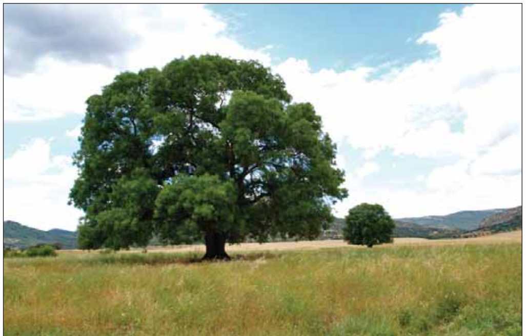
Un fresno, de varios centenares de años, adorna la ya de por sí maravilla que constituye la finca El Palomar.