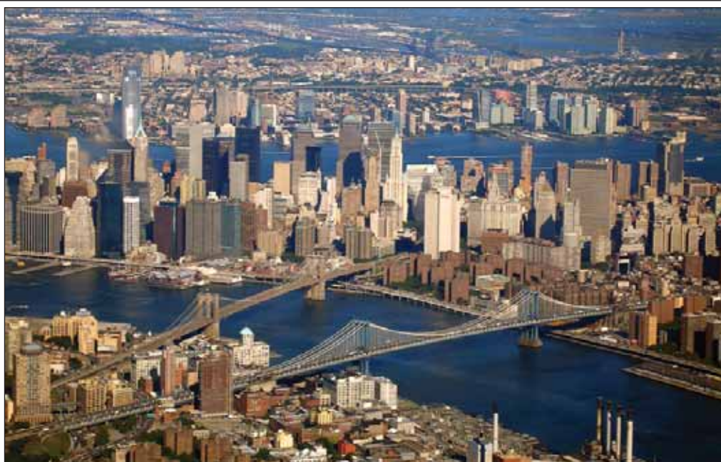
El terrorismo ha alterado de manera sustancial la vida de los ciudadanos de Estados Unidos. Foto Nueva York.

Para el Catedrático, estas características del terrorismo