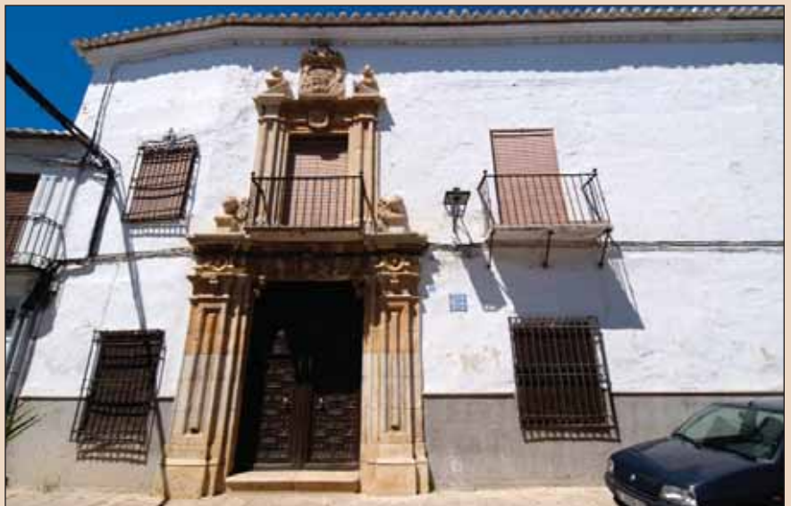
El tejido urbano de la ciudad guarda huellas del brillante pasado de Almagro.

Actualmente, Almagro presenta su candidatura a Ciudad Patrimonio de la Humanidad , por su calificación de " Ciudad de la Cultura y el Teatro ".