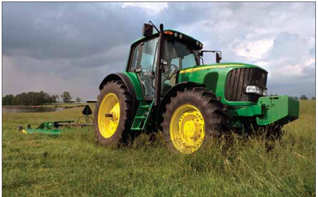
Durante la etapa de producción agrícola, sería importante reducir el número de labores de cultivo y aumentar el rendimiento en grano del mismo, para mejorar la eficiencia energética y disminuir las emisiones GEI.

Biodiésel. En la producción y distribución de biodiésel de aceites vegetales crudos (BD100A1), los mayores con-