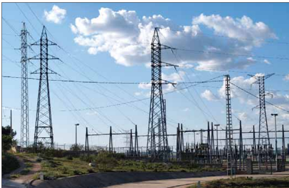
El sector eléctrico representa aproximadamente una cuarta parte de todas las emisiones GEI producidas en España.

Las cuatro áreas prioritarias en 2006 de los documentos de progreso presentados por la Ministra son la elaboración de escenarios climáticos regionalizados para España, base común para el desarrollo del resto de los trabajos; el establecimiento de las premisas metodológicas para la evaluación de impactos e integración de medidas de adaptación en recursos hídricos, teniendo en cuenta distintos escenarios climáticos y de demanda; la integración de medidas de adaptación al impacto de cambio climático en el litoral en el Plan Director de Costas; y los avances en la evaluación de impactos en la biodiversidad