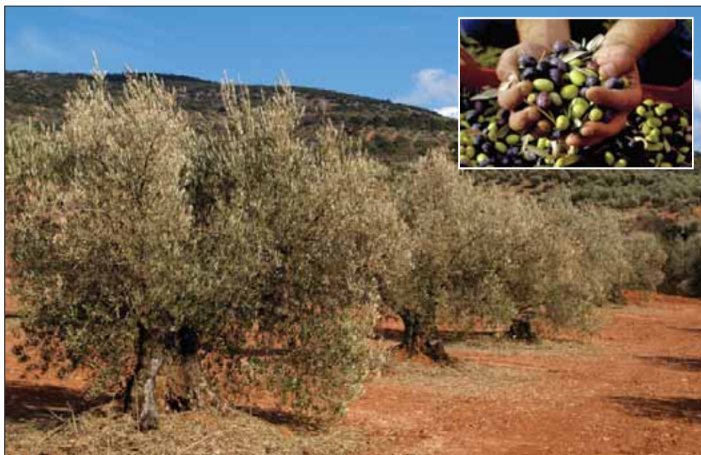
El olivar es un pilar de la agricultura del Campo de Calatrava, dedicando a su cultivo el 14% de las tierras labradas.

Los problemas financieros del emperador Carlos I hicieron a los banqueros alemanes Fugger beneficiarios de las rentas de las minas de Almadén y los vincularon a Almagro, trayendo consigo a sus administradores, cuyas casas