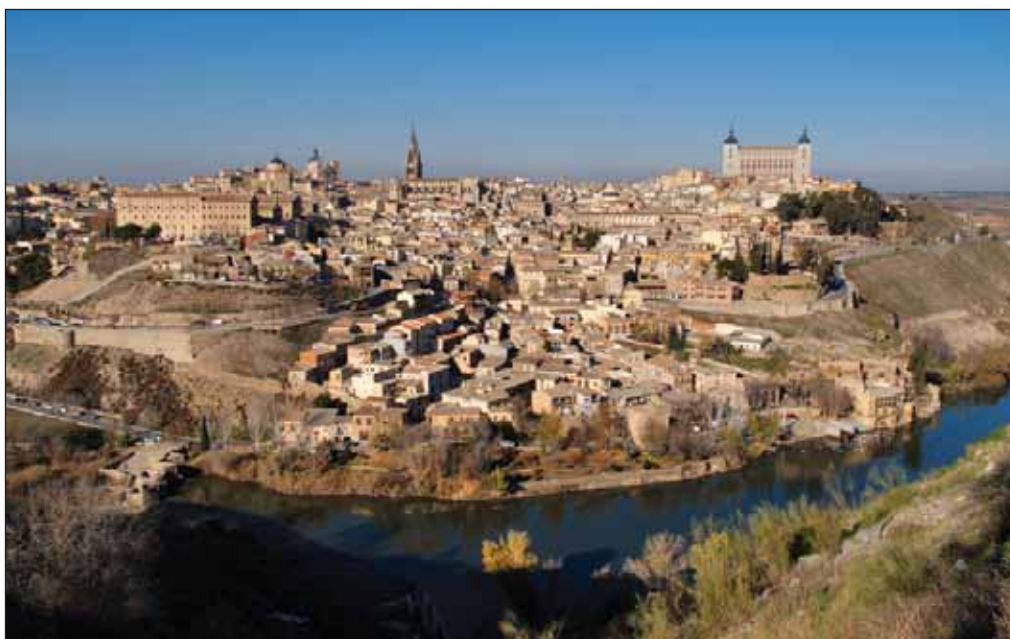
Según el Informe sobre Escenarios Climáticos Regionalizados para España, las regiones interiores de la Península Ibérica sufrirán una importante subida de temperaturas para el último tercio del siglo XXI. En la fotografía, vista de Toledo.

precipitación, tanto en términos de medias anuales como de su distribución mensual, es más incierto y muestra una gran dependencia de las fuentes de datos. La tendencia no es tan consistente como en el caso de la temperatura, sin embargo todas las proyecciones apuntan a una reducción de la precipitación en la mitad sur de la Península Ibérica de hasta el 40%. Muchos modelos indican también una reducción más pequeña en la mitad norte, pero para esta zona la proyección no es tan