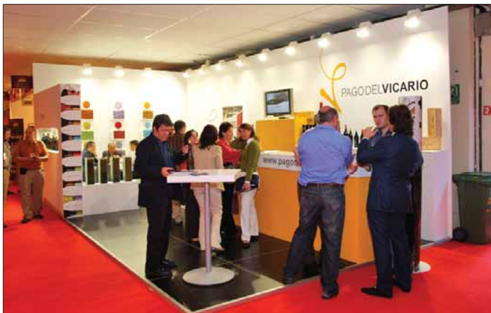
Los más importantes bodegueros castellano-manchegos estuvieron presentes en FENAVIN 2007.

Con la colaboración de la Universidad de Castilla-La Mancha, este proyecto aspira a contar en la provincia de Ciudad Real con profesionales de sala cualificados sobre vinos y el maridaje perfecto de éstos con la comida en cada momento.