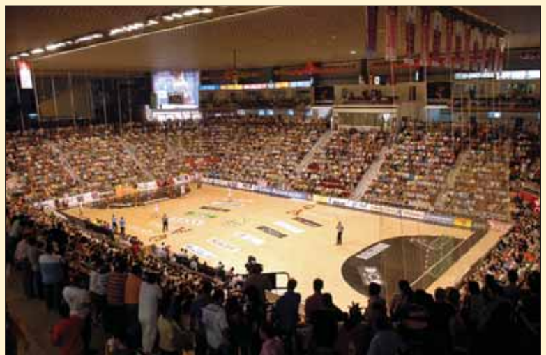
Pabellón Quijote Arena, sede deportiva del Balonmano Ciudad Real.

En la planta general se encuentran los 4 accesos