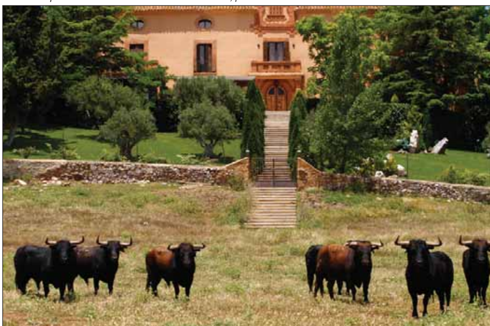
La corrida que será lidiada en la Feria de Albacete 2007, posando delante de la casa ubicada en la finca El Palomar.