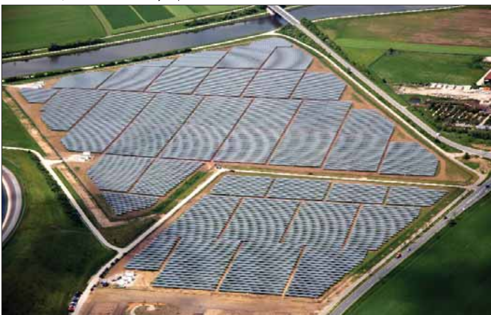
Una instalación de tecnología fotovoltaica se caracteriza por su simplicidad, silencio, larga duración, requerir muy poco mantenimiento, una elevada fiabilidad y no producir daños al medio ambiente.

La superficie que ocupa este tipo de instalación depende de la potencia que se quiera instalar y del tipo de módulo