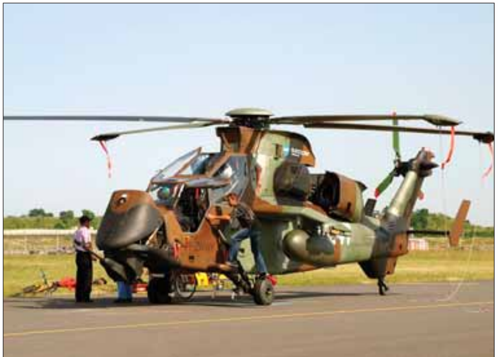
El modelo Tigre de la empresa Eurocopter será fabricado en Albacete.

Por otra parte, el procedimiento de la elaboración de un plan general debe permitir la participación ciudadana y desde el Partido Popular “creemos que hay que darle toda la dimensión posible a esa participación ciudadana: hay que escuchar a los vecinos porque ellos nos van a decir la ciudad que quieren. De esta forma se dota a un plan general de toda la flexibilidad y amplitud posible para que esa participación ciudadana se dé al máximo”, estima Carmen Bayod.