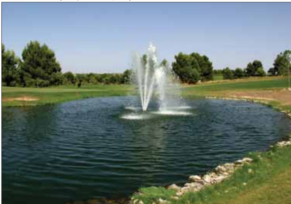
"Las Pinailas" es un magnífico y cuidado campo de golf.

Con estas premisas de conservación del medio ambiente, se ha logrado aumentar el ecosistema que existe alrededor