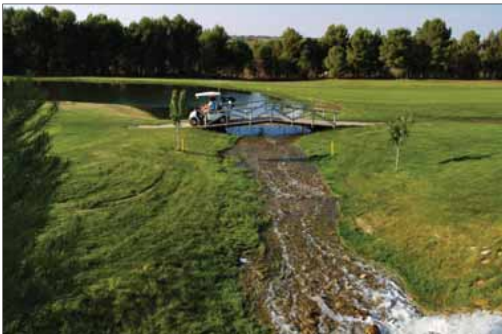
El diseño del club de golf "Las Pinaillas" ha sido realizado por la empresa de Severiano Ballesteros, Trayectory.

Posiblemente, el golpe de golf más famoso que se haya dado nunca sea el que realizó Alan Shephard golpeando una bola en la luna, en 1971, que fue visto por una audiencia de millones de personas de todo el mundo. El palo que empleó está en el museo de la USGA.