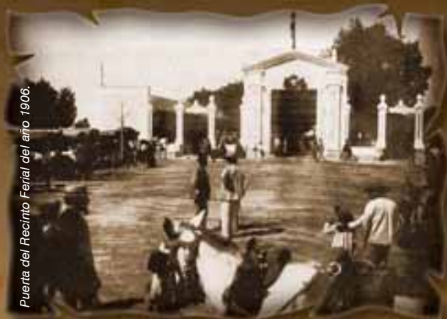
Puerta del Recinto Ferial del año 1906.