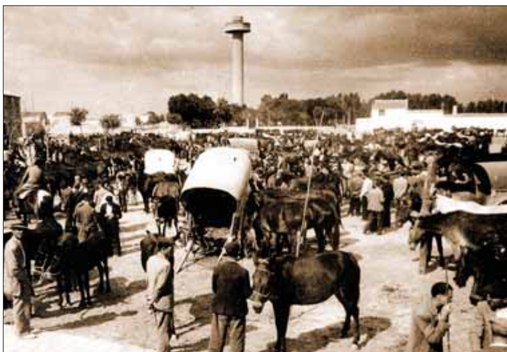
Ejidos y Fiesta del Árbol a mitad del siglo XX, donde se puede contemplar el importante mercado de ganado instalado en “La Cuerda”.

Los presuntos compradores examinaban la dentadura del rucio, para saber la edad que tenía. Después de mucho estira y afloja se cerraría el trato. Se daría una cantidad en