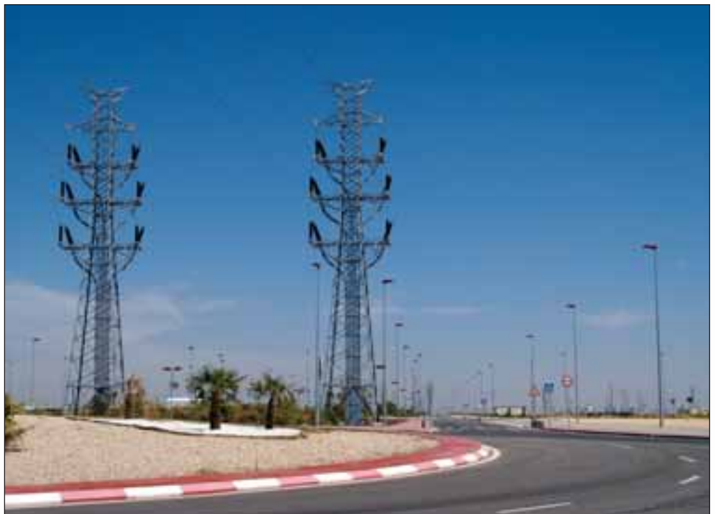
Zona de ampliación del Polígono Industrial Campollano de Albacete.

Primero, explica el Alcalde, "queremos conservar nuestro suelo, no queremos los modelos de Murcia ni los de las costas alicantinas y valencianas."