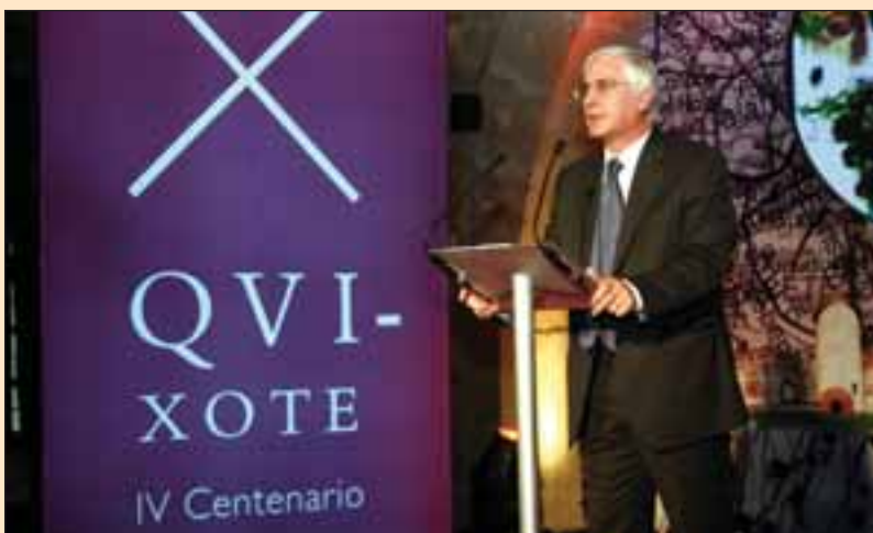
José María Barreda ha estado presente, siempre, en los grandes proyectos de la Región. En la fotografía durante la presentación del IV Centenario del Quijote.