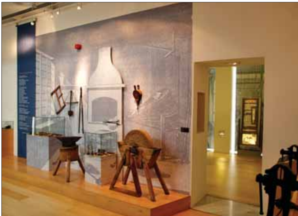
Útiles representativos de un antiguo taller de navajas. Museo de la Cuchillería de Albacete. →

Con el apoyo del consejero de Industria y Tecnología, quien ha mostrado ya su interés por promocionar la marca, existe el proyecto de realizar una campaña a nivel nacional