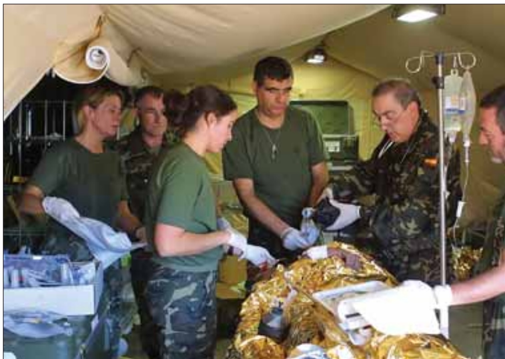
Militares españoles atienden, el pasado mes de diciembre, a los heridos del accidente de tráfico en Pakistán, donde un autobús con personal civil cayó desde una altura de 30 m. ocasionando doce muertos y ocho heridos.

Sabemos que el futuro está en nuestras manos, que dependemos de nuestro trabajo y somos conscientes de todo lo que podemos hacer juntos.