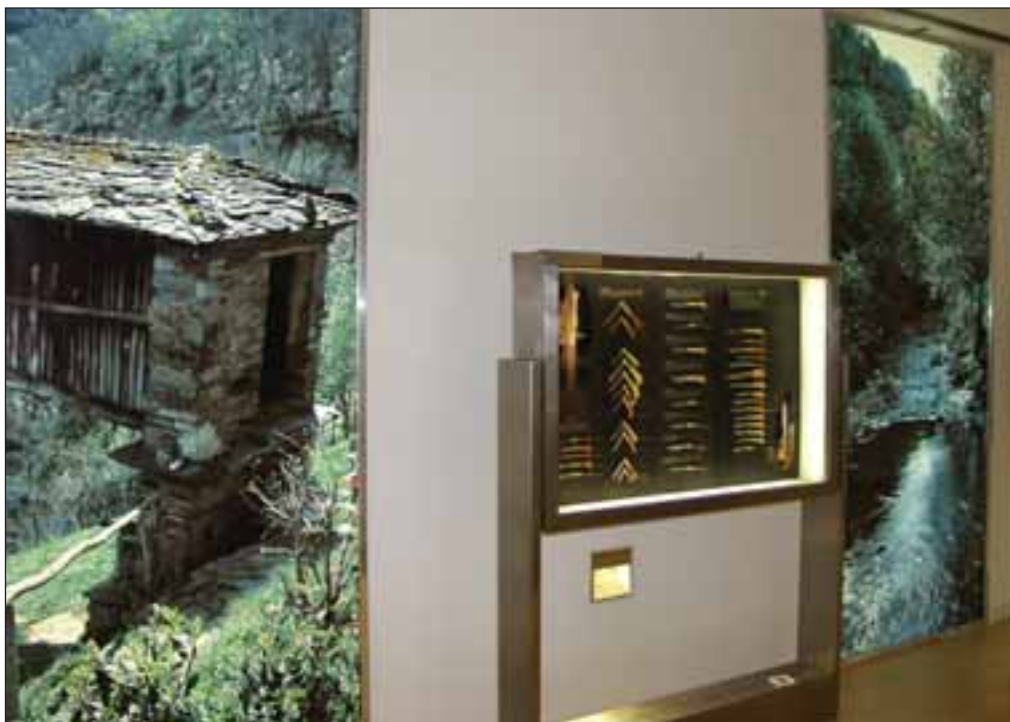
Una de las salas del Museo de la Cuchillería de Albacete.

La marca AB-Cuchillería es un sello de garantía de ori-