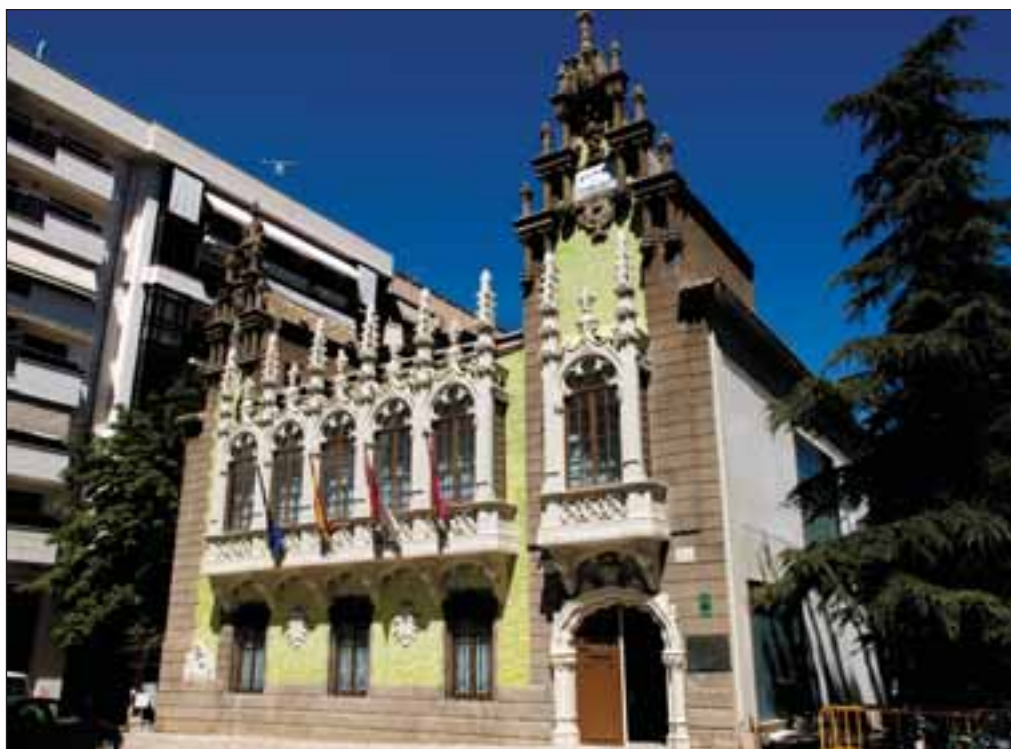
Casa de Hortelano, sede del actual Museo de la Cuchillería de Albacete.