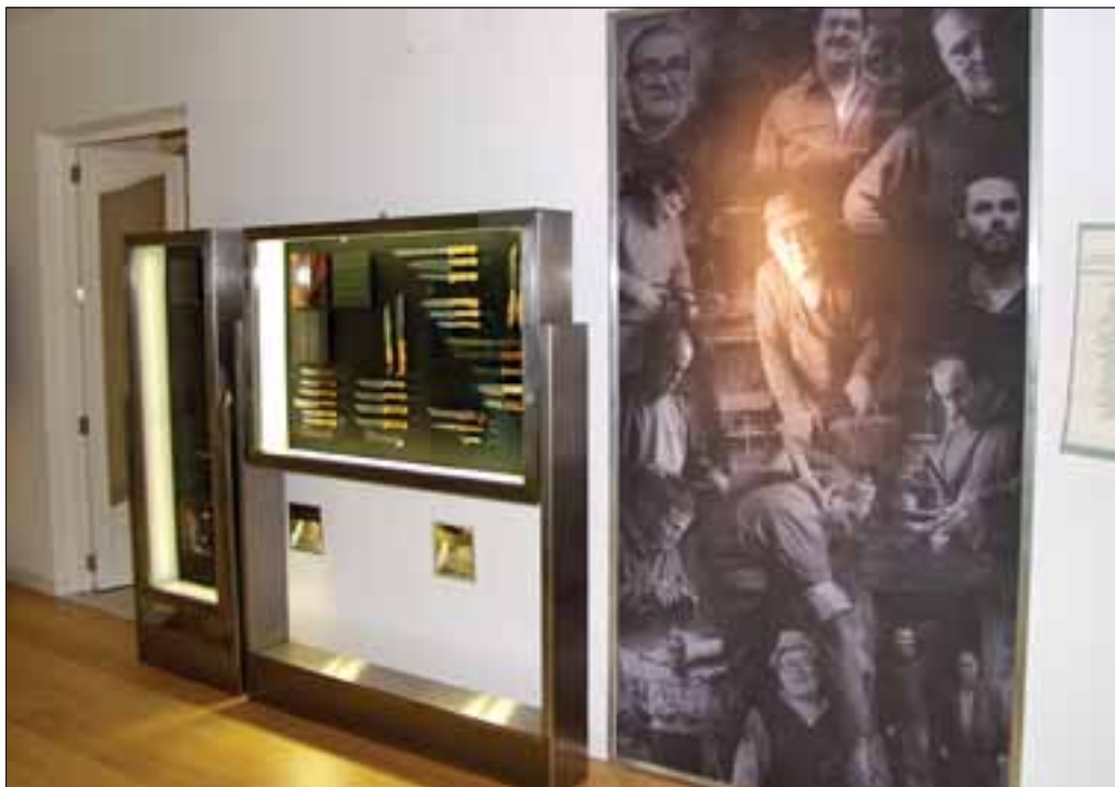
Una de las salas del Museo de la Cuchillería de Albacete.

En siglo XVIII, según los aportes documentales de Martínez del Peral, el emplazamiento de los talleres se diversificó, no localizándose en núcleos tan delimitados y concentrados como antes: la calle Zapateros, con el 32% de las domiciliaciones, seguía siendo el centro del foco más impor-