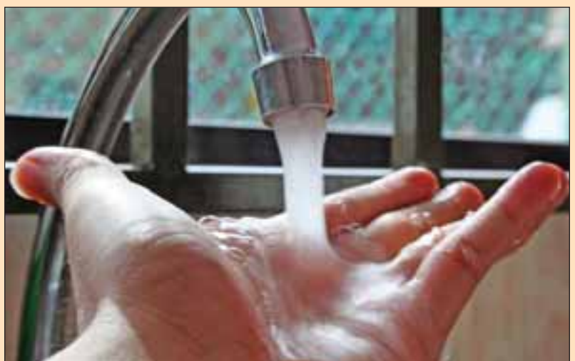
La nueva planta de ósmosis permitirá beber agua de la máxima calidad.