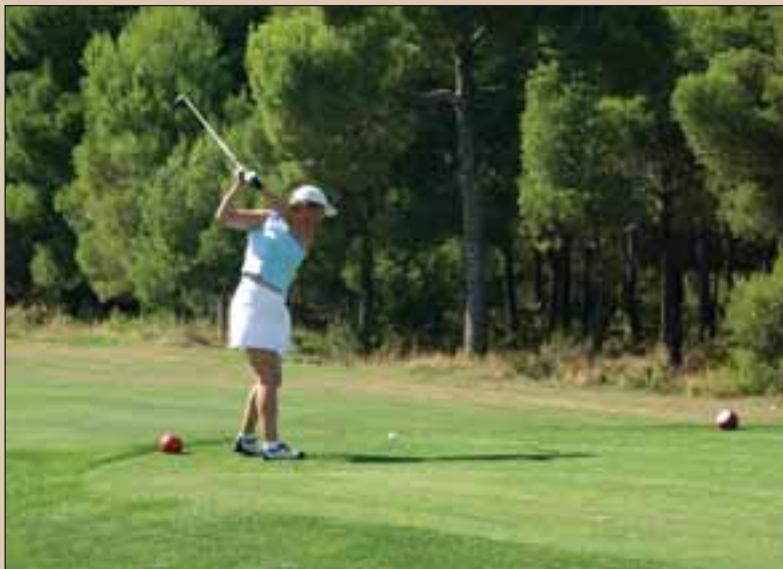
A "Las Pinaillas" acude gente de toda España, particularmente de las regiones limítrofes.

Lo que es impecable es que todos los jugadores, tanto profesionales como aficionados al golf, que han pasado por las instalaciones del Club han quedado enormemente satisfechos, como prueba el reconocimiento y el buen nombre que tiene el club de golf "Las Pinaillas" fuera de las fronteras de la provincia y de la Región.