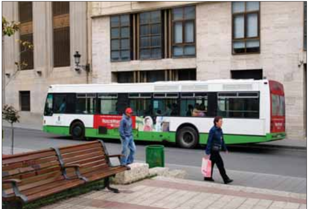
La nueva estructura de autobuses públicos permitirá agilizar los recorridos acortando los desplazamientos.

En opinión del Alcalde, cuando empiece a experimentarse este nuevo trazado de autobuses el próximo mes de octubre, bajo la gestión de unas de las empresas más experimentadas, “se podrán multiplicar por varios dígitos el número de usuarios del autobús municipal, que actualmente no está en consonancia con las necesidades de los ciudadanos”, manifiesta Pérez Castell.