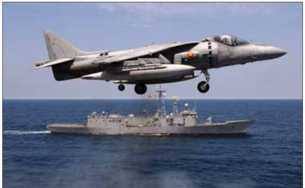
Un avión Harrier de la Armada, en vuelo junto a la Fragata Santa María en aguas de Cádiz, durante una demostración aeronaval en el portaaviones “Príncipe de Asturias”.

trabajado con rigurosa transparencia y plena honradez y de él aprendí el valor del trabajo bien hecho, a dar la cara