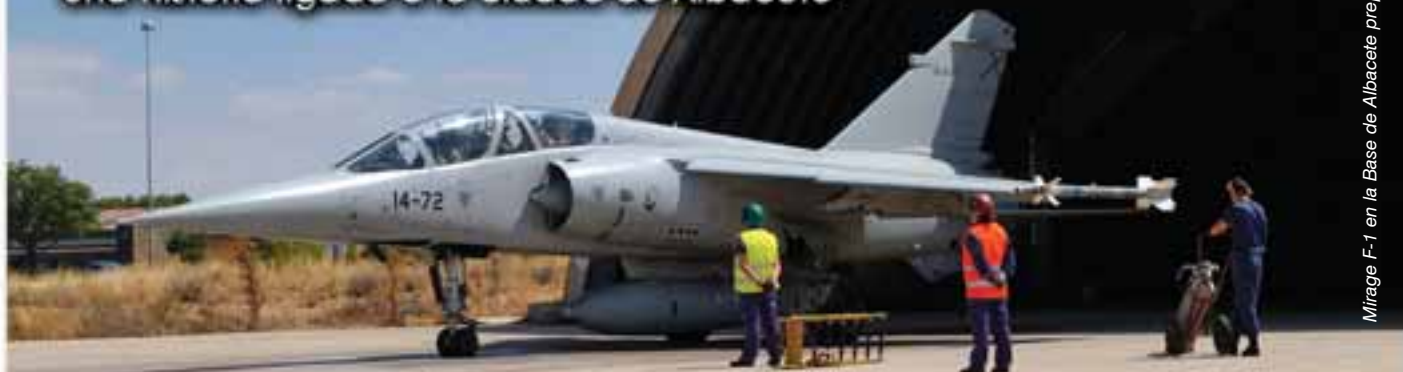
Mirage F-1 en la Base de Albacete preparado para su despegue.

Una historia ligada a la ciudad de Albacete