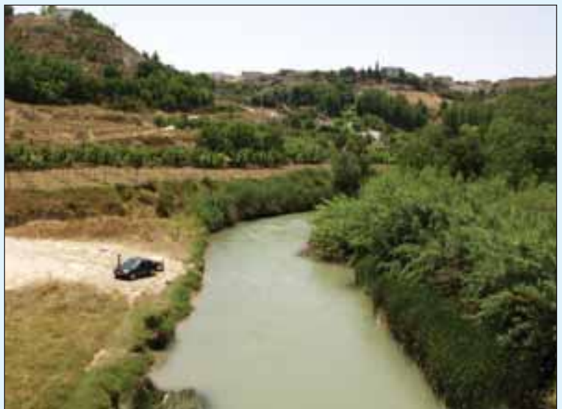
Río Júcar a su paso por la localidad de Valdeganga (Albacete).

“ Castilla-La Mancha está seca y no hay más que ver cómo están los pantanos de Entrepeñas y Buendía : cuando el Partido Popular llegó al Gobierno Nacional , estos pantanos tenían entre 180 y