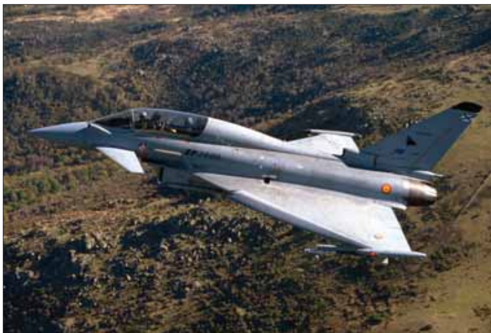
El avión que va a reemplazar al Mirage F-1 es el Eurofighter 2000 (en la foto), un avión de generación muy avanzada.

La participación de la Maestranza en el mantenimiento del Eurofighter está prevista que empiece a partir del segundo año del avión en servicio, con ayuda de ingeniería y algún pequeño apoyo de mantenimiento a la Base Aérea de Morón. Posteriormente, a la finalización de los cinco primeros años en los que las capacidades de la Maestranza deben estar disponi-