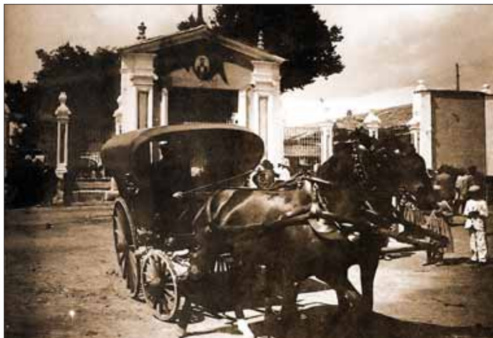
Un carruaje circula junto a la Puerta de Hierro del Recinto Ferial en los primeros años del siglo XX.

todo tipo, casetas de asociaciones, verbenas, espectáculos infantiles... A lo largo del paseo de la Feria, que nos conduce