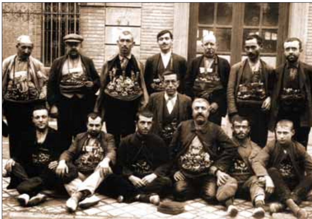
Vendedores ambulantes de navajas en Albacete a principios del siglo XX.

el Consejo de Castilla completó esta orden notificando a los cuchilleros que no fabricasen ese tipo de armas blancas prohibidas y que rompieran las existentes. A causa de estas y otras disposiciones jurídicas, los gremios artesanos albacetenses tuvieron que cerrar sus obradores, lo que no supuso, en absoluto, el abandono de la costumbre de llevar y utilizar navajas y sí produjo el aumen-