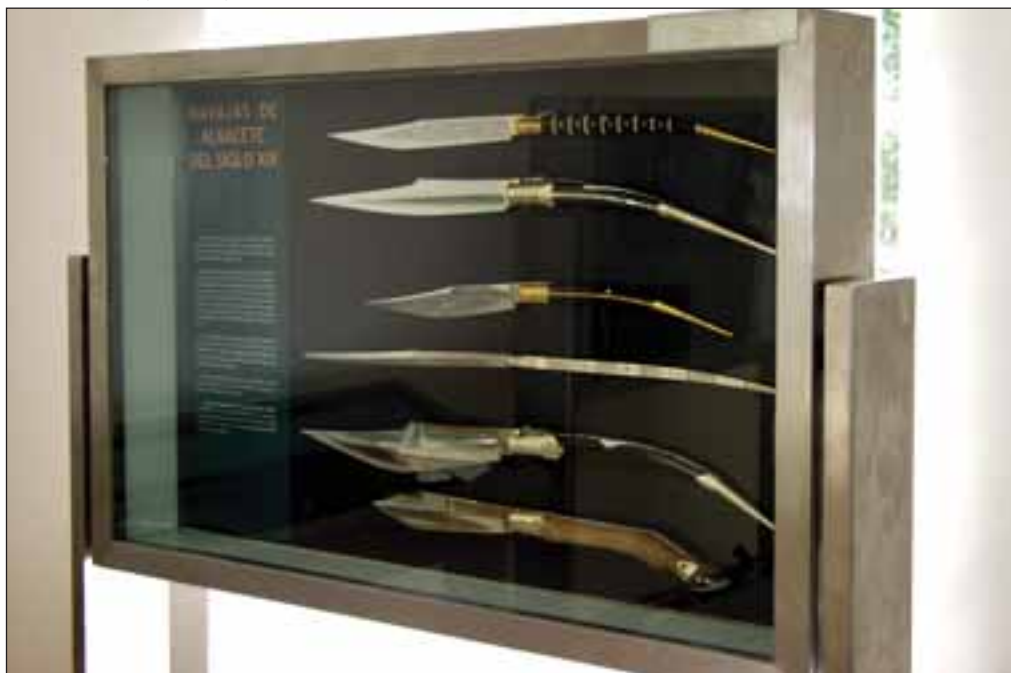
Vitrinas con navajas del siglo XIX en el Museo de Cuchillería de Albacete.

versos lugares de Europa. En los informes económicos, manuales, diccionarios y libros de viajeros de ese tiempo podemos encontrar los primeros datos de la producción, con frecuencia contradictorios.