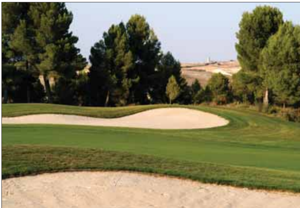
A 18 kilómetros de Albacete, "Las Pinailas" es un espacio donde practicar deporte mientras se disfruta de la naturaleza.

En España el primer club de golf se creó en Las Palmas