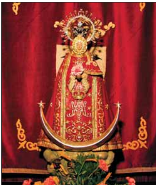
La Virgen de Los Llanos, Patrona de Albacete.

En 1624, la imagen de la Virgen de los Llanos se encon-