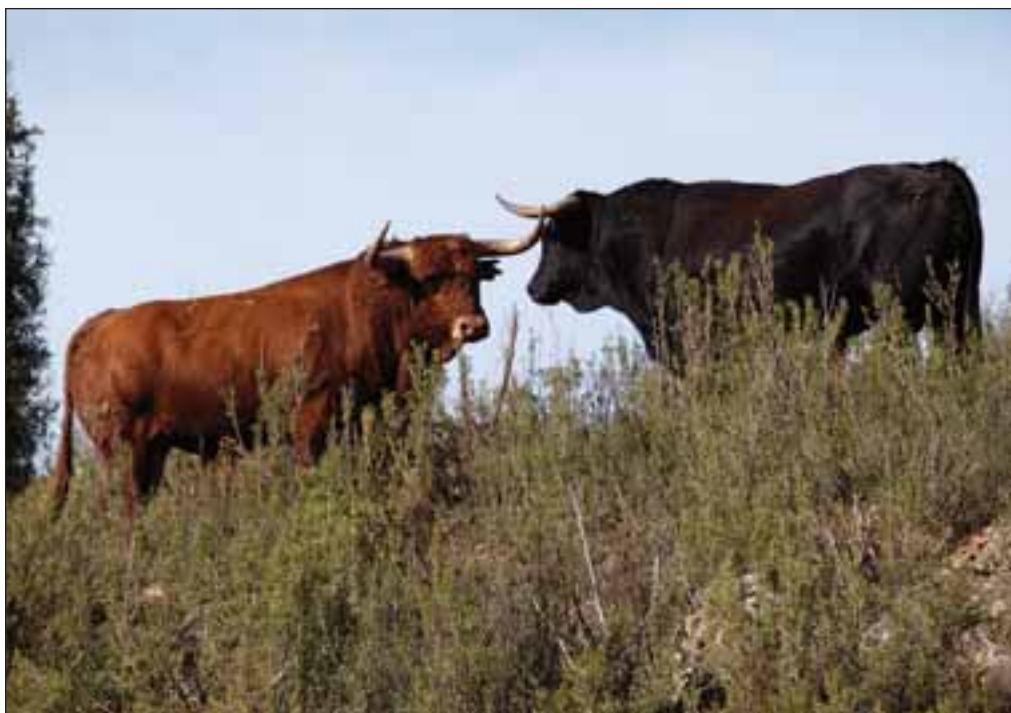
Los toros constituyen el principal atractivo de la Fiesta Nacional.

El día 12 , con toros de "Montalvo", "una corrida muy bien presentada, sin mucho volumen pero con unas cabezas muy bonitas", lidiarán los diestros Sebastián