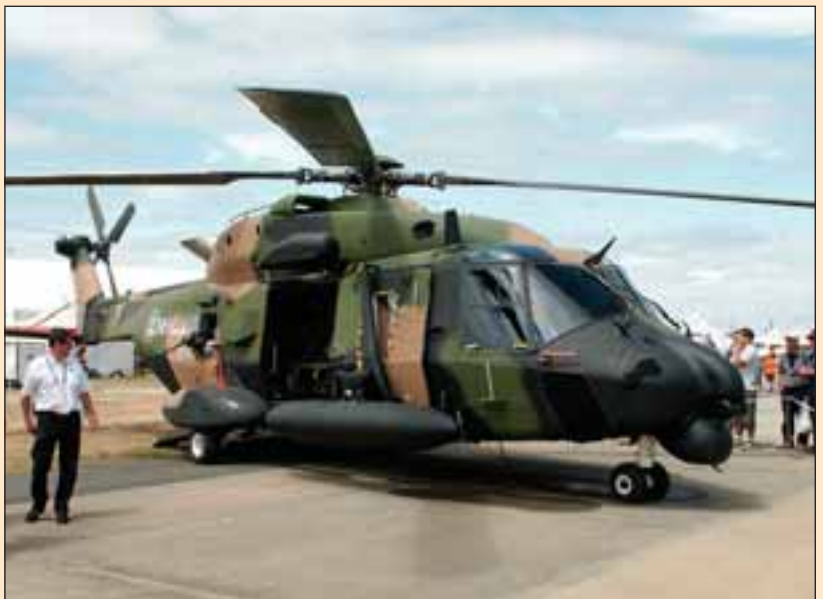
La instalación de Eurocopter es, probablemente, la iniciativa industrial más importante desde el punto de vista cualitativo que se ha producido en España.

“La instalación de Eurocopter es, probablemente, la iniciativa industrial más importante desde el punto de vista cualitativo que se ha producido en España en los últimos años y que haya venido a Albacete , aquí, a Castilla-La Mancha , es una buena noticia para nosotros”, apunta Pardo .