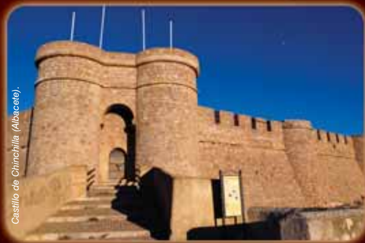
Castillo de Chinchilla (Albacete).

Albacete era, en el año 1269, una pequeña aldea dependiente de la villa de Chinchilla