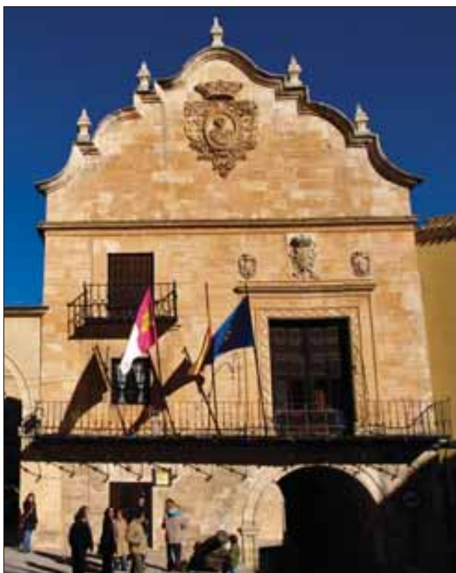
Fachada principal del Ayuntamiento de Chinchilla (Albacete).

auque muy perdido, en la zona de la Parra, Callejón de los Gatos y calles de Marzo, Santa Quiteria, El Cid y Cornejo. Sobre la muralla que cercaba el poblado, -que entre los siglos XVI y XVII, era frecuentemente reforzada-, que aparece reseñada en los libros municipales como "La Cerca", se sabe que continuamente se estaba levantando y demoliendo, lo cual nos da una idea de que servía para proteger al poblado de invasiones y cercar al lugar de las epidemias de peste, muy frecuentes en la época. La muralla fue ampliada hasta la ermita de San Antón, y contaba con varias puertas, algunas de las cuales todavía existían en el siglo XVIII, como la llamada puerta de las Almenas, ubicada en el actual cruce de la calle Los Baños y calle Feria. Otras puertas han mantenido sus nombres en la toponimia del callejero local, como las puertas de Madrid, Valencia, Murcia y Chinchilla. Aunque la muralla desapareció totalmente, se puede reconstruir sobre el plano de la ciudad. A juzgar por los arquitectónicos, conservados o que se tiene noticia podemos citar edificios como la Parroquia de San Juan, tres conventos, y varias casas-palacios, aquella fue una época de gran actividad constructiva y de desarrollo urbano.