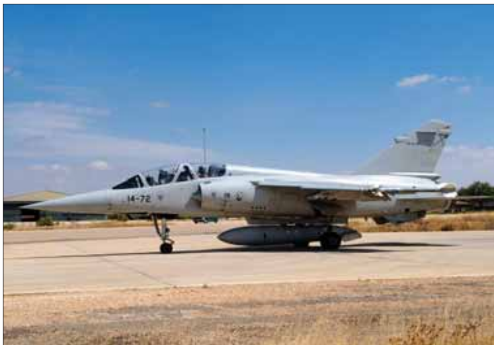
Mirage F-1 preparándose para el despegue en la Base Aérea de Los Llanos.

La mayor parte de las misiones son de entrenamiento y, en menor medida, de identificación de trazas desconocidas. Puesto que el sistema de radares en tierra identifica a los aviones mediante planes de vuelo y una serie de sistemas, es poco frecuente que haya que salir a identificar, por lo que la mayor parte de los vuelos obedecen a motivos de en-