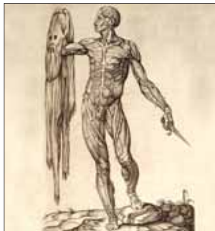
Imagen del libro "Historia de la composición del cuerpo humano".

impresión de las mismas, y, lo que es más importante, la rectificación gráfica de los errores de Vesalio. Encargará de su ejecución al pintor español Gaspar Becerra, de la escuela de Alonso Berruguete primero y de la de Miguel Ángel después. Las figuras anatómicas del Renacimiento carecen de la fría impersonalidad de las ilustraciones de los modernos tratados de Anatomía. La representación cuidadosa de la realidad de la forma se compagina perfectamente con una interpretación personal abandonada a la inspiración del artista. Esta congruencia entre la ciencia pura y el arte es característica de la época renacentista.