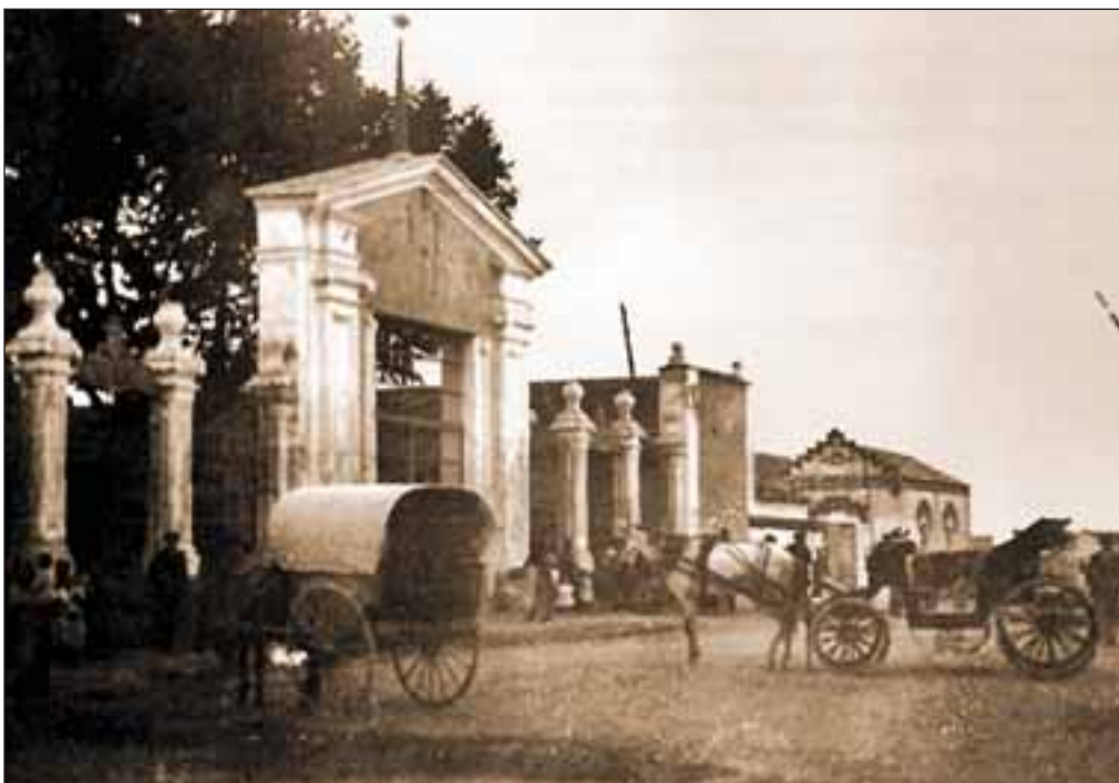
Puerta del Recinto Ferial del año 1921.

de nuevo la Feria al casco urbano, lo que provocó un largo pleito con los frailes del convento franciscano, que no querían perder los beneficios económicos que el mercado les reportaba.