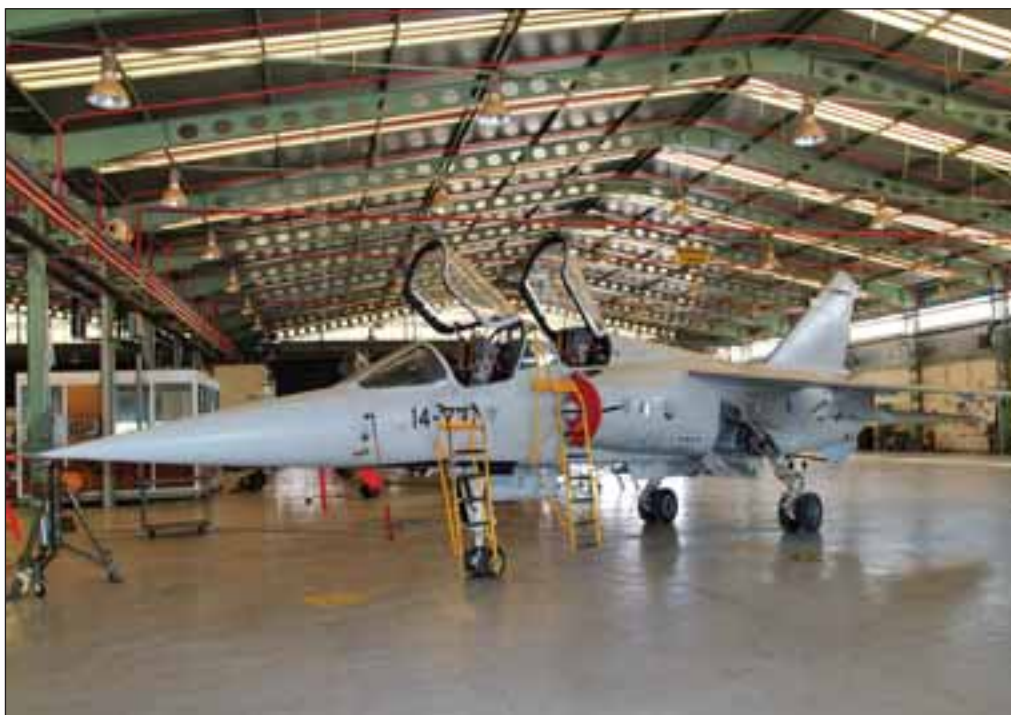
Mirage F-1 de doble cabina en una operación de mantenimiento en las instalaciones de la Base.

Dado que los países Bálticos no tienen fuerza para hacer esa tarea, en su día se la solicitaron a la OTAN, que decidió dar cobertura de Policía Aérea a esos países por turnos rotatorios, primero de tres meses y ahora de cuatro. España se encuentra en el bloque 10, es decir, ya ha habido 9 países