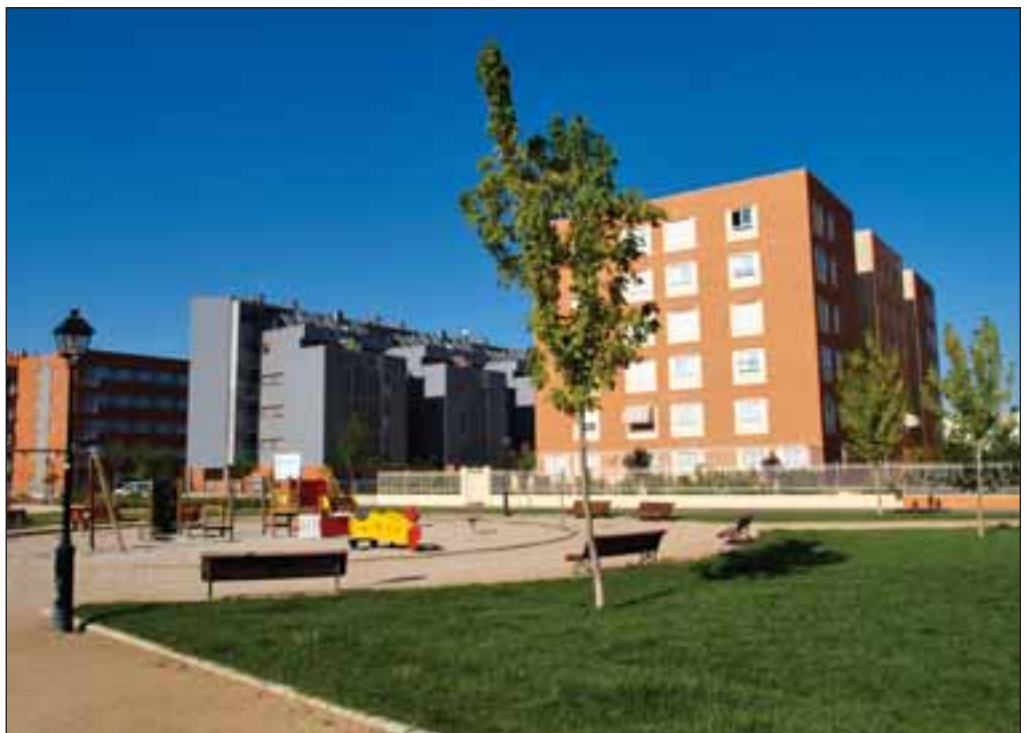
Vista de los nuevos barrios con zonas ajardinadas desarrollados en Albacete.

Los ayuntamientos, prosigue Bayod, están muy endeudados porque “casi el 30% de los servicios que prestan son servicios no propios, de los que