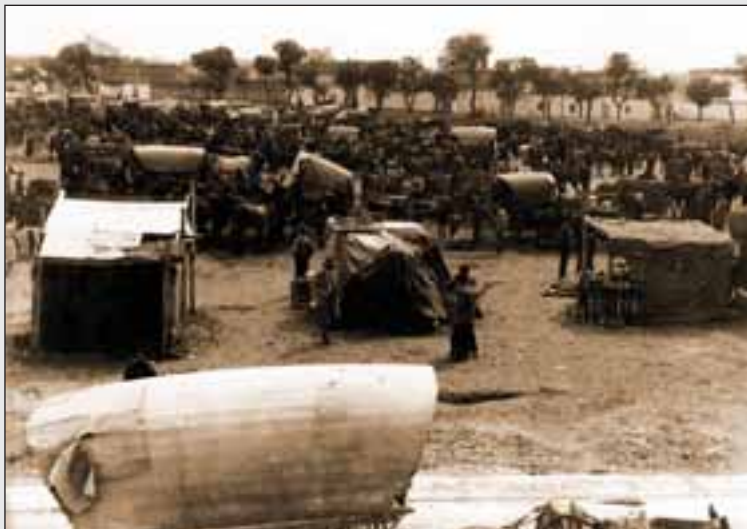
Aspecto general de "La Cuerda" durante una Feria allá por los años 50 del siglo XX.

Con la constante inmigración de personas venidas de otros lugares, principalmente para asistir con su ganado a la Feria de Albacete , la villa comenzó a crecer. Gente venida de todos los lugares de España empezaron a ocupar los huertos cercanos a las inmediaciones de la villa, hasta alcanzar casi toda la extensión que ocupó en los siglos siguientes. En la Villa Nueva (posteriormente conocida como Alto de la Villa y actualmente como Villacerrada ), la población siguió extendiéndose, junto a la Plaza , el Ayuntamiento y la Torre ; en el Cerrillo de San Juan, la vieja iglesia fue reemplazada por otra mayor y más moderna. Por otro lado, no hay mención alguna del viejo castillo que estaba en la Cuesta de la Purísima , probablemente fue demolido en años anteriores, dando paso a la apertura de nuevas calles, generalmente dirigidas hacia las ermitas de extramuros, de las que recibieron los nombres: Rosario , San Antón , San Sebastián , Santa Catalina , etc.