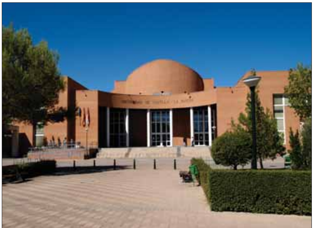
Vicerrectorado del Campus Universitario de Albacete.

En palabras del Alcalde, “nos encontramos en la trayectoria de cambiar cualitati-