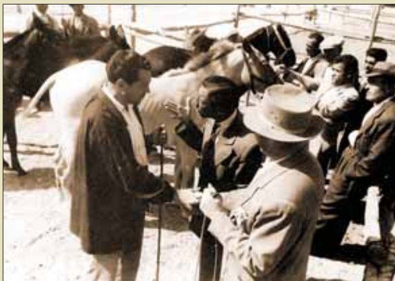
Unos tratantes de ganado cerrando un trato. Medios del siglo XX.

Tras ganar el Ayuntamiento el pleito con los franciscanos para establecer de nuevo la Feria en la villa de Albacete, la Feria de Ganado se acerca de nuevo al núcleo urbano y en 1783 se construyó el embrión del actual edificio del Recinto Ferial, conocido como La Sartén. Estableciéndose la Feria definitivamente en la población. Por estas fechas comienza el resurgir económico de Albacete, ligado al establecimiento definitivo de su Feria, verdadero centro de peregrinación comercial hacia la ciudad de gentes de todas las comarcas vecinas, e incluso procedentes de otras ciudades como Andalucía, Murcia, Valencia, etc. Esta gran afluencia de feriantes de todas las provincias limítrofes, y aún de algunas bastante alejadas, constituye la base más progresiva de la historia de Albacete. Las cifras de concurrencia de algunos años, por ejemplo de 1831, en el que se traen de lugares lejanos 56.744 cabezas de ganado mayor para venderse en “La Cuerda”, colocan a la Feria de Albacete a la cabeza de todas las de España. La influencia histórica de la Feria en el progreso de Albacete se manifiesta también en la inmigración que ha afluído a la ciudad de elementos humanos muy positivos. Muchos de los comerciantes e industriales que se establecieron en Albacete durante los siglos XVIII al XIX, lo hicieron primeramente como feriantes, que se establecerían después definitivamente considerando el gran futuro que veían en Albacete.