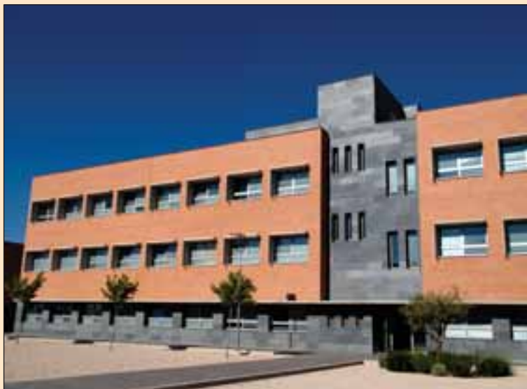
Facultad de Medicina de la Universidad de Castilla-La Mancha en el campus de Albacete.

Estoy orgulloso, además, de que la Facultad de Medicina de Albacete sea una de las de mayor calidad que hay en nuestro país, como demuestra el éxito alcanzado por sus licenciados en las pruebas MIR ”, atestigua, dejando translucir esa sana complacencia que siente quien ha arrimado el hombro para que estos proyectos salgan adelante y ahora contempla que son una magnífica realidad. “Me llena de alegría ver que tienen esta oportunidad tantos jóvenes , sobre todo mujeres –porque en la Universidad de Castilla-La Mancha la mayoría de las estudiantes son mujeres -, porque ello va a tener en el futuro una importante carga de transformación social”, estima, reafirmando que estas magníficas realidades son claves para el avance de la Región.