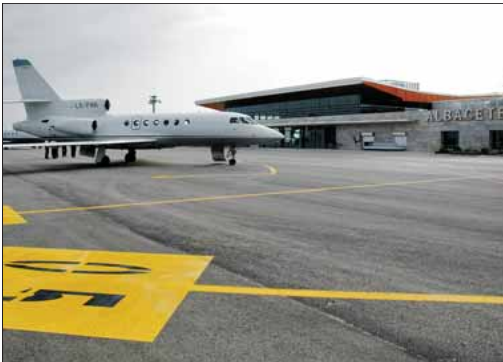
Albacete es una ciudad magníficamente comunicada con el resto del país. En la fotografía el Aeropuerto de Albacete.

tienen alcance nacional. Y eso es lo que está permitiendo que Albacete camine con paso firme por la senda del progreso”.