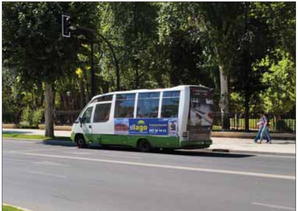
La mejora del transporte público constituye una de las demandas del Partido Popular.