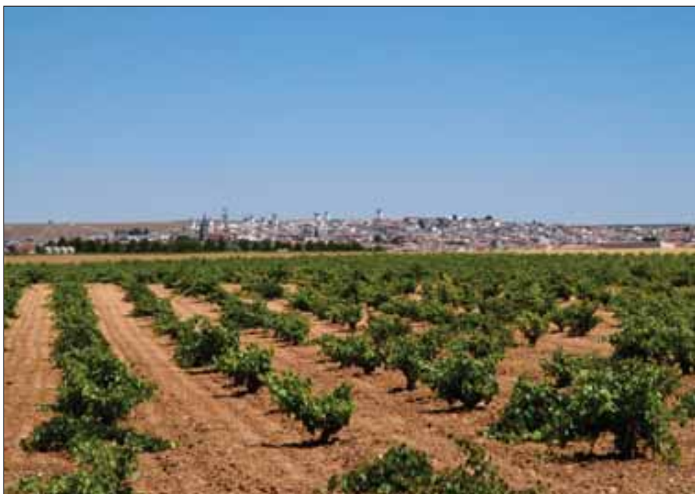
La vid es clave para Castilla-La Mancha, en la que se produce la mayor concentración de viñedo del mundo y donde más de 80.000 familias dependen de este cultivo, sin olvidar su gran importancia desde el punto de vista medioambiental.

El viñedo, continúa el secretario de Estado de Defensa, Francisco Pardo, también “es clave para una Región como la nuestra, en la que se produce la mayor concentración de viñedo del mundo y donde más de 80.000 familias dependen de este cultivo, sin olvidar su gran importancia desde el punto de vista medioambiental para evitar la desertificación. Por tanto, la defensa del sector vitivinícola es otro elemento clave para el Gobierno de Castilla-La Mancha, pero también para el Ejecutivo de España. Ambos van a trabajar conjuntamente para lograr que la Organización Común de Mercado (OCM) del vino que finalmente sea aprobada en Bruselas favorezca en mayor medida al sector vitivinícola español y, por supuesto, al castellano-manchego”, ase-