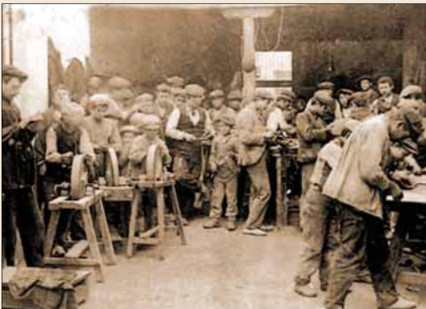
Interior de una fábrica de navajas a principios del siglo XX.

El aprendiz se obligaba a vivir y servir en casa del maestro cuchillero , no podía irse de su casa y servicio. De no cumplir el trato , el padre se comprometía a hacerle volver, y a que el aprendiz perdiera lo servido y pagase los daños y prejuicios ocasionados.