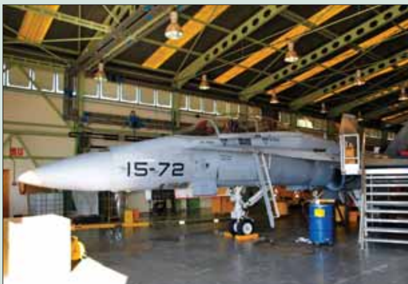
En la Maestranza se desarrollan políticas de calidad, y lógicamente al nivel más alto en todo lo que se refiere al mantenimiento sobre Sistemas de Armas.

La Maestranza Aérea de Albacete cuenta también con un Escuadrón de Apoyo , encargado de mantener todas las instalaciones a punto para su funcionamiento, como albañiles, electricistas, fontaneros etc.