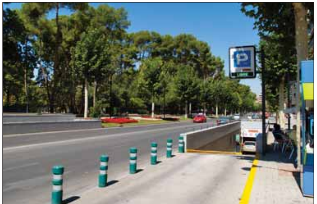
Aparcamiento recién construido en la Avenida de España. →

como concejal y portavoz del Grupo Municipal Socialista, se renovaron todos los autobuses de Albacete pero "del año 1992 al 2006 han pasado 14