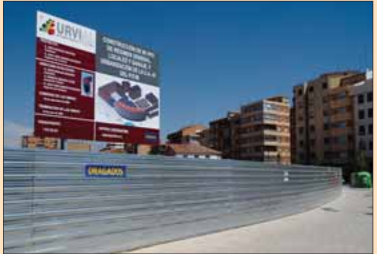
Solar en la calle del Rosario esquina al paseo de la Circunvalación donde se construirán 98 viviendas de protección oficial.