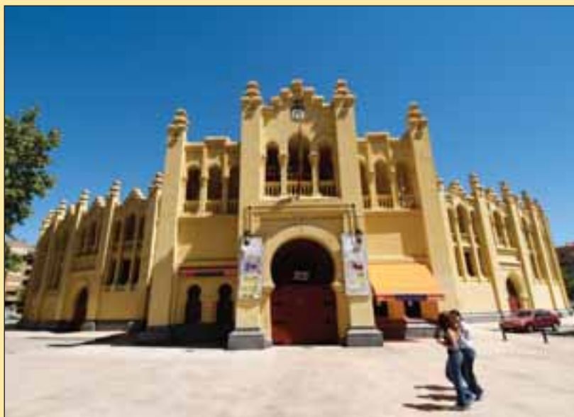
Vista de la actual Plaza de Toros de Albacete.