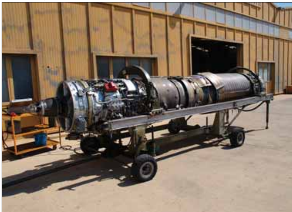
Motor de un Mirage F-1 en fase de mantenimiento y comprobación.

La Base Aérea de Los Llanos de Albacete es como una “pequeña ciudad” en la que trabajan más de 1.000 personas (73 oficiales, 468 suboficiales, unos 132 trabajadores en personal laboral civil y 427 de personal de tropa). El personal de tropa es un poco va-