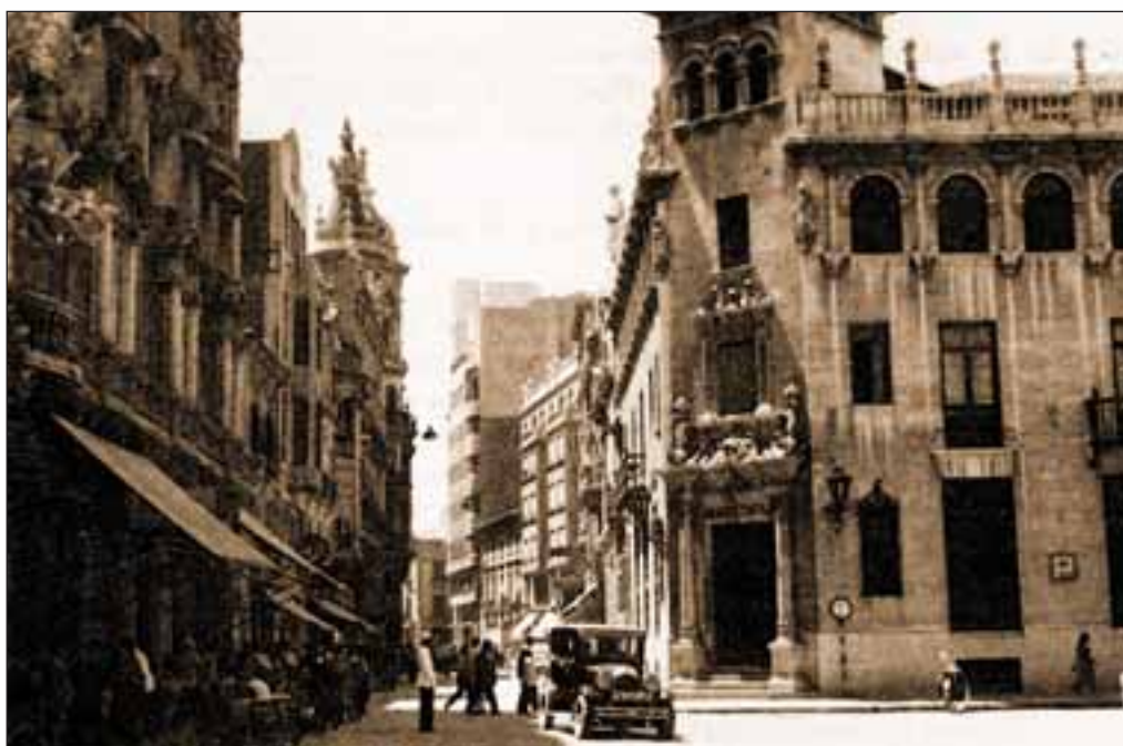
A la derecha de esta fotografía, se puede contemplar el antiguo edificio del Banco Central, situado en la actual plaza del Altozano. Primera mitad del siglo XX.

Albacete asiste en la actualidad a una expansión económica y social sin precedentes,