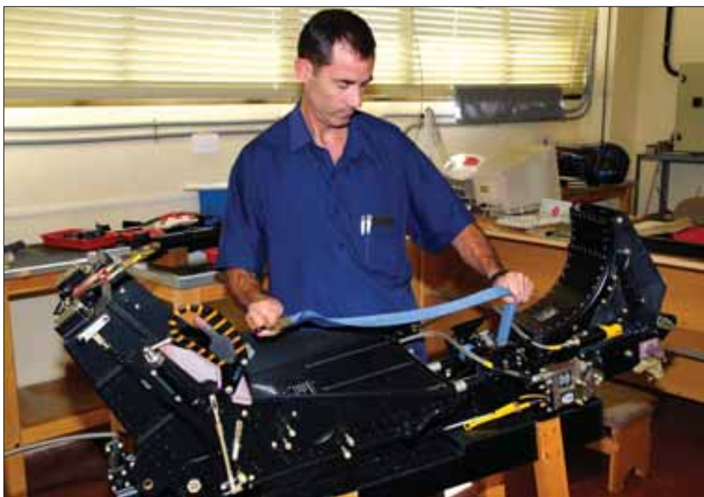
En la Maestranza de Albacete se encuentra el único taller de asientos lanzables de tercer escalón.

ra unidad del Ejército del Aire en la que, mediante proyección de Plasma-Spray, ha sido capaz de proyectar un revestimiento cerámico para proteger las cámaras de combustión y las piezas de motor de altas temperaturas. Cuenta, además, con una Cámara Anecoica para comprobar el radome del avión.