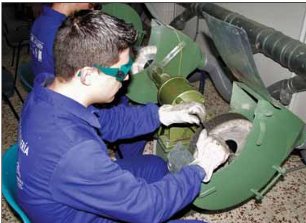
Alumnos de la Escuela de Cuchillería “Amós Núñez”.

Actualmente, la producción del sector se concentra en fábricas, casi todas ellas en el Polígono Industrial de Campollano.