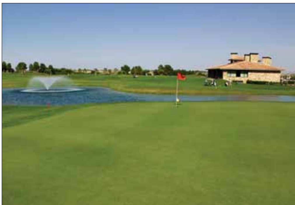
El club goza de unas magníficas instalaciones, entre las que se encuentra la Casa Club.

Por desgracia, continúa el Gerente, el golf no es un deporte autodidacta, por lo que hay que tomar algunas clases,