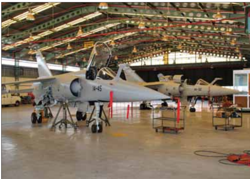
Dos Mirage F-1, con equipo de abastecimiento en vuelo, en fase de mantenimiento en la Base de Albacete.

nos relacionemos aunque en una Base como la de Los Llanos todo el mundo se relaciona con lo que es la ciudad de Albacete mientras que en otras bases, más apartadas o que están en ciudades grandes, la relación suele ser menos cercana”, concluye Orlando Fernández, coronel de la Base Aérea de Los Llanos y jefe del Ala 14. La Cerca