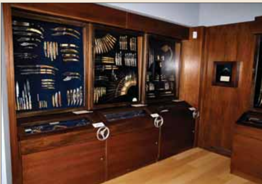
Las colecciones de Caja Castilla-La Mancha y de APRECU están expuestas de manera permanente en el Museo de la Cuchillería.

Además, el Museo cede temporalmente sus colecciones, que ya han visitado lugares como Cerdeña y Brasil , con lo que no sólo se promociona el sector de la cuchillería sino también la ciudad.