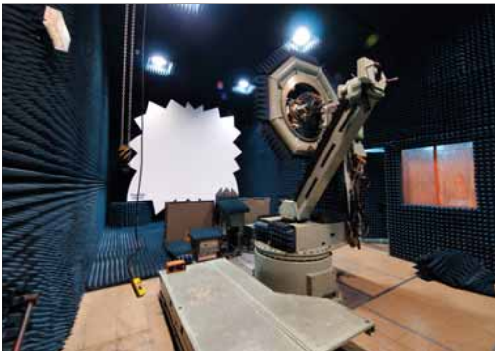
La Maestranza de Albacete cuenta con una Cámara Anecoica para comprobar el radome del avión.