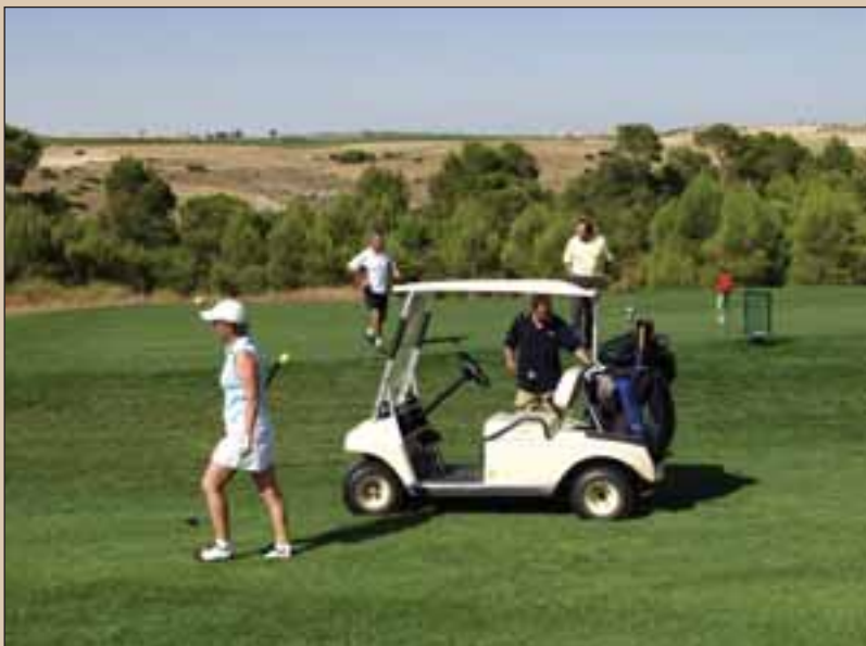
Cada día son más los aficionados al deporte del golf.

En definitiva, se trata de un deporte sano que permite realizar ejercicio físico de forma amena y muy entretenida.