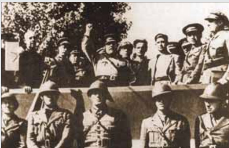
Discurso en la parada militar celebrada en el parque de Albacete en octubre de 1937.

En cuanto a la evolución política , Albacete va a seguir un curso similar al del conjunto de la Nación . Durante el largo período de la Restauración (1875-1923) se manifiestan los síntomas del caciquismo en la vida social y política de Albacete . Durante la Guerra Civil , tras un breve lapso en poder de los militares sublevados contra el gobierno republicano , la ciudad volvió a quedar en manos de las autoridades de Madrid . Durante la mayor parte de la Guerra , la Base Aérea de los Llanos fue la sede principal de la fuerza aérea republicana . Entre los años 1936 y 1937, Albacete se convirtió en cuartel general de las Brigadas Internacionales , en cuyo recuerdo se erigió un monumento al cumplirse los 60 años de aquellos hechos. Ya en la transición democrática , los dos datos más significativos son la implantación en Albacete del Tribunal Superior de Justicia de Castilla-La Mancha , en función del Estado de Autonomía de 1982 , y la consolidación de la Universidad de Castilla-La Mancha , que está suponiendo un gran impulso para el crecimiento de la Ciudad y la Región en general.