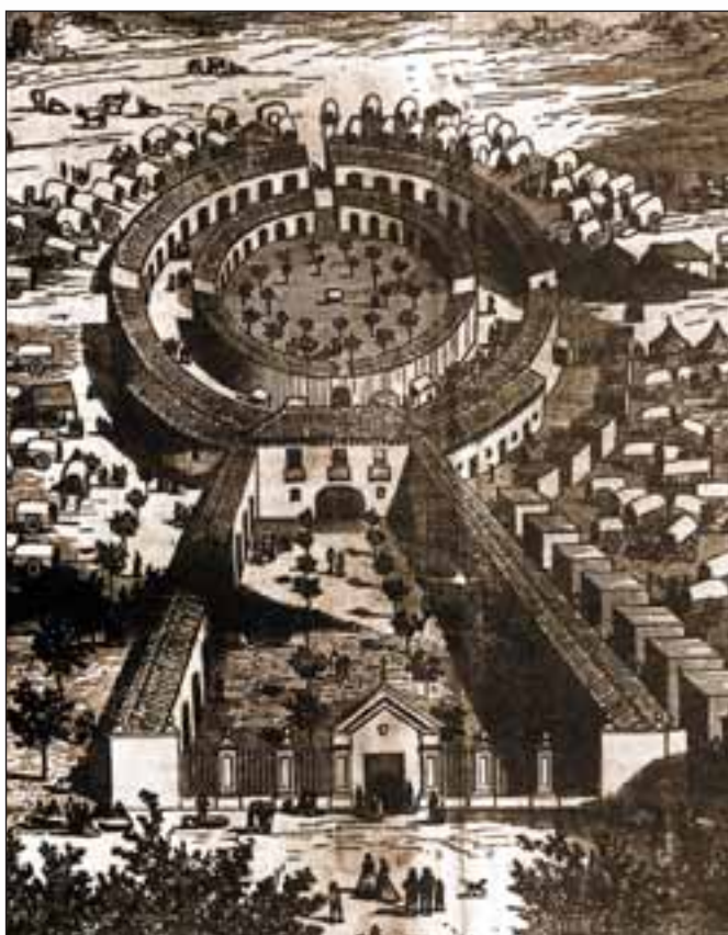
Dibujo del Recinto Ferial del siglo XIX.

Esta Feria, que empezó celebrándose en el propio casco de Albacete, se trasladaría en el siglo XVII al paraje de Los Llanos, donde se había iniciado el culto popular a la Patrona, y donde, posteriormente, en torno al año 1672, se fundaría un convento de Franciscanos, adosado a la ermita de la Virgen de Los Llanos. La antigua Feria de los días de San Andrés o de San Agustín,