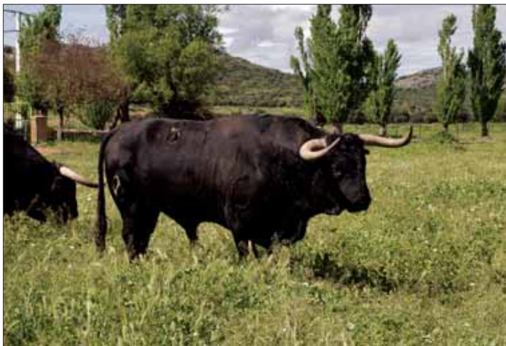
Al aficionado albaceteño le gustan los toros fuertes y con cara grande.