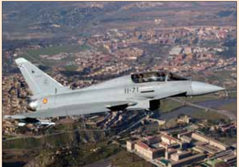
El Eurofighter 2000 será uno de los aviones que albergará la Base albaceteña.

Además, el Eurofighter tendrá más potencia , más alcance , pero ante todo tendrá más capacidad aviónica , es decir, todo lo que se refiere a gestión de armamento , navegación , guerra electrónica , etc.