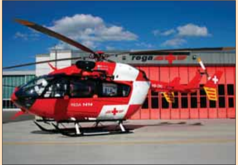
Está previsto que en 2007 salga el primer helicóptero fabricado en la factoría de Albacete.

En cuanto a la situación del empleo en la actualidad, "podemos decir que tenemos un 5% de paro en hombres, que es un porcentaje de paro estructural que se da en todas partes y que normalmente se define como desempleo técnico porque siempre hay un porcentaje de población que está en busca de empleo", estima el Alcalde , reconociendo que es más preocupante el paro femenino , tres veces mayor, de modo que lo que está haciendo el ayuntamiento de Albacete para mediar por el empleo de este sector de la población es, principalmente, organizar cursos de formación , seguimiento y preparación para las empresas exclusivamente destinados a mujeres .