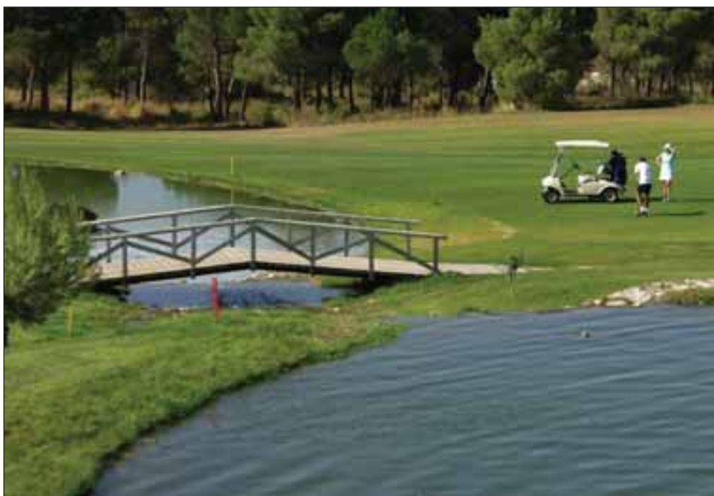
Todos los detalles han sido cuidados en el club de golf "Las Pinailas".

Sin embargo, esta ley y otras posteriores fueron ignoradas por los escoceses, lo que obligó al rey Jacobo IV a admitir el juego del golf a princi-