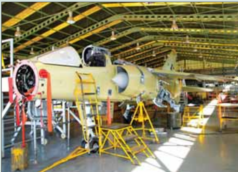
Todos los equipos como el tren de aterrizaje, bombas hidráulicas, radar... son desmontados y, revisados en los diferentes talleres, se reparan y vuelven a montarse.

El coronel Carlos Caballero distingue que las misiones de los ejércitos españoles ahora mismo están enfocadas en dos vertientes: la cooperación internacional y la participación en todas las misiones que decida el Parlamento (ayuda humanitaria, entre otras) y, en la parte nacional, la cooperación con las autoridades civiles en temas de inundaciones , incendios o cualquier tipo de cooperación que se solicite. Dentro de este papel de las Fuerzas Armadas en general, continúa el Coronel , “el Ejército del Aire lo que requiere es tener la mayor operatividad posible y el mayor número de aviones disponibles, de forma que pueda cumplir con las misiones que se le encomiende”, señala, para destacar que “la importancia de la Maestranza es, precisamente, realizar las soluciones de mantenimiento y de abastecimiento para que el Ejército del Aire pueda disponer del mayor número de aeronaves posibles y posea la mayor operatividad posible”.