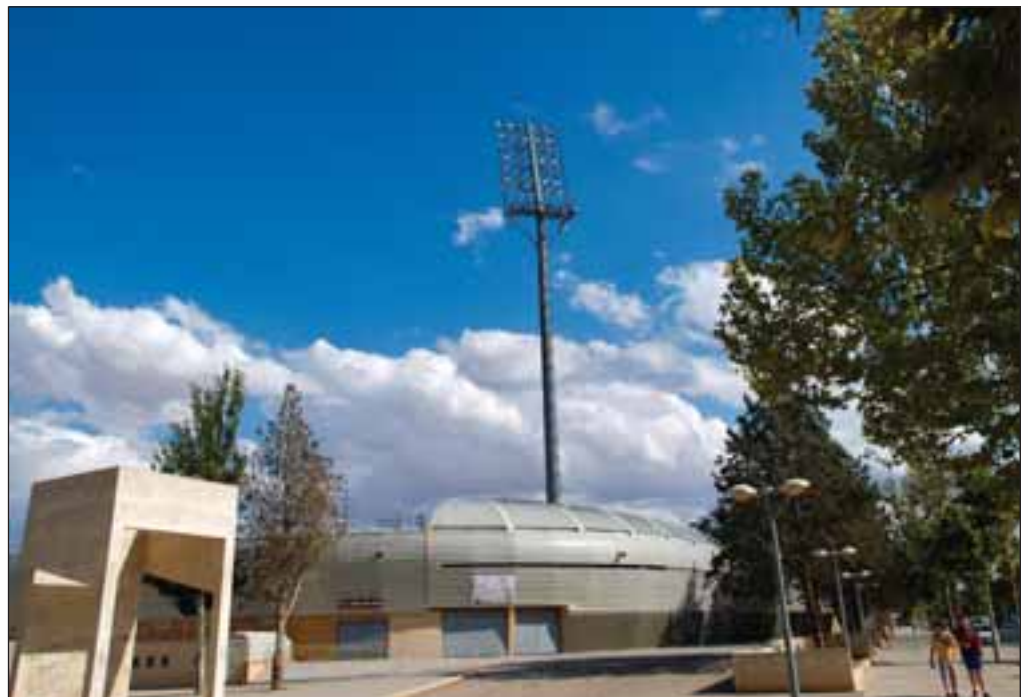
Estadio Carlos Belmonte, campo de juego del Albacete Balompié.

En los inicios de la temporada 2006-2007, el entrenador del Albacete Balompié manifiesta sentirse mucho más satisfecho con el equipo de este año que con el del año pasado, sobre todo porque "veo gente muy implicada en