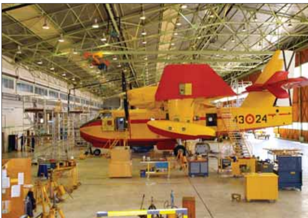
Un avión Canadair en fase de mantenimiento en las instalaciones de la Maestranza.

Además, en la Unidad Militar de Emergencia (UME) están adquiriéndose más aviones apaga fuegos, los CL-415, un modelo superior al actual, y "posiblemente también se derive a la Maestranza de Albacete su mantenimiento", prevé el Coronel.