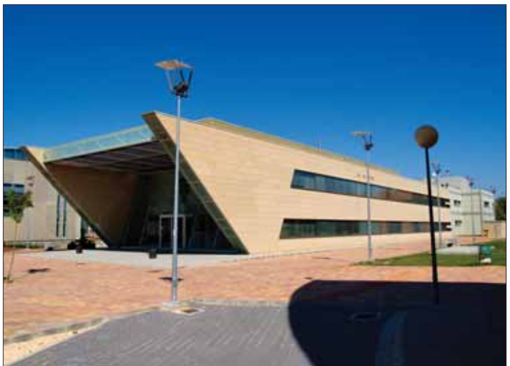
Instituto de Investigación en Informática, situado en el Parque Científico y Tecnológico de Albacete.

Albacete ha consolidado proyectos importantes como es el polígono industrial de Campollano, está desarrollando aceleradamente el polígono industrial Romica y ha conseguido tener el centro aeronáutico más importante de Europa en helicópteros que es Eurocopter; “acompañando a todo esto, está el Parque Científico y Tecnológico, muy unido a la Universidad, de modo que la ciudad de Albacete está en este momento