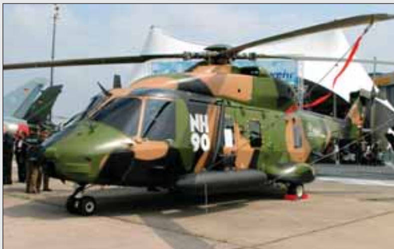
Eurocopter generará en la ciudad cientos de puestos de trabajo.

EADS es un líder global de la industria aeroespacial , de defensa y servicios relacionados . EADS incluye al fabricante de aviones Airbus , a Eurocopter , el mayor proveedor de helicópteros del mundo, y a la empresa conjunta MBDA (en la que participa con un 37,5%), segundo mayor productor de misiles del mercado. EADS es el socio mayoritario del consorcio Eurofighter , es el contratista principal del lanzador Ariane , desarrolla el avión de transporte militar A400M y es el socio industrial mayoritario para el sistema europeo de navegación por satélite Galileo . Eurocopter fabricará en Albacete los helicópteros Tigre , NH-90 y EC-135 , sin descartar otros modelos que puedan surgir a lo largo de su vida empresarial. Esta decisión forma parte del Plan de Modernización del Ministerio de Defensa a fin de dotar a nuestras Fuerzas Armadas de equipos que se adapten a las necesidades que requiere el recién comenzado siglo XXI .