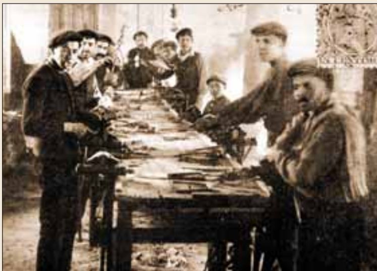
Montadores de navajas a principios del siglo XX.

Un documento de 1908 nos muestra el proceso de transformación que se estaba produciendo en el sector cuchillero de la ya ciudad. En las fábricas se abandonó la producción artesana que abrió paso a la plenamente industrial. En 1925 funcionaban 12 fábricas de navajas y cuchillos, además de numerosos talleres pequeños y familiares. Cerca de 400 operarios producían anualmente más de 30.000 docenas de navajas. La bonanza de la que gozó esta época estuvo favorecida por la II Guerra Mundial. El aislamiento de los años 50 generó una crisis sobre la que incidió, nuevamente, la adversa legislación, ya que en 1945 se publicaba una ley, que prácticamente ha llegado a nuestros días, prohibiendo las navajas cuyas hojas puntiagudas excedieran de once centímetros.