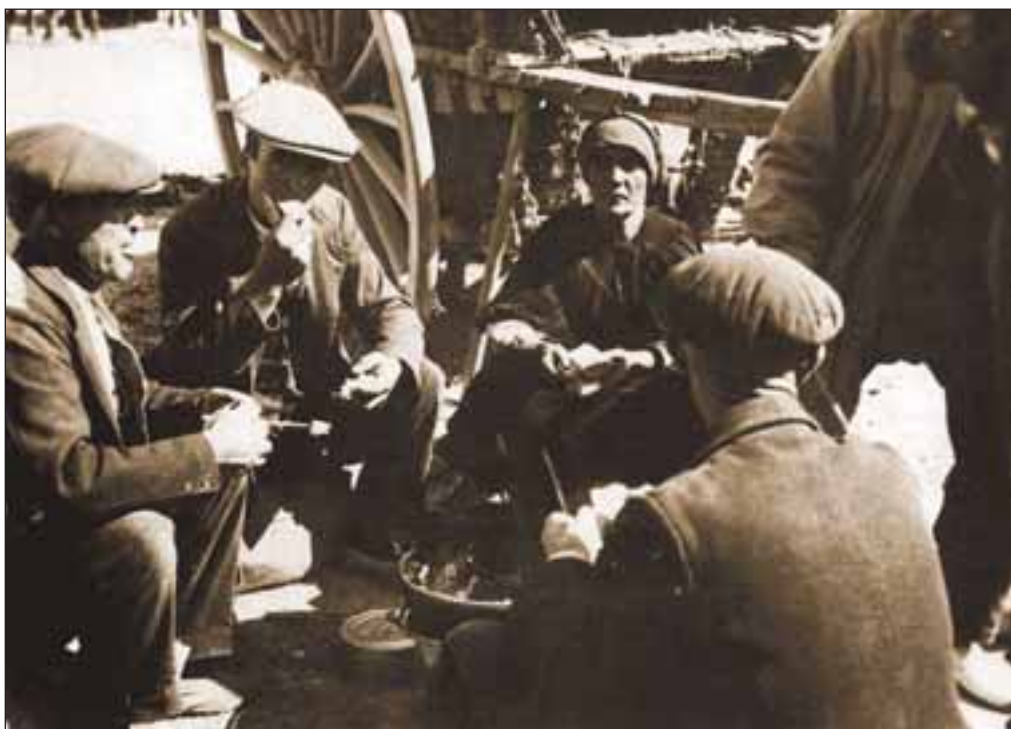
Una familia acampa en “La Cuerda” de la Feria en los primeros años del siglo XX.

La mecanización del campo dio al traste con aquel mercado ferial de ganado y con ese ir y venir de caballerías que constituían el objetivo fundamental para el que se