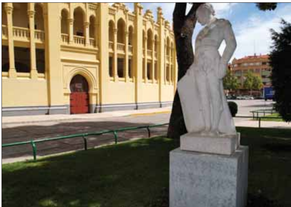
Una escultura del gran Chicuelo preside los alrededores de la Plaza de Toros de Albacete.

Algo que se ha tenido muy en cuenta al confeccionar los carteles ha sido la inclusión de novilleros locales, según exige el Pliego de Condiciones. “En esto el Ayuntamiento es muy exigente, ya que, junto con la Diputación, realiza un gran esfuerzo en formar toreros locales a través de la Escuela Taurina”, afirma Rafael, quien a este respecto explica que