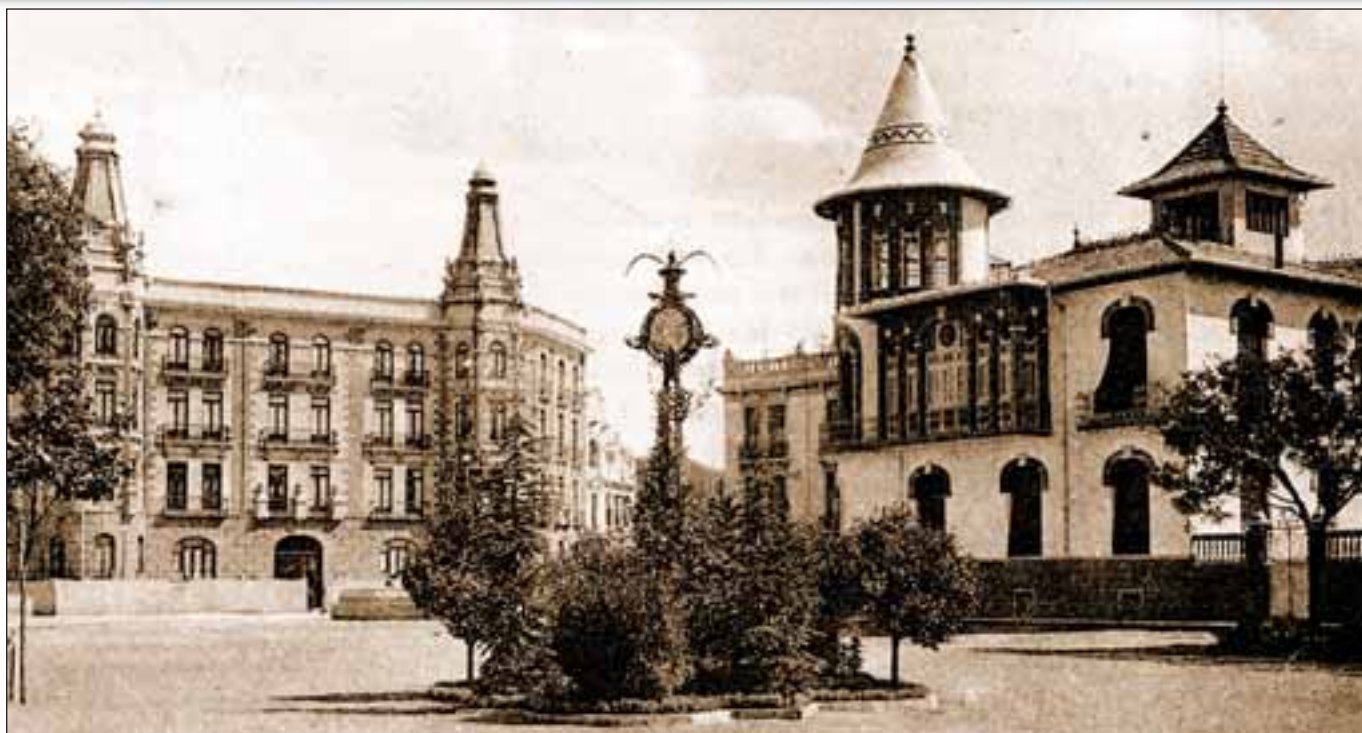
Antigua plaza de Gabriel Lodares de principios del siglo XX.