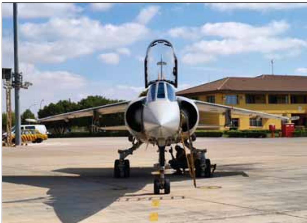
Uno de los Mirage F-1 ubicados en la Base Aérea de Los Llanos de Albacete.

de 1980, se creó el escuadrón 142 (llamados entre ellos coloquialmente "Tigres"), cuya misión es la interceptación con tiempo despejado (ITD) y de cazabombardero (CBA), además de encargarse de la conversión al F-1 y del adiestramiento de los pilotos destinados a este avión.