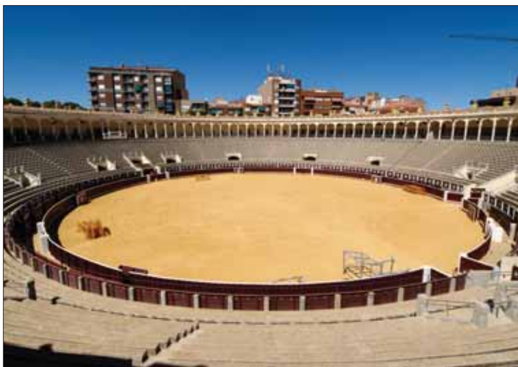
Coso de la Plaza Taurina de Albacete.