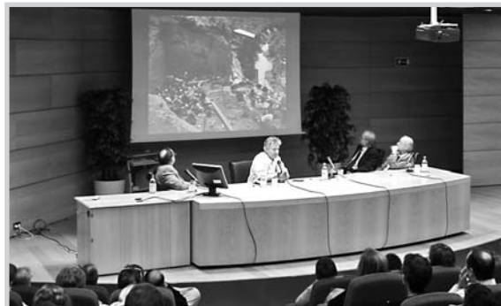
Un momento de la conferencia.

La Obra Social y Cultural de Caja Castilla La Mancha, Ccm, realizará hasta el 25 de mayo un recorrido por la historia de España a través del ciclo de conferencias Hispania, que abordará desde Atapuerca hasta la Edad Contemporánea, de la mano de siete catedráticos de universidades españolas.