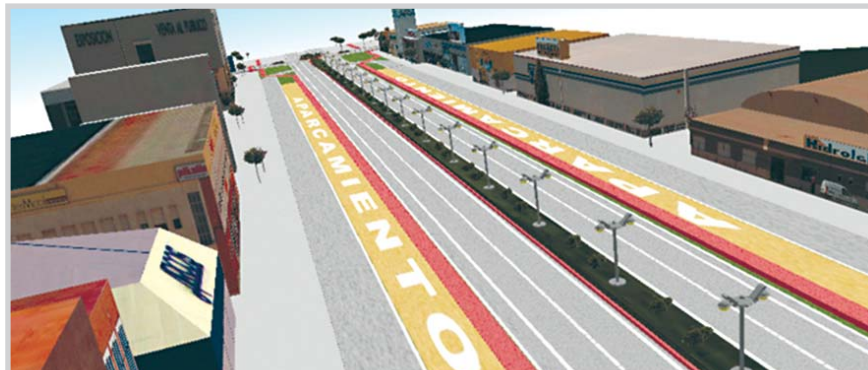
Vista virtual de la Avda. Gregorio Arcos.

Las obras, por un importe de 3.085.000 euros, estarán finalizadas antes de que acabe el año