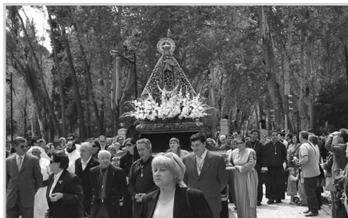
La Virgen de Los Llanos participó en El Encuentro y obtuvo los mayores aplausos.

La Junta de Cofradías -que este año rendía homenaje a la Virgen de Los Llanos por el 50 aniversario de su coronación- hizo una valoración positiva de la Semana Santa, en la que varias cofradías celebraron procesiones a centros benéficos en Sábado Santo.