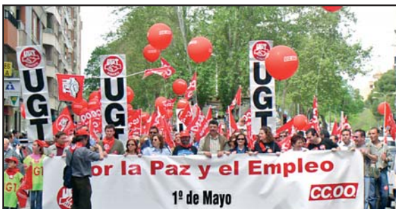
Volverán a mezclarse las banderas.

La convocatoria partirá del Recinto Ferial hasta el parque Abelardo Sánchez a partir de las doce de la mañana y será cerrada por las intervenciones de los secretarios provinciales y regionales de ambas centrales sindicales. Exposiciones, concursos y cine completan los actos organizados para conmemorar el Día Internacional del Trabajo. (Pág. 16 y 20)