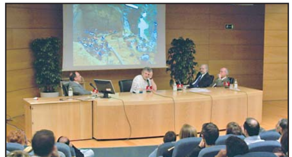
Juan Luis Arsuaga, durante la conferencia sobre Atapuerca.