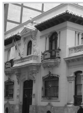
Cámara de Comercio.