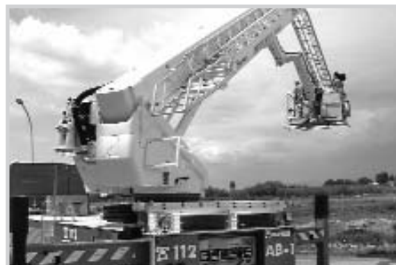
El vehículo permite el acceso a los edificios más altos de Hellín.

El brazo se maneja por medio de dos ordenadores que avisan al operador de las condiciones de estabilidad y resistencia mecánica de la unidad y paralizan la maniobra en caso de riesgo. Otras de las ventajas es que puede elevarse casi en vertical, hasta 86 grados, lo que facilita su utilización en calles estrechas o cuando hay obstáculos próximos.