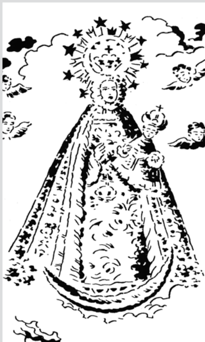
Un cómic para la Virgen.

Medio siglo después, a punto de conmemorarse el cincuenta aniversario de la Coronación de la Virgen, estoy trabajando en un cómic para regalárselo a la gran Señora en día tan entrañable. Y en el Parque de Abelardo Sánchez, en el mencionado 56, conocido por el Parque de los Mártires, se lo mostraré entre la avalancha de nativos y forasteros y le rezaré plegarias y le lanzaré mil besos a la regia Emperatriz, a María de Los Llanos.