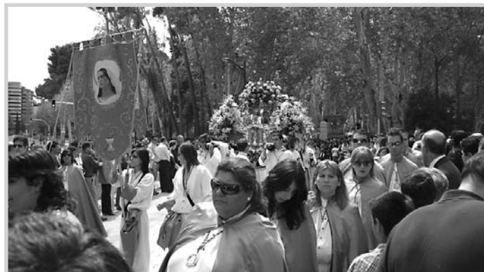
Aunque se cayó la Magdalena, el paso siguió en procesión.

La Virgen de Los Llanos tuvo un protagonismo especial en la procesión de El Encuentro