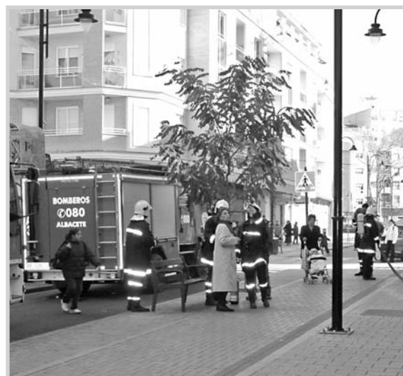
La labor de prevención evita la de extinción.

zada durante los próximos ejercicios, ya que las nuevas instalaciones permitirán potenciar los cursos para centros escolares, colectivos y em-