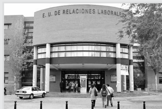
Facultad de Económicas.

Por segundo año consecutivo, la Facultad de Ciencias Económicas y Empresariales celebra hasta el 11 de mayo el ciclo “La Economía en el Cine”. Con la colaboración de la Filmoteca de Albacete, las jornadas incluyen la proyección de seis largometrajes que abordan distintos problemas de carácter socioeconómico.