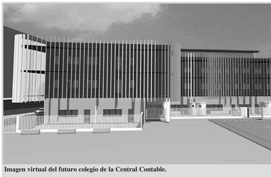
Imagen virtual del futuro colegio de la Central Contable.

Asimismo, el consejero también visitó las obras del nuevo colegio del Barrio Cañicas, que concluirán el próximo verano. El centro, que contará con nueve unidades de Infantil y 18 de Primaria, supone una inversión de 4.924.428 euros y estará operativo el próximo curso 2006-2007.