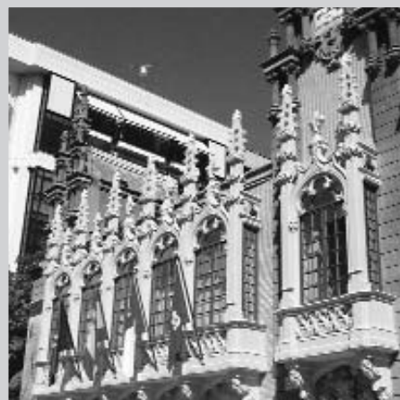
Museo de la Cuchillería.