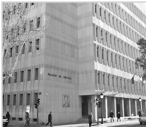
Palacios de Justicia.

aprovechó para anunciar que se retirará del Tsj-Cm en mayo, por su jubilación, después de 17 años en el cargo.