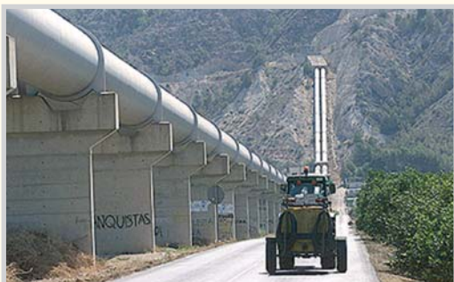
Canalización de trasvase.

En Murcia ya se han despachado con la próxima petición de agua. Ahora quieren 112 hectómetros cúbicos para riegos. Se supone que con la coletilla de riegos de socorro, lo que siempre llama mucho la atención. Que el sureste está en situación de sequía es conocido y que todos deben ajustarse a una situación de precariedad; así, los regantes de Castilla-La Mancha y de Levante verán reducidas sus aportaciones al cincuenta por ciento de los volúmenes de su cupo. Con esa situación, de dónde creen en Murcia que se pueden sacar 112 hectómetros cúbicos más. Su peor imagen es la falta de mesura para pedir lo que otros no tienen.