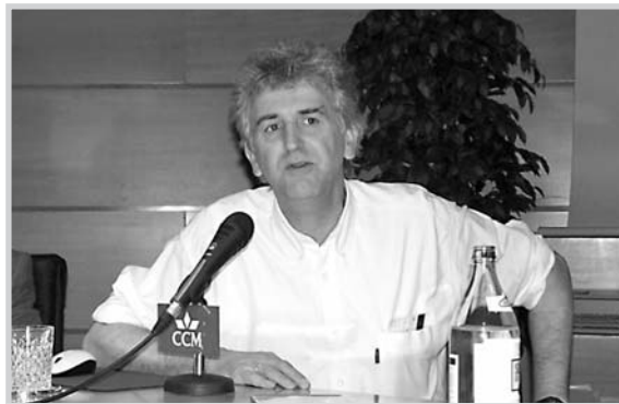
Juan Luis Arsuaga.

Las conferencias se desarrollarán a las 20.00 horas en el marco del Centro Cultural que Caja Castilla La Mancha tiene en la calle San José de Calasanz. La entrada es libre, hasta completar aforo.