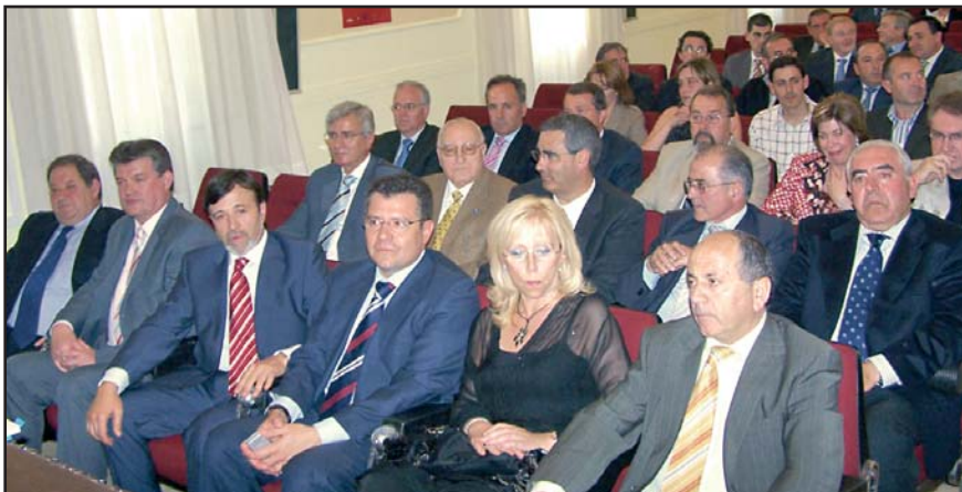
En primera fila, seis de los miembros del Comité Ejecutivo.