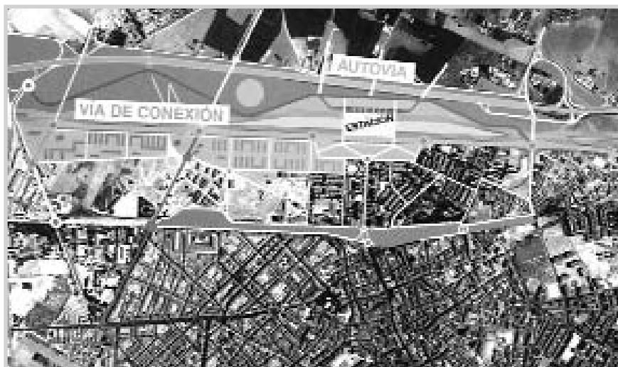
Plano de la futura estación del Ave en Albacete.

Explicó que la fecha inicial prevista era 2007, pero que ha habido retrasos por diferentes problemas técnicos, como el registrado en la bifurcación del punto de La Encina y también falta por solucionar el problema de Almansa para que el proyecto continúe adelante.