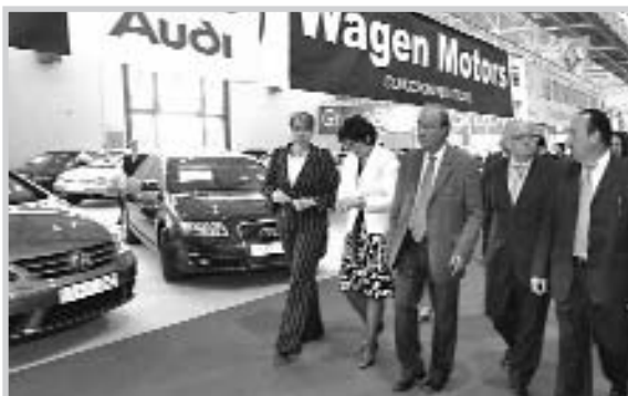
Un momento de la visita a los expositores.

A lo largo de los 8.700 metros cuadrados habilitados para exposición, los espectadores han podido encontrar automóviles "con