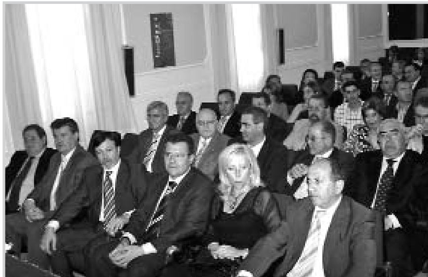
Nuevo Comité Ejecutivo de la Cámara Oficial de Comercio e Industria de Albacete.

Posteriormente, tuvo lugar la elección del comi-