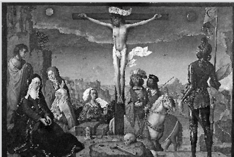
La Crucifixión, de Juan de Flandes.