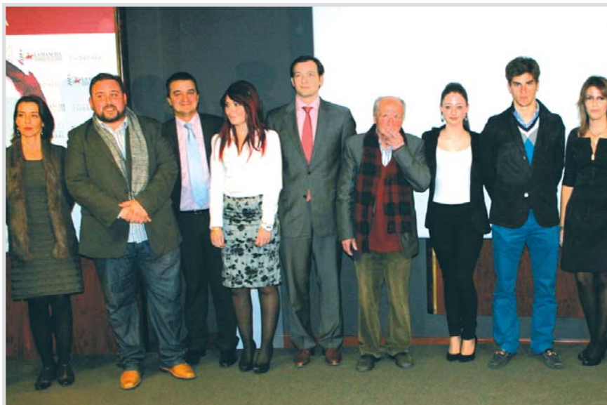
Autoridades y premiados de la DO La Mancha.

El acto contó con la asistencia de los directores generales de Producción Agropecuaria y de Desa-