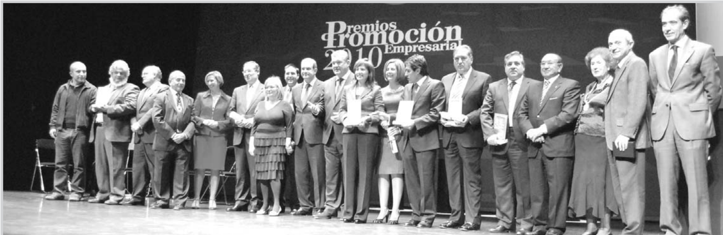
Autoridades, patrocinadores y premiados.