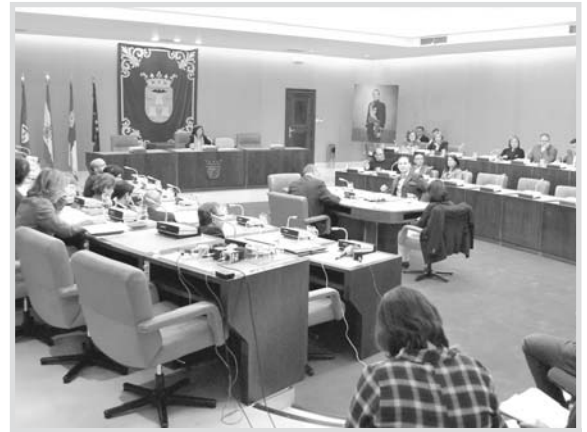
Imagen del Pleno del Ayuntamiento de Albacete.