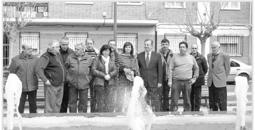
El consejero, la alcaldesa y el presidente de la FAVA, en el barrio Pedro Lamata, con los vecinos.