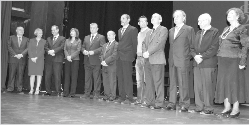
Autoridades y premiados con la Medalla de Plata.