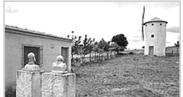
Molino de la Bella Quiteria.