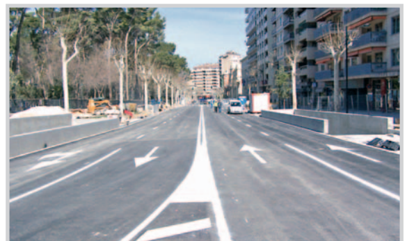
El antes y el después de las obras de la Avda. de España.