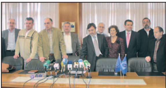
Todos los empresarios que presentaron la candidatura de Feda resultaron elegidos.

La candidatura de la Confederación de Empresarios de Albacete, Feda, ha obtenido 35 de las 37