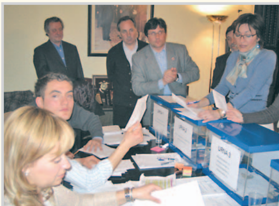
Un momento del escrutinio.