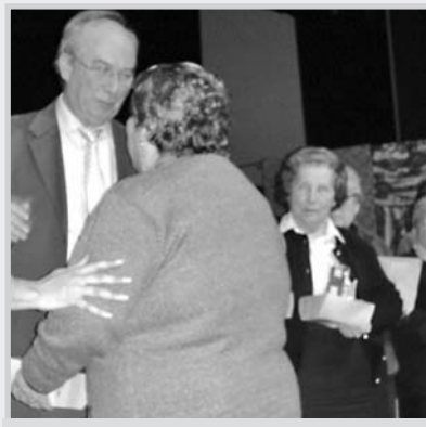
Reconocimiento a mayores de la ciudad.