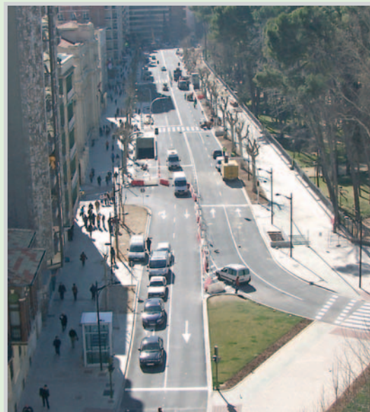
Primeros vehículos sobre el flamante asfalto.