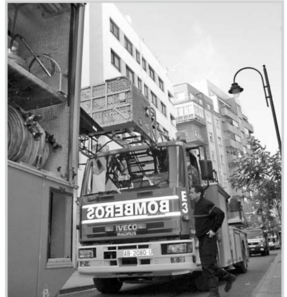
Los bomberos en una de sus salidas.

La iniciativa, que ha sido tomada como ejemplo en otros parques de bomberos, pretende alcanzar la catalogación de medio millar de edificios en los próximos cinco años, incluyendo colegios, hospitales, edificios públicos o viviendas de más de ocho alturas, que son las que más riesgo tienen.