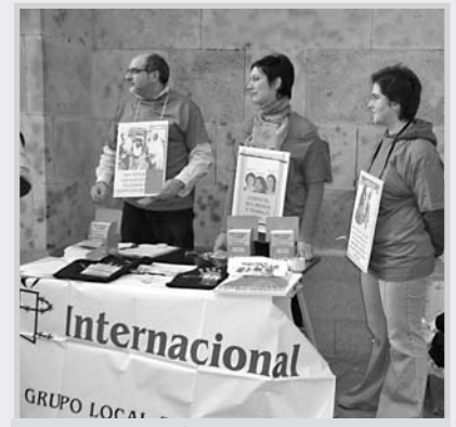
Mesa de Amnistía Internacional.