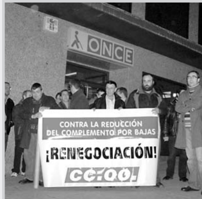
Momento de la concentración ante la sede de la Once.

Delegados sindicales de CC.OO. volvieron a protestar en una nueva concentración ante las puertas de la sede de la Once en Albacete por la supresión del complemento por bajas que los empleados llevaban percibiendo desde 1984 y que fue eliminado tras la firma del convenio colectivo en julio del año pasado. Según la central sindical, esta "importante agresión económica" puede suponer pérdidas de más de 200 euros mensuales durante las bajas temporales por enfermedad, dependiendo de las categorías profesionales, por lo que piden la renegociación del suplemento.