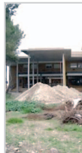
Obras en Las Tiesas.

aportar el equipo directivo. Por su parte, tanto la oposición del Grupo Popular como las centrales sindicales de CC.OO. Ugt y Csi-Csif criticaron el convenio.