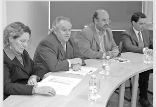
Un momento de la presentación del curso.

Medio centenar de titulados y profesionales participarán hasta finales de junio en el IV Curso de Gestión de Bodegas y Comercialización del Vino, impartido por la Universidad de Castilla-La Mancha en la Escuela Técnica Superior de Ingenieros Agrónomos de Albacete, con el fin de formar profesionales capaces de acometer la gestión comercial de bodegas y empresas vitivinícolas.