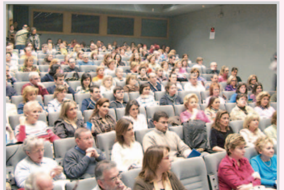
La asistencia de Mercedes Milá llenó el salón de actos.