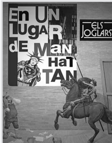
Els Joglars, “En un lugar de Manhattan”

- Desde el 27 de marzo al uno de mayo, se podrá escuchar el Festival de Flamenco Ahora, que contará con la participación del Ballet de Víctor Ullate, José Mercé, Carmen Linares y Diana Navarro. Lugar: Teatro Circo.