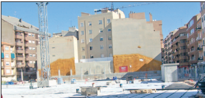
Aspecto actual del aparcamiento de la Central Contable, terminado a ras de calle.

los solares de las Cocheras de Aviación. El concejal del área, Roberto Tejada, señaló que el proyecto del colegio contempla un presupuesto de 4.100.000 euros. (Pág. 2)