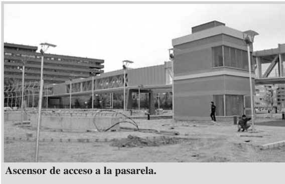
Ascensor de acceso a la pasarela.

Otro de los puntos que destacó es el Plan de Seguridad Integral del Campus, que contempla la instalación de un nuevo sistema de acceso a todos los edificios y la ubicación en ellos de cámaras de vigilancia.