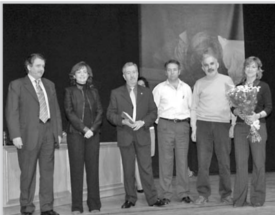
El Grupo Sam de la Policía Nacional.

el Día de la Mujer una mesa informativa para protestar contra las leyes discriminatorias vigentes todavía en 36 países. Un recital poético en la biblioteca de los Depósitos del Sol y la IV Muestra de Cine-Mujer, que se desarrolla a lo largo de todo el mes, completan la oferta de actos. Asimismo, el hall del Ayuntamiento acoge hasta el 15 de marzo la muestra de pintura de mujeres mayores.