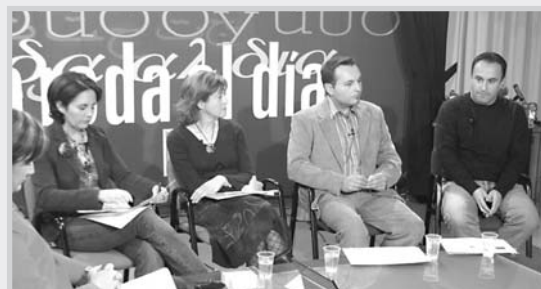
Presentación del proyecto Equal-Enlazadas en La Roda.

Equal-Enlazadas, que se prolongará hasta diciembre de 2007, buscará el intercambio y adopción de enfoques y estrategias innovadoras con un programa que incluye jornadas de sensibilización e información acerca de la importancia de la incorporación de la perspectiva de género de manera transversal en todos los ámbitos de la sociedad.