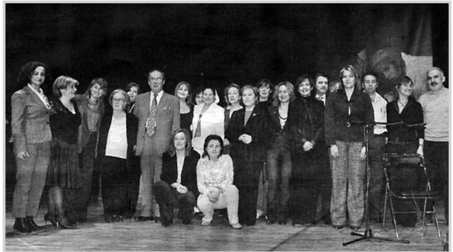
Foto de familia de las premiadas.