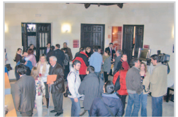
El vestíbulo de la Cámara fue un hervidero de candidatos, interventores y periodistas.