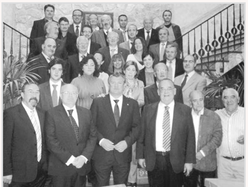
Pleno de la Cámara de Comercio e Industria.