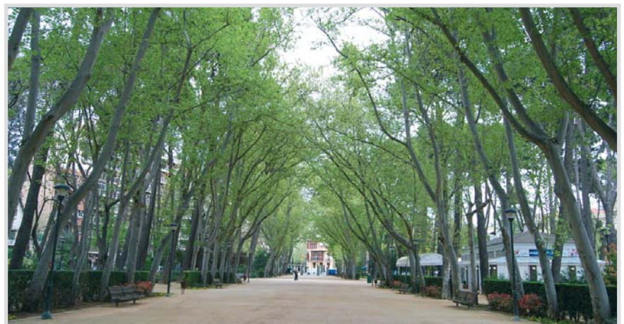
Imagen del paseo central del Parque Abelardo Sánchez.