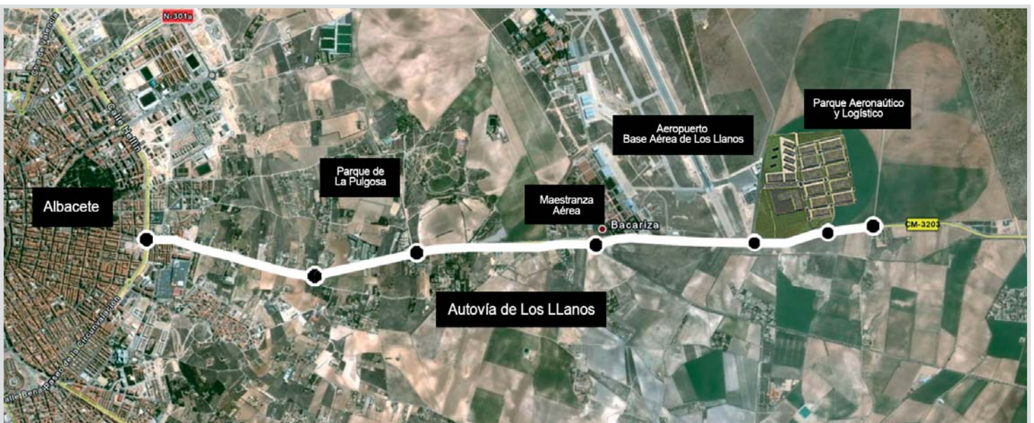
Trazado de la autovía de Los Llanos.

copter, ITH e INAER. Tiene una superficie total de 500.000 metros cuadrados, de los que 230.000 ya están ocupados.