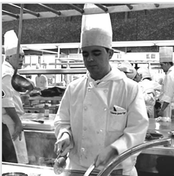
El paro se ha incrementado más en el sector servicios.