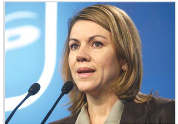
María Dolores Cospedal.