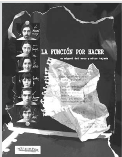
“La función por hacer”, en el Teatro Circo.