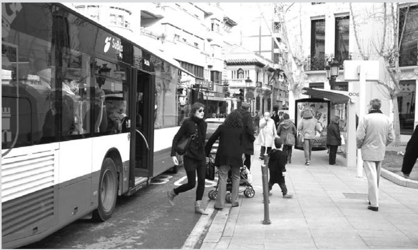
Aumenta el uso del transporte público en Albacete.