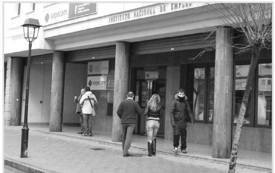
Oficina del Sepecam.

En el conjunto de España , el paro subió en