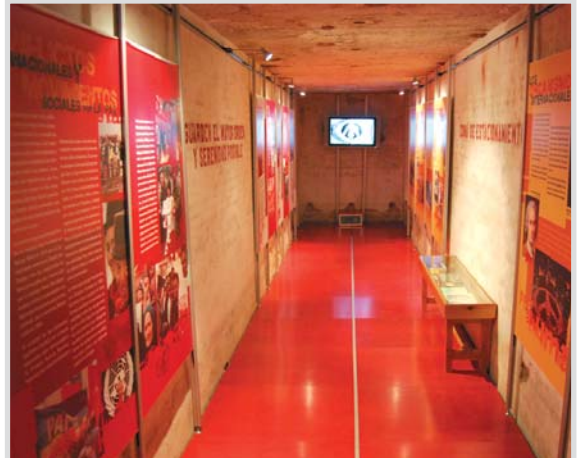
Interior del Centro de la Paz.

Al concurso se presentaron cerca de 100 trabajos, procedentes de España y del resto del mundo. Las obras seleccionadas se encuentran expuestas en el Centro de la Paz, en la plaza del Altozano.