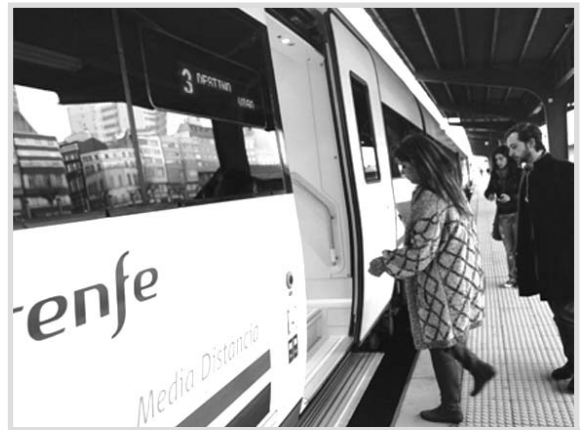
Algunos pasajeros subiendo al tren de Media Distancia.

cios de la línea Costa de La Mancha, Albacete conecta con Ciudad Real con un tren Arco, en ambos sentidos; y con un Regional Express, sentido Ciudad Real- Albacete. La conexión Albacete-