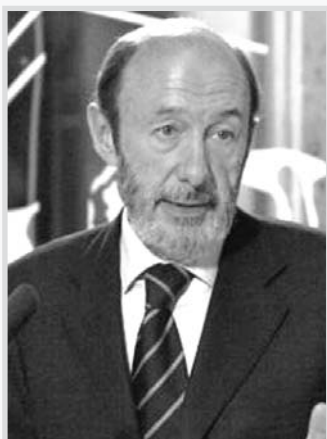
Alfredo Pérez Rubalcaba.

El Vicepresidente primero del Gobierno de Rodríguez Zapatero, Pérez Rubalcaba , en calidad de Ministro de Interior, presentaba el Presupuesto con que hemos de contar en 2011 para garantizar la seguridad ciudadana, 6.000