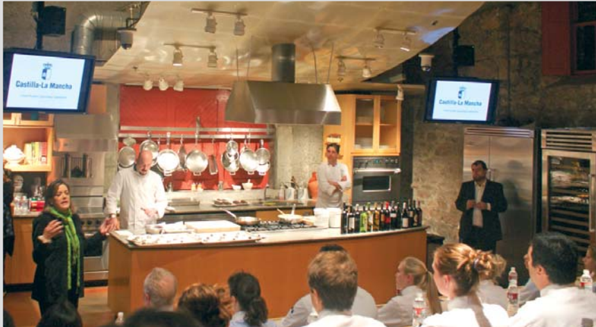
Un momento de la presentación.

Quince bodegas han participado en un encuentro en el que se han intercambiado experiencias con las bodegas del Valle del Napa y Sonoma, California