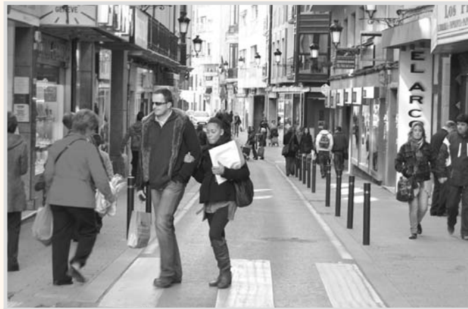
Calle del Rosario.

Hubo un intento chusco, hace unos 18 años, de convertir en peatonal un tramo de Tesifonte