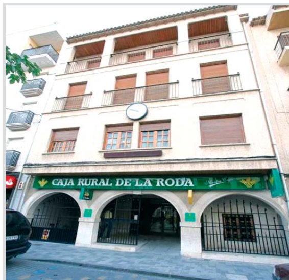
Caja Rural de La Roda.

Respecto al proceso de fusión de la entidad con Caja Rural de Ciudad Real y Caja Rural de Cuenca, sigue su desarrollo conforme al calendario previsto en el proyecto de integración presentado por las entidades en septiembre. La previsión es que, el uno de mayo de 2011, comience a operar la entidad resultante.