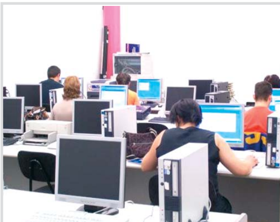
Aula de formación de Logic Computers.

Para el director de Logic Computers, las nuevas tecnologías no es que vayan más deprisa, sino que en España se es más lento. “Si queremos ser competitivos en un momento como éste de crisis, el que no invierta en nuevas tecnologías no tiene futuro”, destaca. Y recuerda cómo están presentes, en la vida diaria, aparatos tecnológicos sin los que ya no se podría hacer una rutina normal o desarrollar actividades profesionales.