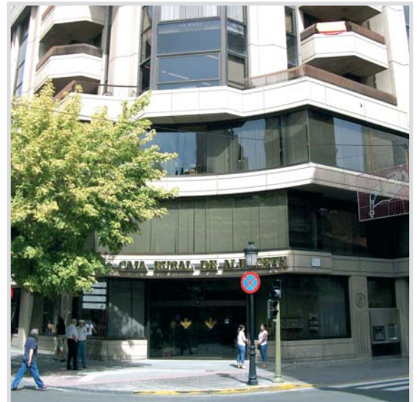
Caja Rural de Albacete.