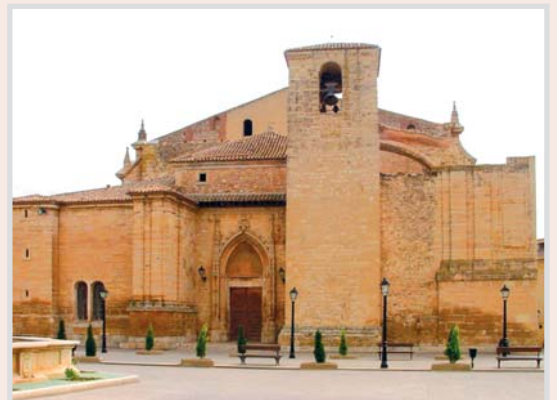
Parroquia San Blas, en Villarrobledo.

El momento de esta conferencia no puede ser más oportuno y necesario, porque a todos los niveles, los cristianos necesitamos estar mejor formados cada día y momento como estos son necesarios. Por lo tanto se agradece doblemente este esfuerzo.