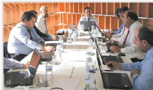
Reunión del Consejo Regional de Cámaras de Comercio.

nión, en la que participaron representantes de las cinco Cámaras de Comercio de Castilla-La Mancha, se pidió que no se olvide a la provincia de Ciudad Real para que, a través del Ave y de las autovías, se pueda conseguir “una total vertebración del territorio” y no se pierdan, así, oportunidades empresariales.