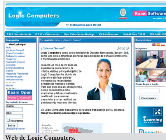
Web de Logic Computers.