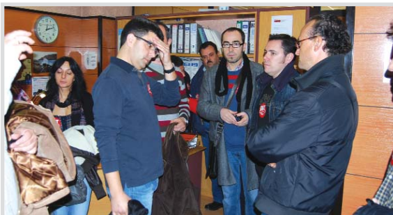
Un momento del encierro en la sede de la Patronal.