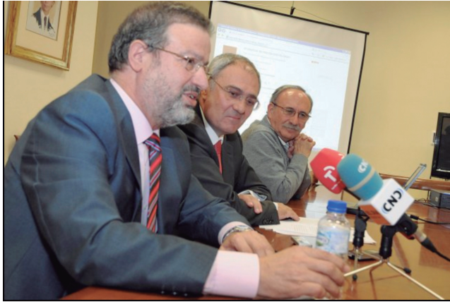
Acto de presentación de la Biblioteca Virtual de Castilla-La Mancha

Dicha Biblioteca está soportada por una aplicación informática, llamada