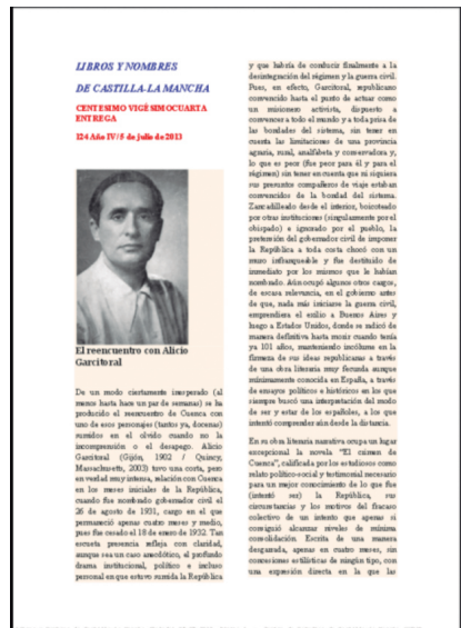
Libros y nombres de Castilla-La Mancha del 5 de julio de 2013