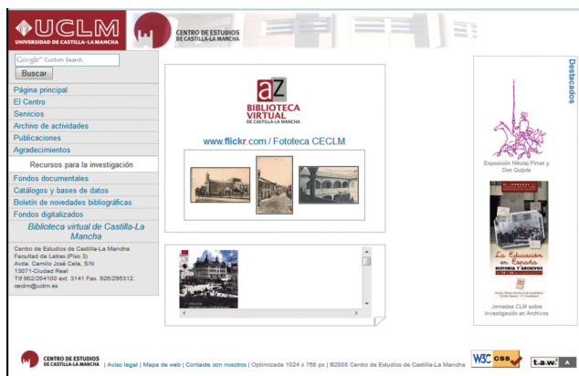
Página web del CECLM. www.uclm.es/ceclm

Paralelamente, el CECLM fue dotado de diferentes tipos de dispositivos para comenzar una labor constante de escaneo de materiales de nuestro propio fondo o procedentes de otras instituciones que comenzaron a formar un acervo digital accesible a través de la página del CECLM en Internet ( www.uclm.es/ceclm ) y enlazados también desde sus correspondientes registros bibliográficos en nuestro catálogo bibliográfico automatizado ( http://www.uclm.es/ceclm/catalogos.htm ).