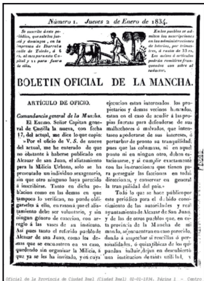
Boletín de La Mancha del 2 de enero de 1834.

Por otra parte, los indicados módulos fueron necesarios para concluir el proyecto Prensa digital de Valdepeñas (digitalización de publicaciones periódicas históricas en un proyecto entre el propio CECLM-UCLM, la Fundación General de la UCLM y el Ayuntamiento de Valdepeñas), de acuerdo con los requisitos a cumplir en la ayuda de 8.000 euros concedida por el Ministerio de Educación, Cultura y Deporte.