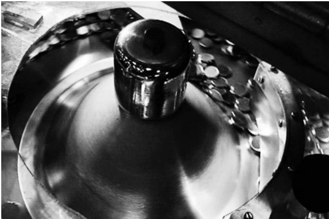
La coyuntura económica aumenta el atractivo de países hasta hace poco secundarios.

Saber cuáles serán en los próximos años supone un reto de especial trascendencia económica