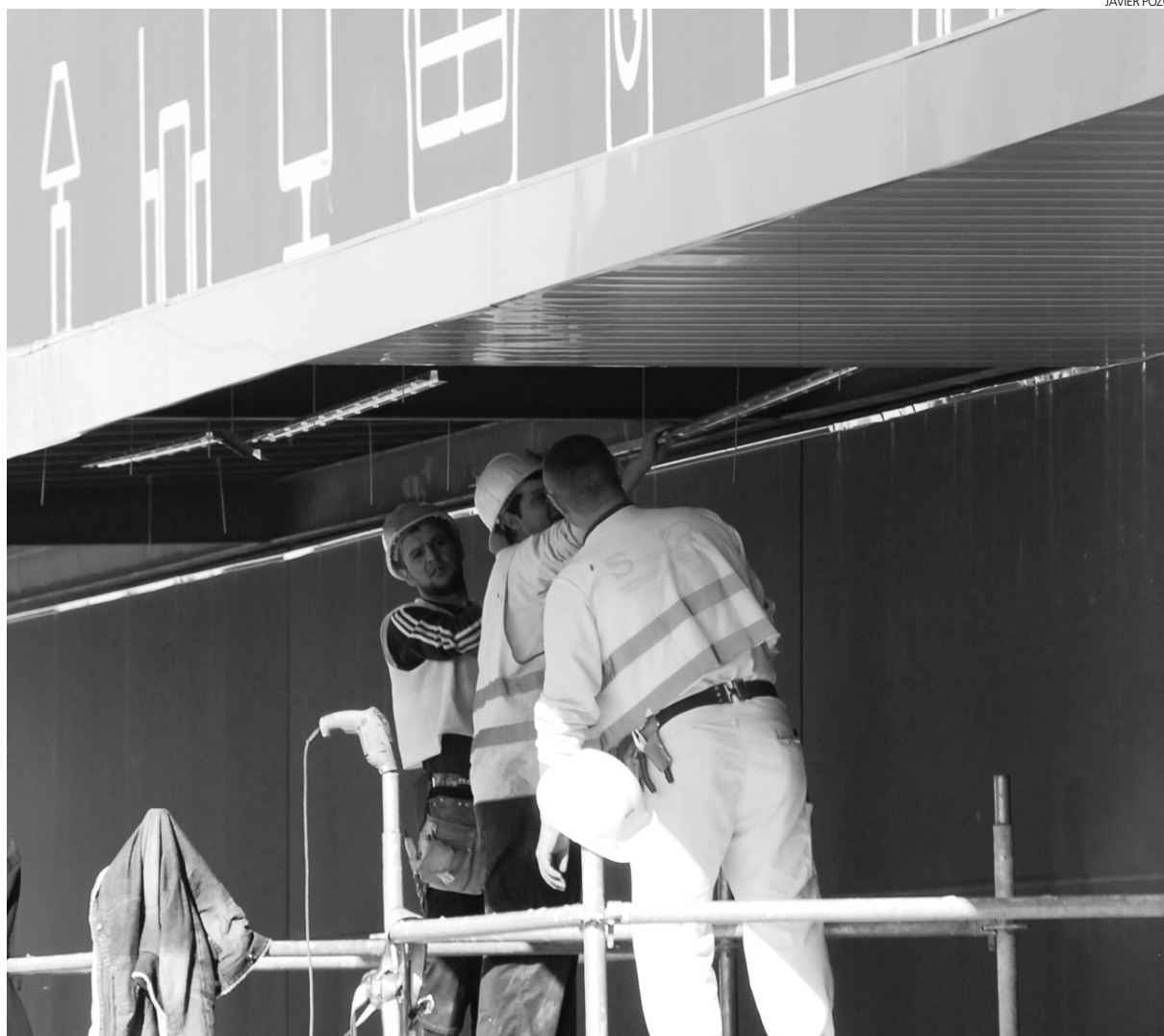
Los sindicatos solicitan que se desbloqueen los convenios pendientes.

De la misma forma se expresaba De la Cruz que reclamaba a los empresarios, ante el último dato del Índice de Precios del Consumo (IPC), res-