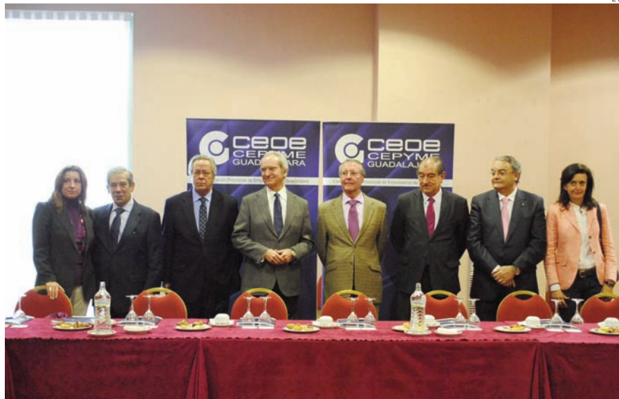
El consejero se reunió con la Confederación de Empresarios de Guadalajara.