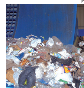
Asesoramiento en materia de residuos.

Del total de empresas asesoradas, más de 232 han sido presenciales, con el objetivo de comprobar y asesorar principalmente en el cumplimiento que las empresas hacen en materia de almacenamiento de residuos peligrosos (RP).