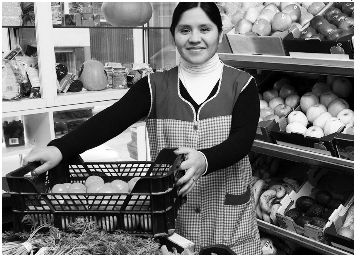
Las ventas del comercio minoristas bajaron el año pasado.

El empleo en este sector descendía en nueve regiones españolas pero Castilla-La Mancha es una de las nueve donde se ha mantenido en positivo. Concretamente, creció un 0,1% en la tasa interanual y se mantiene igual de media durante el año (0,0%). Otras comunidades donde las cifras fueron positivas, a nivel anual o en tasa interanual fueron: Baleares, Canarias, Cantabria, Castilla y León, Galicia, Comunidad de Ma-