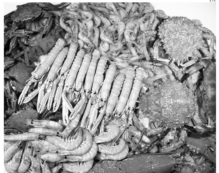
Los mariscos son muy utilizados en el restaurante.