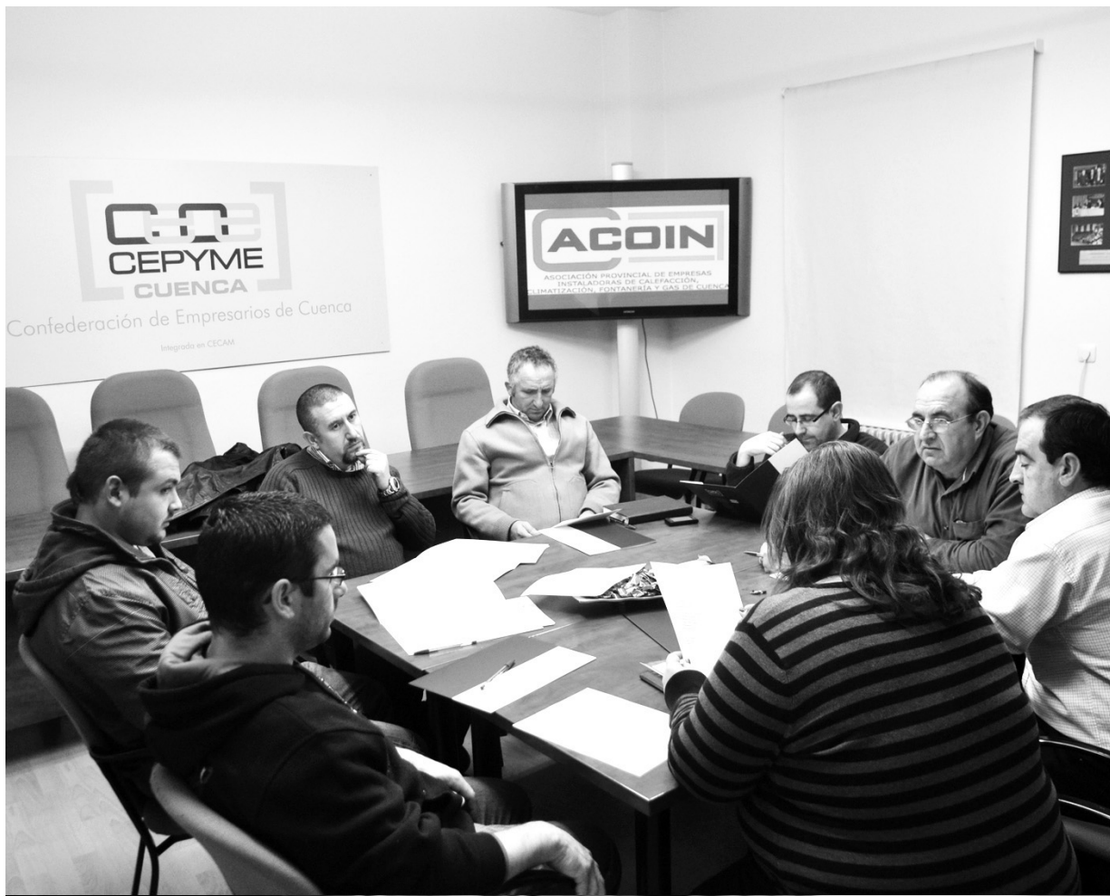
Momento de la asamblea general celebrada por ACOIN.