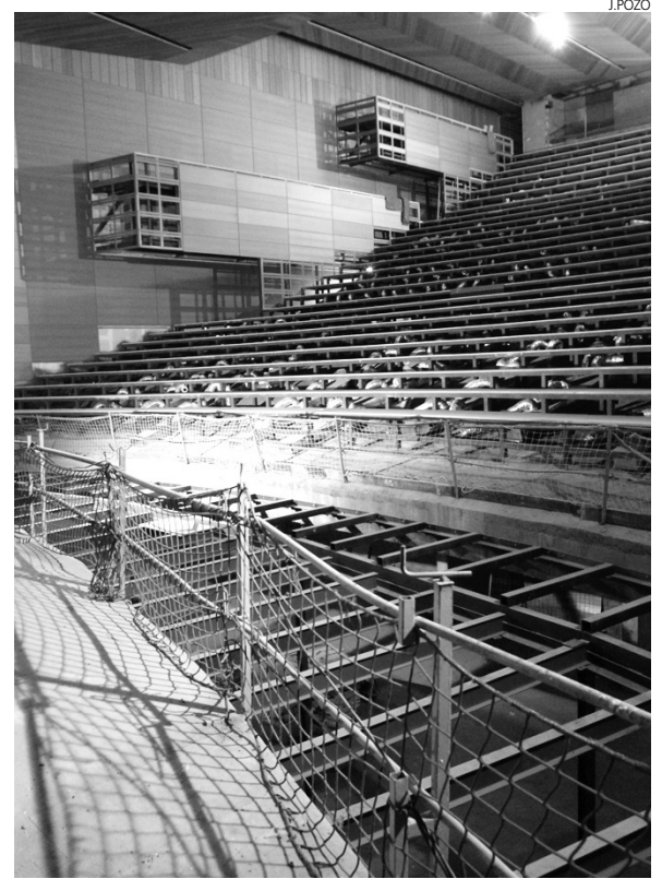
Situación de las obras del Palacio.