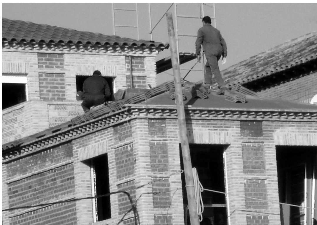
Construcción es uno de los sectores que concentra la mayor siniestralidad laboral.

También se puede entender comprendida en la obligación genérica del artículo 29.2.6 LPRL,