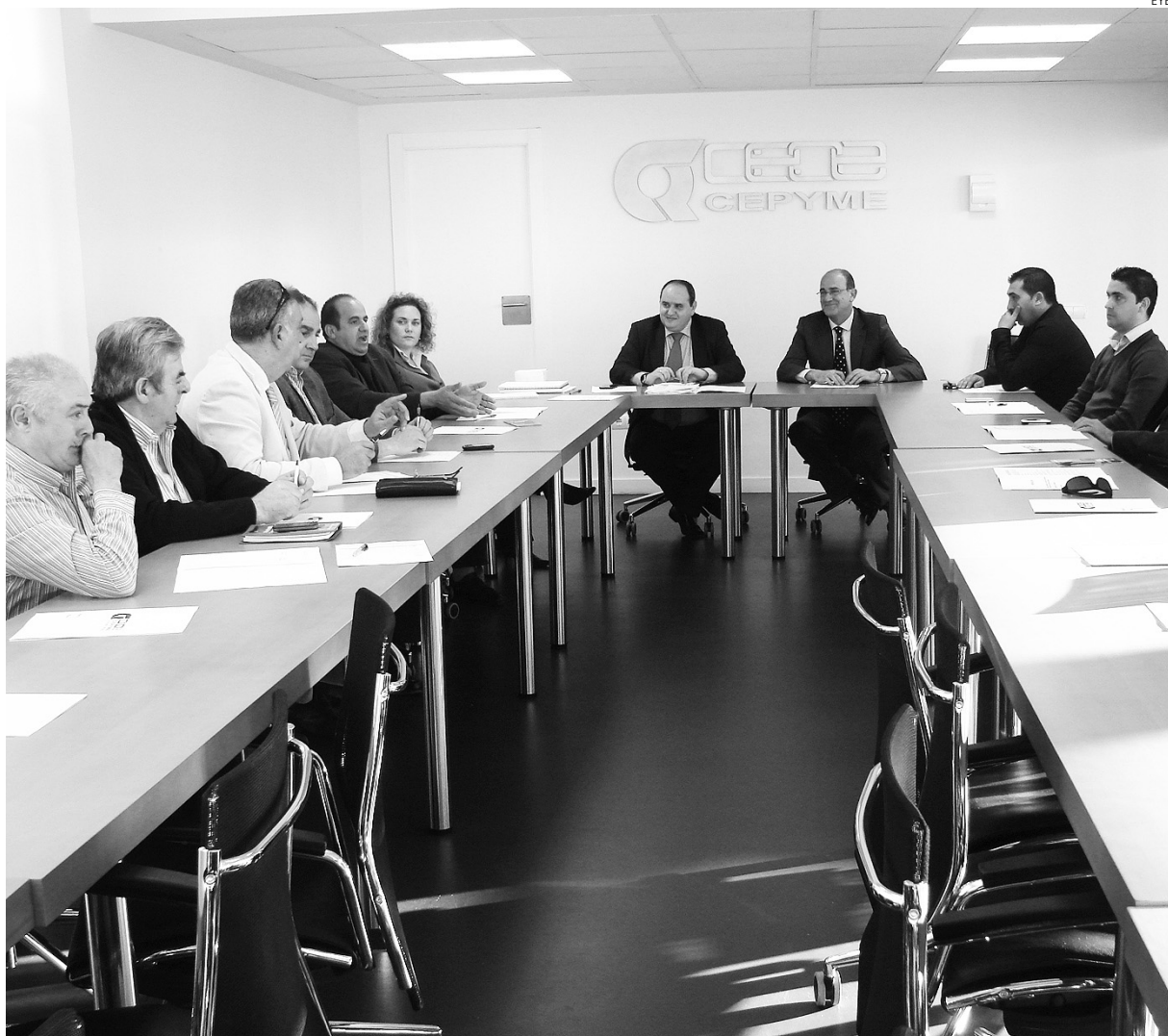
Arriba, momento de la reunión mantenida por el sector.

El sector intenta reactivar su actividad a través de diversos parámetros para coger impulso