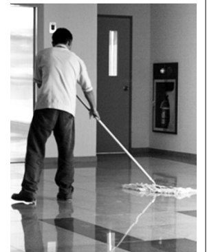
El convenio de limpieza, en punto muerto.

Los empresarios de la asociación, que están especialmente afectados por los impagos de las Administraciones y la disminución de los servicios, manifiestan su sorpresa con la postura mantenida por las centrales sindicales, cuando utilizan la negociación colectiva del sec-