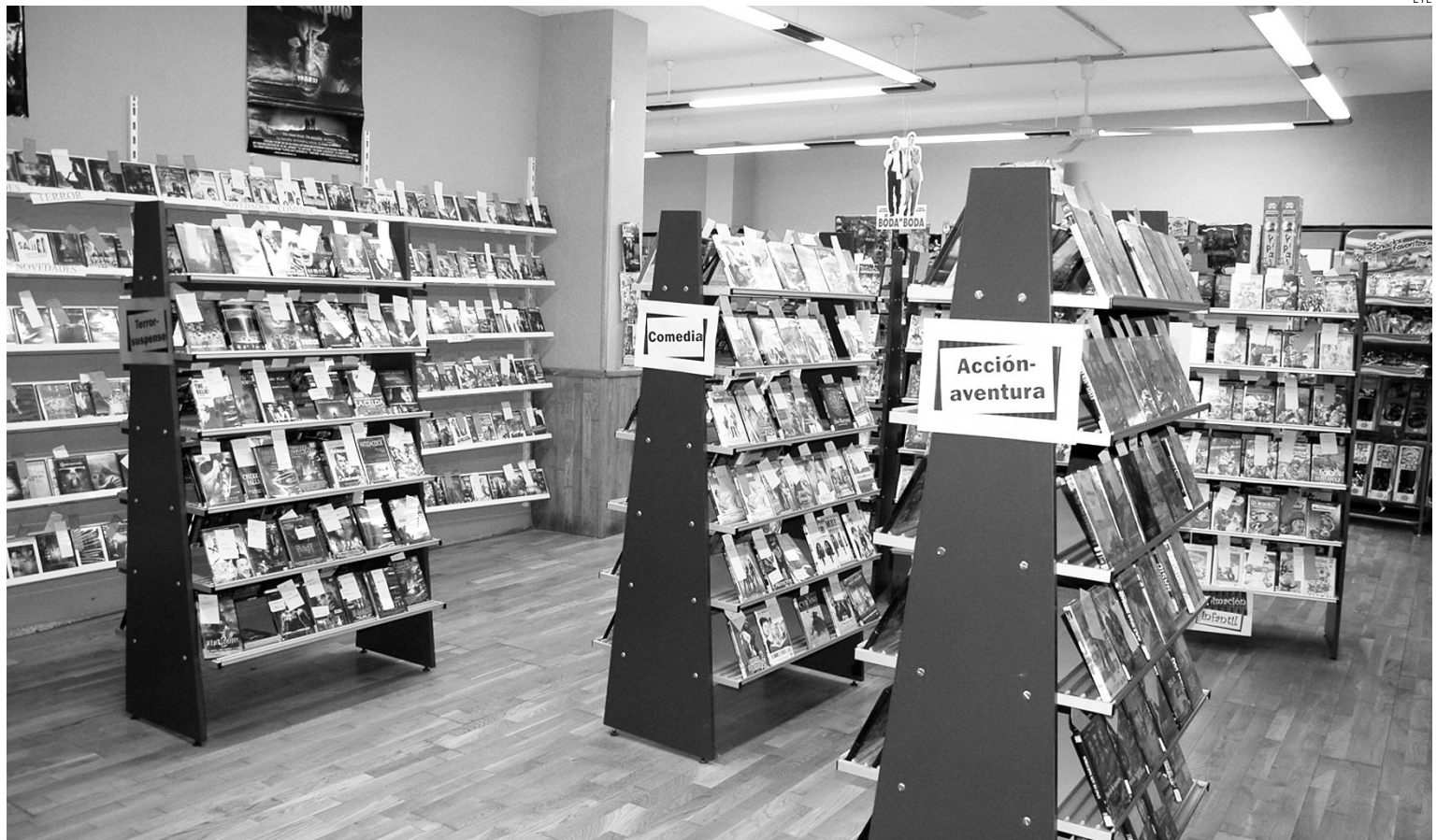
El sector del videoclub, esperanzado de recuperar parte del terreno perdido.

Así las cosas, el sector parece tener más futuro sobre todo porque ya no existirá la gran incertidumbre que había entre los empresarios. "Estaban intranquilos y muchos ni hacían obras en sus locales por si tenían que cerrar", apuntaba el