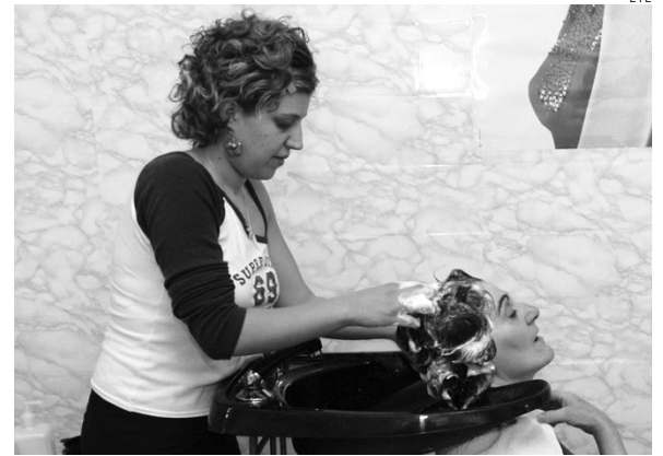
Los autónomos de Cuenca, informados sobre préstamos.

INFORME POSIBILIDAD DE PACTAR EL INTERÉS