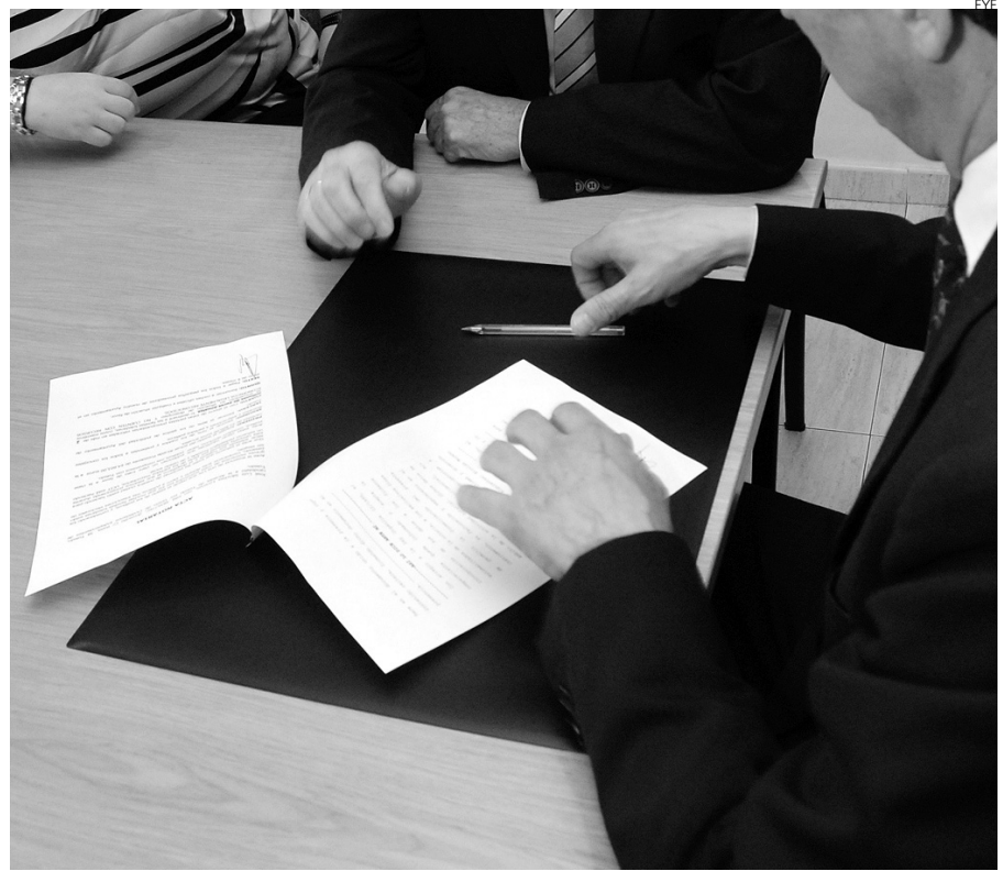
Las notarías están dispuestas a tener más competencias.

Volvió a insistir en la necesidad de la vuelta a la normalidad en temas como los créditos financieros para que el sector pueda volver a respirar y tener un mejor futuro del que existe en estos momentos.