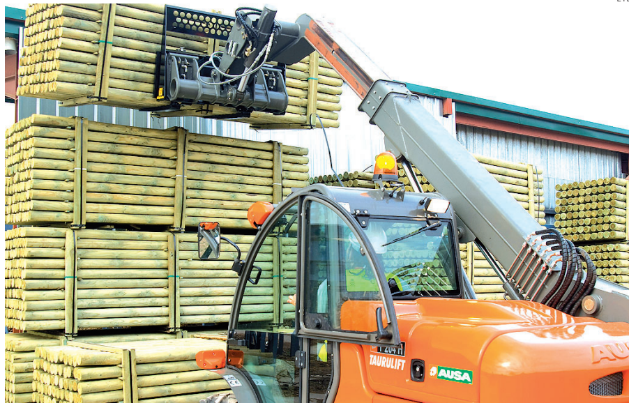
Las exportaciones están siendo una válvula de escape para la industria maderera.

Eso sí, Galicia sigue siendo, con diferencia, la primera comunidad autónoma exportadora, con 315,9 millo-