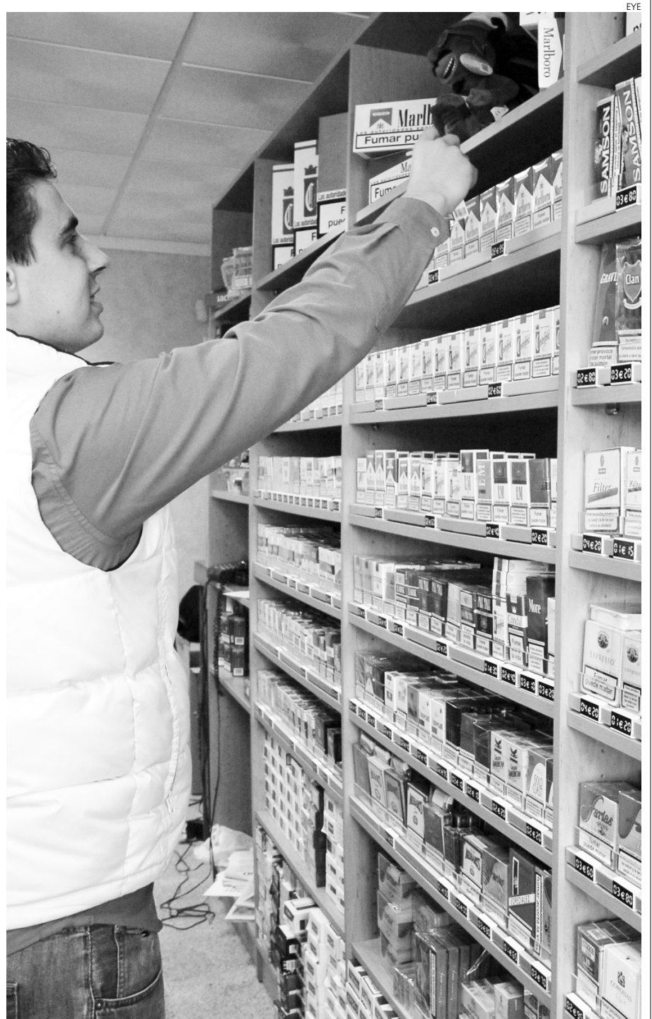
Los estancos atraviesan una situación económica muy delicada.

Según las estadísticas oficiales del Comisionado para el Mercado de Tabacos, durante el pasado año los ingresos por cigarrillos, cigarrillos y tabaco de liar ascendieron a 579,09 millones de euros, lo que supone un 2,5% menos que en 2010. En el caso del conjunto del territorio nacional, el descenso interanual ha sido más acentuado, concretamente del 4%, hasta alcanzar los 12.464,19 millones de euros.