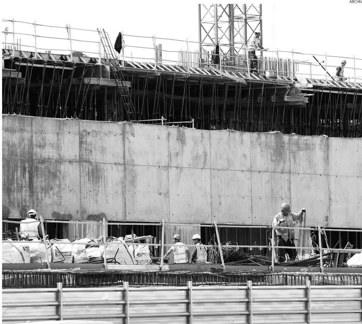
La construcción ha arrastrado al resto de sectores.