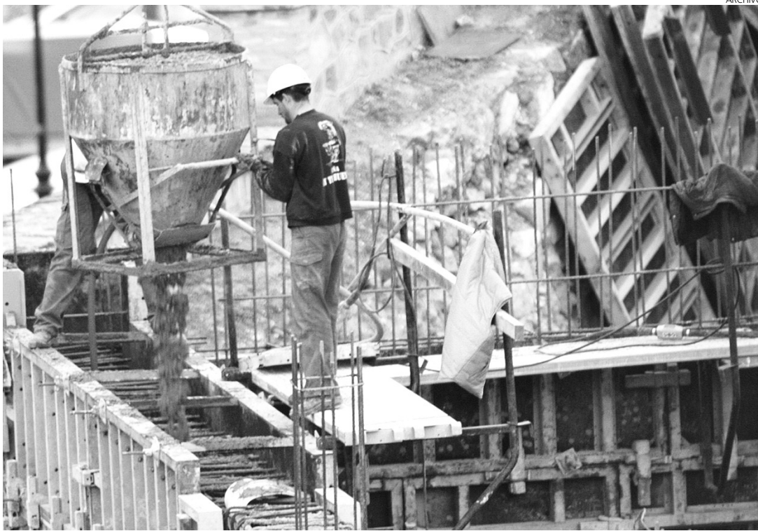
La construcción no ha empezado mejor el año.