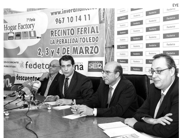
Momento de la presentación de la Feria.