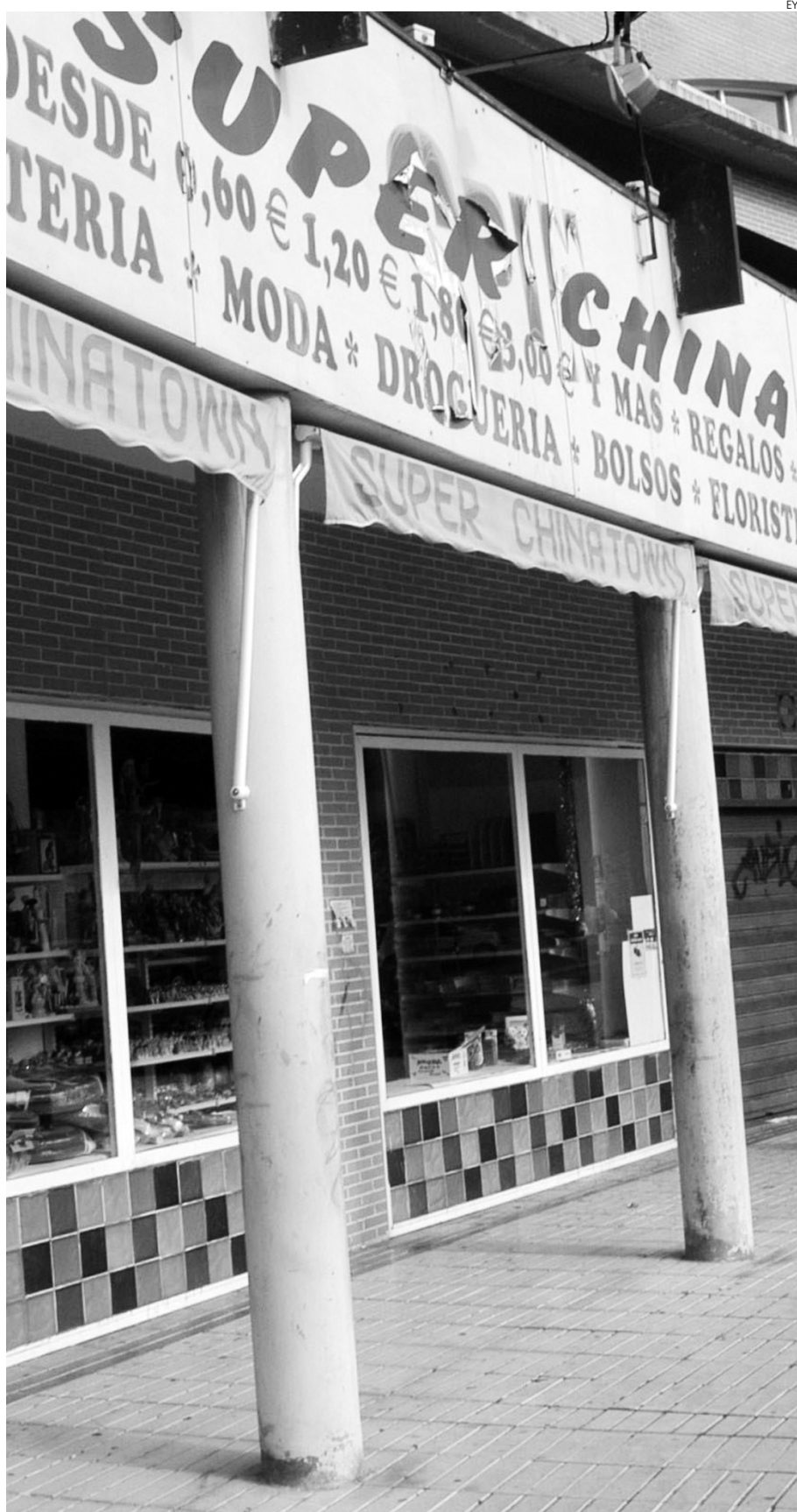
El comercio sigue siendo el sector en el que hay más autónomos del país asiático.

La mayor presencia de chinos en el trabajo autónomo encuentra su causa tanto en el espíritu emprendedor del colectivo como en los medios de financiación propios que les hace no depender en la misma medida de las entidades financieras, según explicaba el presidente de CEAT