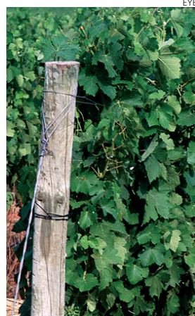
En la imagen, un viñedo castellano-manchego.

WINETech se inició el 1 de abril de 2009 y ha finalizado el pasado 31 de diciembre de 2011. En estos más de dos años de proyecto, Cooperativas Agro-alimentarias ha detectado las principales necesidades tecnológicas del sector vitivinícola de Castilla-La Mancha gracias al trabajo elaborado por los técnicos de la organización.