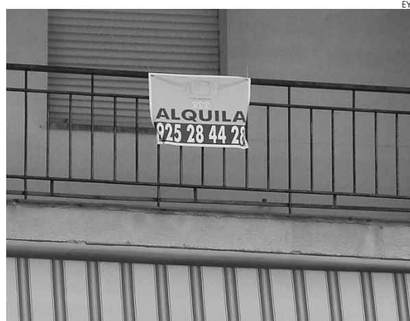
Los pisos en alquiler vuelven a estar de moda.

En la clasificación por provincias en el mes de diciembre, destaca el precio en Vizcaya (1.110 euros). En el lado contrario se encuentra Badajoz, con un precio medio de 408 euros, Cáceres, con 418 euros o Ávila, con