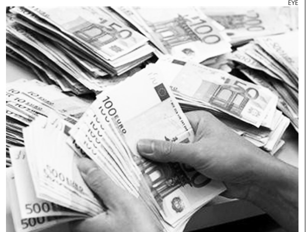
Los problemas de financiación no terminan.

Otros de los problemas que señalan las empresas son las exigencias de garantías y avales, que para el 81,3% se han incrementado. De este porcentaje, al 56,9% se les ha requerido garantía de carácter personal. Asimismo, para el 54% se ha dilatado el plazo de la respuesta de la entidad a su solicitud y un 5,5% se les ha exigido un plazo de devolución más reducido.