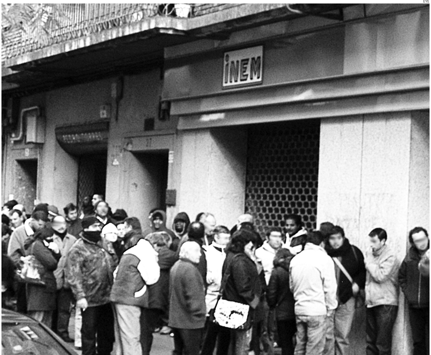
Las colas de gente a las puertas de los servicios públicos de empleo no para de crecer.

Se da la paradoja de que mientras que el número de mujeres ocupadas ha aumentado en los últimos