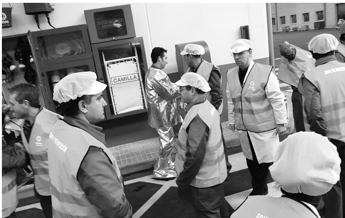
Las oficinas del antiguo Sepecam corren el riesgo de no dar a basto si continúa la escalada imparable del desempleo.