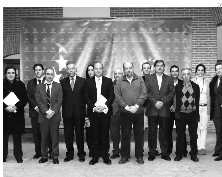
Constitución de la Comisión de Transportes e Infraestructuras de la FEMP.

En este sentido, el también teniente de alcalde y portavoz en el Ayuntamiento de Talavera de la Rei-