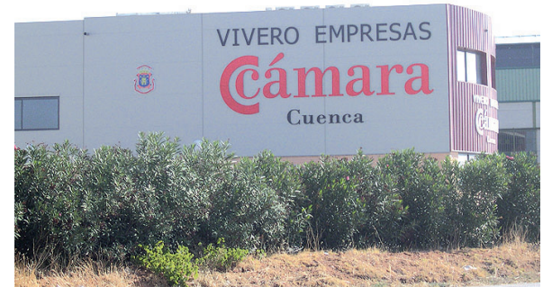
Vivero empresas San Clemente.