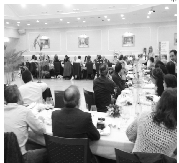
Comida de hermandad de los gasolineros de Albacete.