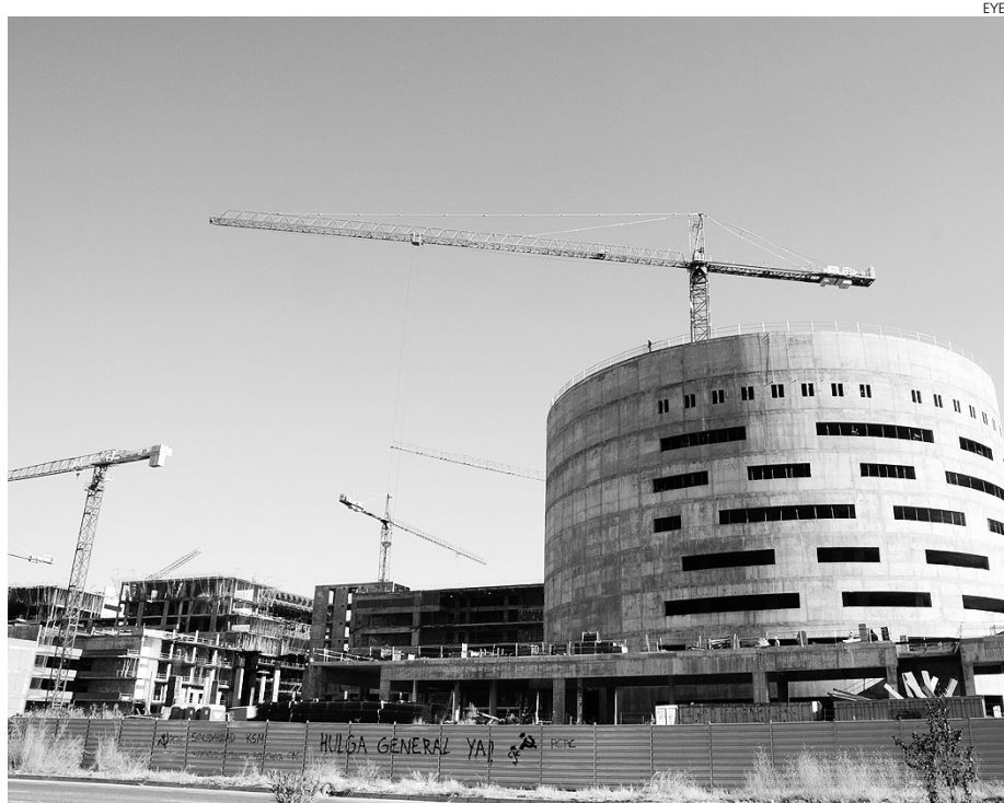
El nuevo hospital de Toledo se encuentra ejecutado al 30%.

La Junta ha abierto un proceso para crear un complejo más racional y ha rescindido el contrato a la anterior UTE