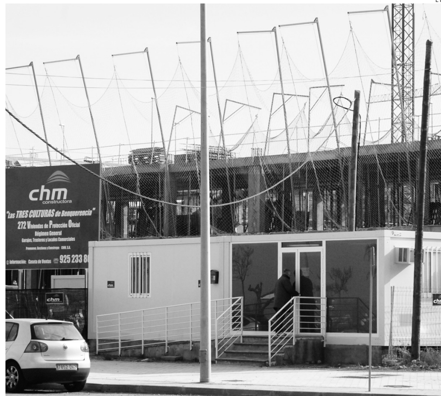
Conseguir una hipoteca para comprar un piso es casi imposible.

ron sus condiciones de financiación (140 por cada 100.000 habitantes) y también donde más hipotecas se cancelaron registradamente (130 por cada 100.000 habitantes).