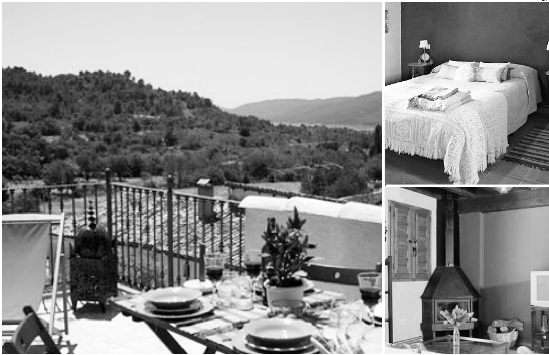
La casa rural está situada en la localidad de Chillarón del Rey.