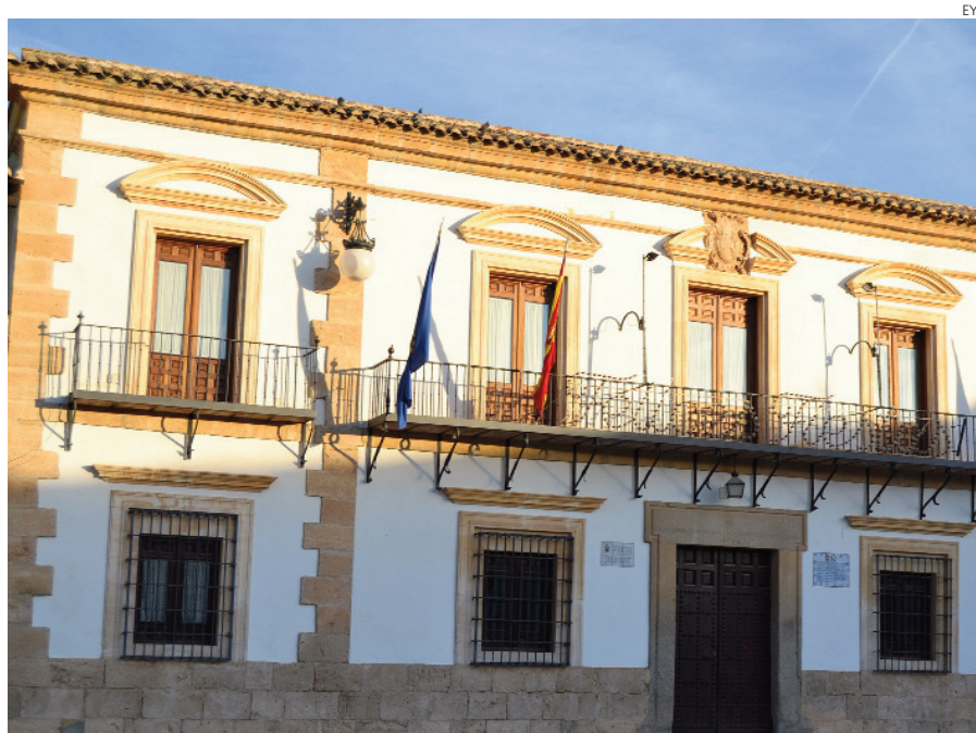
En la imagen, la fachada del Ayuntamiento de la localidad de Tembleque.

En ese sentido, desde el Ayuntamiento se pusieron en contacto con algunas empresas proponiéndoles la realización de las cubiertas y la