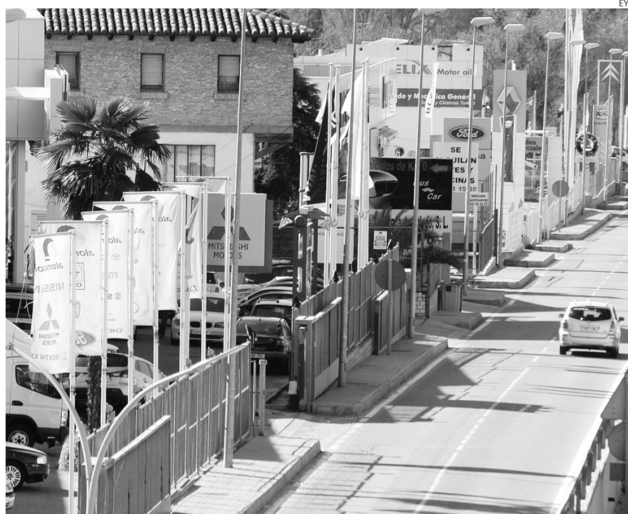
Muchos concesionarios están subsistiendo a duras penas.

mos, el grueso del mercado se concentra en los automóviles de entre 1.400 y 1.600 centímetros cúbicos, donde se contabilizaron 7.351 operaciones de compra-venta y 1,82 millones de euros de recaudación por este tributo. Tras éste se sitúan los turis-