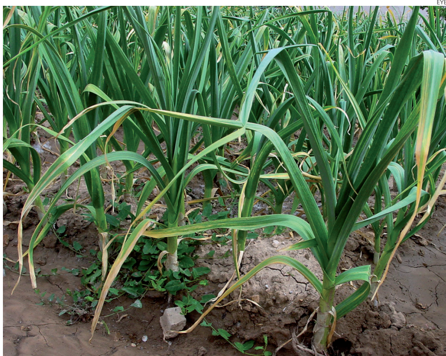
El ajo sigue subiendo en superficie.

La Mesa Nacional estima que el total es de unas 9.000 hectáreas. La subida ha sido entre un 5% y 10%