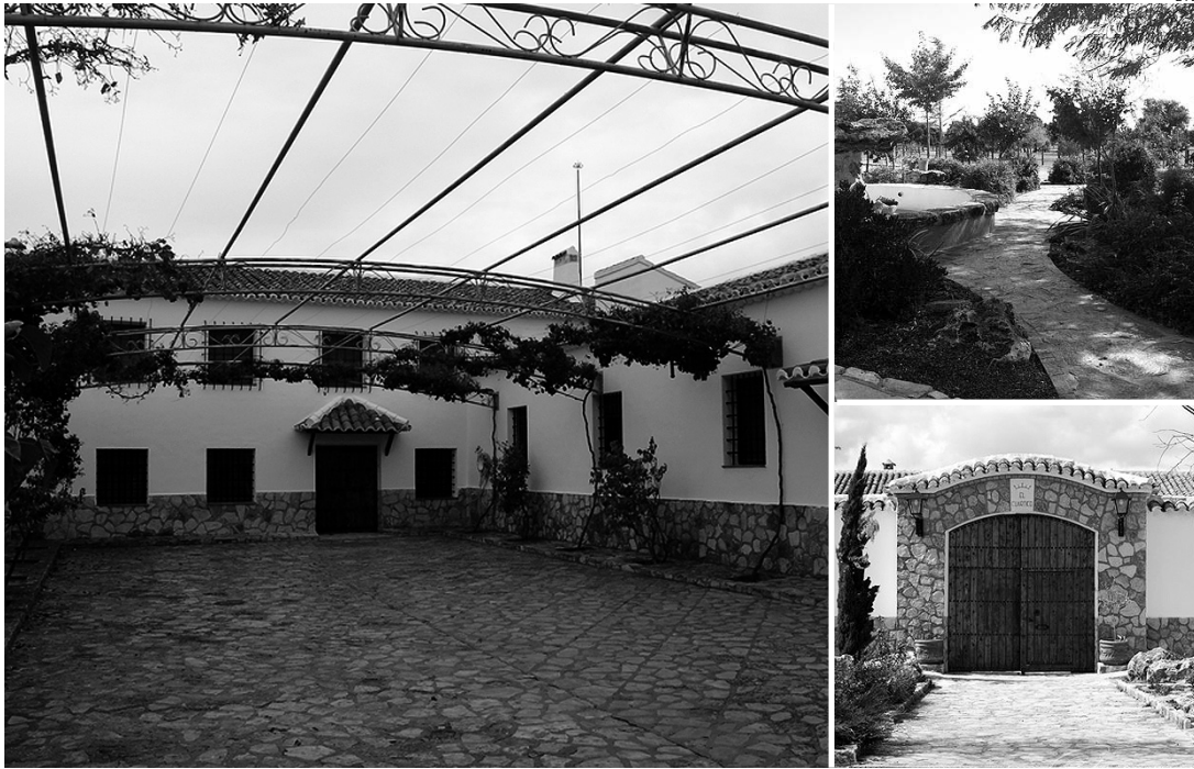
La casa rural está situada en la localidad de Villanueva de la Fuente.