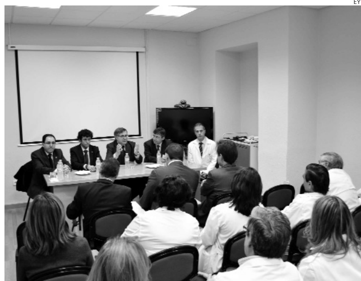
Reunión de la Comisión de Seguimiento para el futuro Hospital.