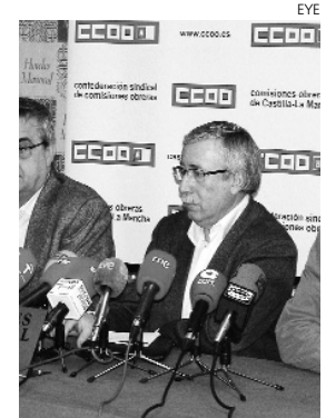
Rueda de prensa de CCOO en Toledo.

El secretario regional de FITEQA ha indicado que la pérdida de empleo de este