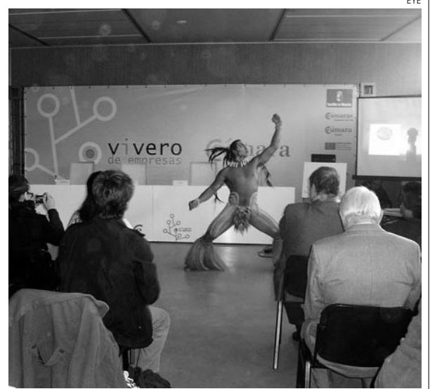
Convenio entre las Cámaras de Toledo y la de la Isla de Pascua.