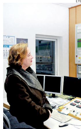
En la imagen, María Luisa Soriano durante su visita.

En el transcurso de su visita a la cooperativa ganadera Avicon en el municipio toledano de Consuegra, Soriano resaltó el esfuerzo que está realizando el Gobierno regional para impulsar el sector de la agricultura y la ganadería, "porque somos un gobierno que cree en la agricultura, un sector que genera riqueza y empleo y que estamos convenidos de que puede contribuir a paliar la crisis económica en Castilla-La Mancha".