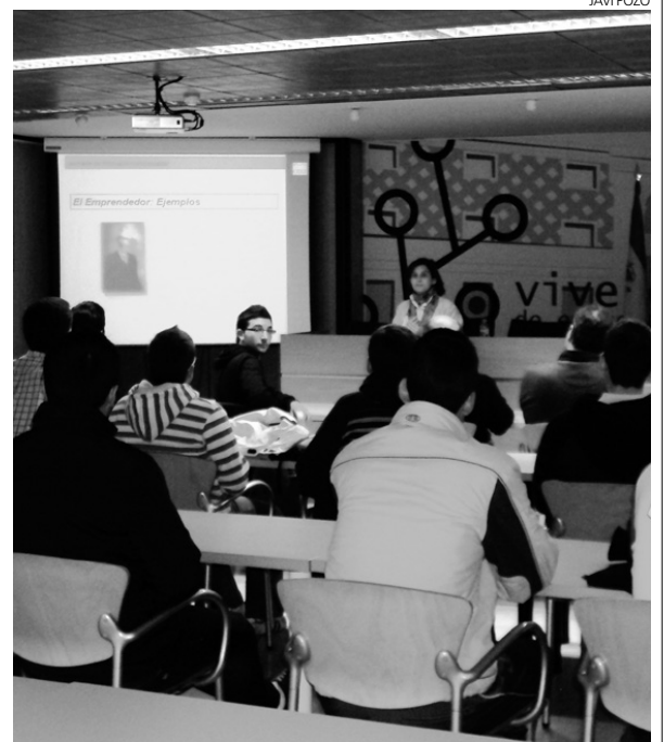
Jornada de Motivación de Fundación CEEI-Talavera.