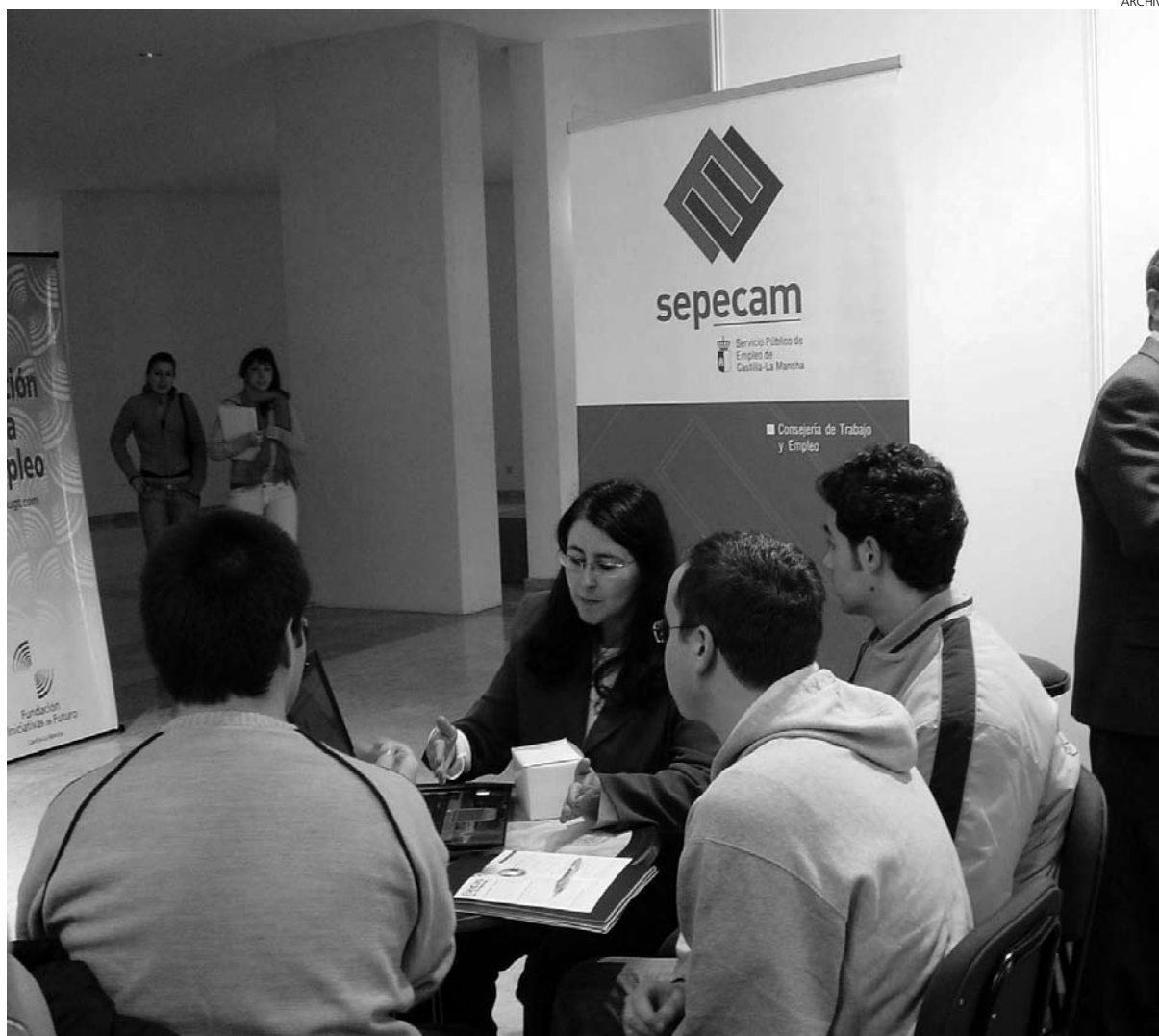
La tasa de paro juvenil en la región es una de las más altas en Europa.

Con estos parámetros, no es de extrañar que sean muchos los que se muestren escépticos ante los nuevos objetivos fijados por la Comisión Europea de cara al 2020, de