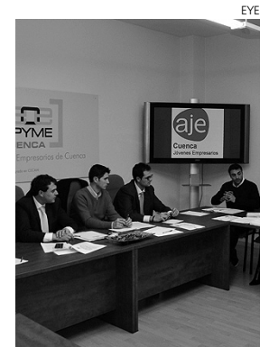
Momento de la reunión de AJE.

De este modo, además de facilitar la labor diaria del joven empresario, quieren tener una presencia más activa dentro de la sociedad cuenseña, realizando una serie de actuaciones que pongan en valor y premien la actividad de los emprendedores.