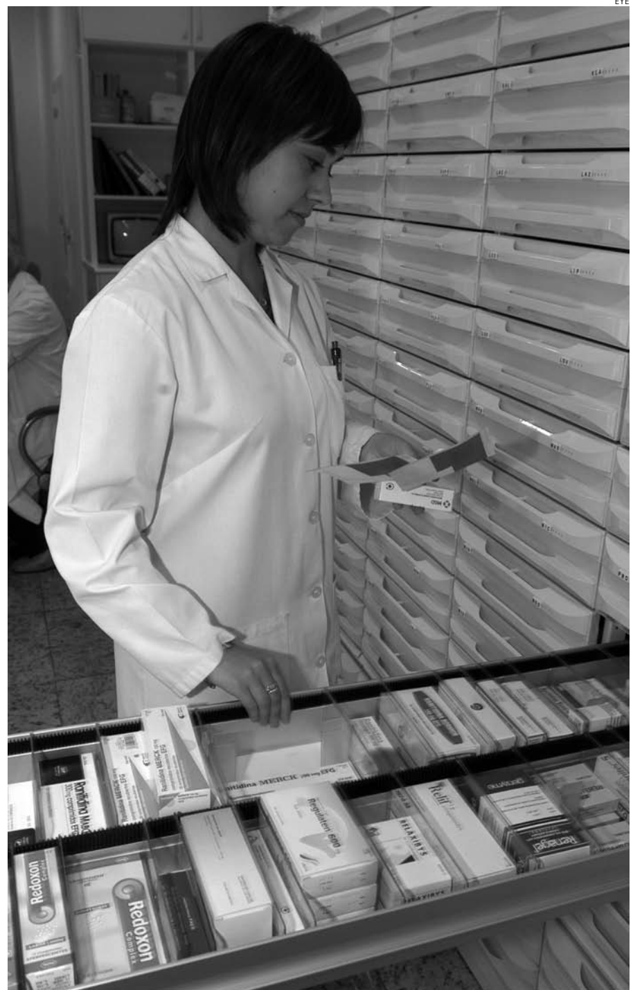
Las farmacias atraviesan una situación económica muy delicada.

Que no es poca, ya que al cierre del ejercicio de 2011 ascendió a 5.230 millones de euros, lo que supone un 26% más que la registrada el año anterior. De este importe, 406 millones corresponden a la Junta de Castilla-La Mancha.