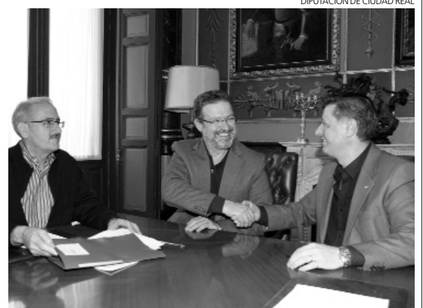
Momento de la firma del convenio de financiación.