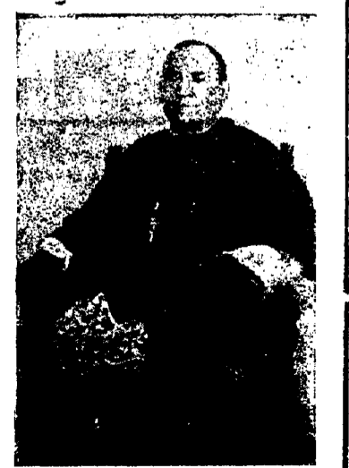
—Necesaria no, pero si convenientísima. Era el sentir general de todo el

Primeramente hemos arribado en el Palacio episcopal, donde nuestro querido Prelado nos ha recibido con su paternal amabilidad. El coche le esperaba en la puerta y esto nos dá a entender que algún quehacer le espera, por lo que sin preámbulos le expresamos el objeto de nuestra visita, e inmediatamente preguntamos: —¿Veía V. E. necesaria la definición dogmática de la Asunción?