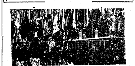
Las «Juventudes del Frente de Juventudes» desfilan ante S. E. el Jefe del Estado con motivo del XV Aniversario de su fundación. A los actores conducidos en Madrid con diversas manifestaciones, arrojaron el Gobierno en pleno y las máximas autoridades y «fronteras».