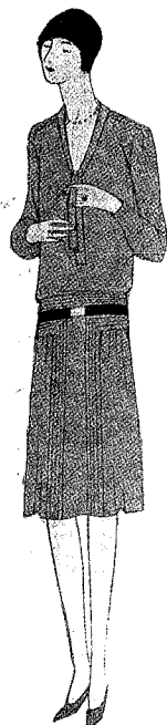
Vestido de vuelo «Jorgia», en el cual el frente del vestido forma una pequeña chorrera cortada de la misma tela; la falda en forma.