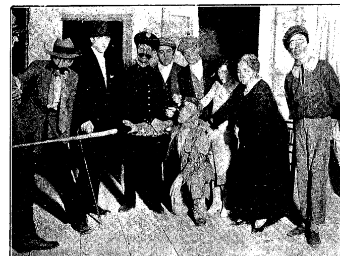
Una graciosa escena de «El Miserable Puchero»