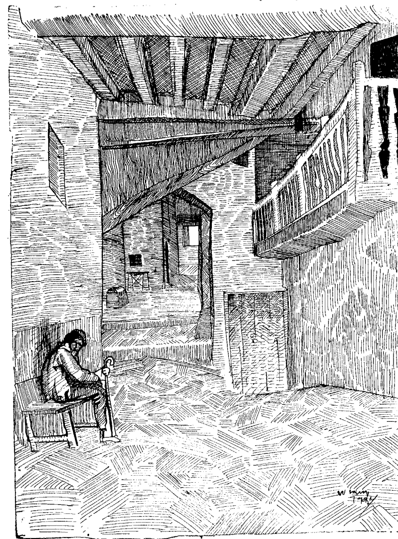
Posada de la Plaza Mayor