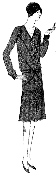
Las costuras rellenas de lana mecha guarnecen este vestido que es recogido por un cinturón de gamuza roja.