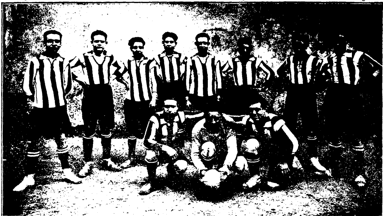
El once del Athletic Mercantil que está llamado a ser uno de los mejores de Cuenca

Los niños exploradores, dieron una clara muestra de su resistencia y de su formalidad, figurando