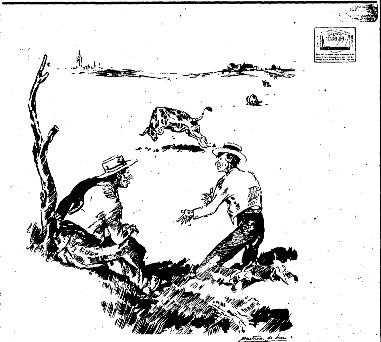
DOLOR DE MADRE , por Martínez de León —¿Que le pasa a la "Pinta" que rebreca tanto? —Né bome! (Le Radio que lo lo charla y acaba de decir que le están toquendo un hueso suyo en Barcelona)