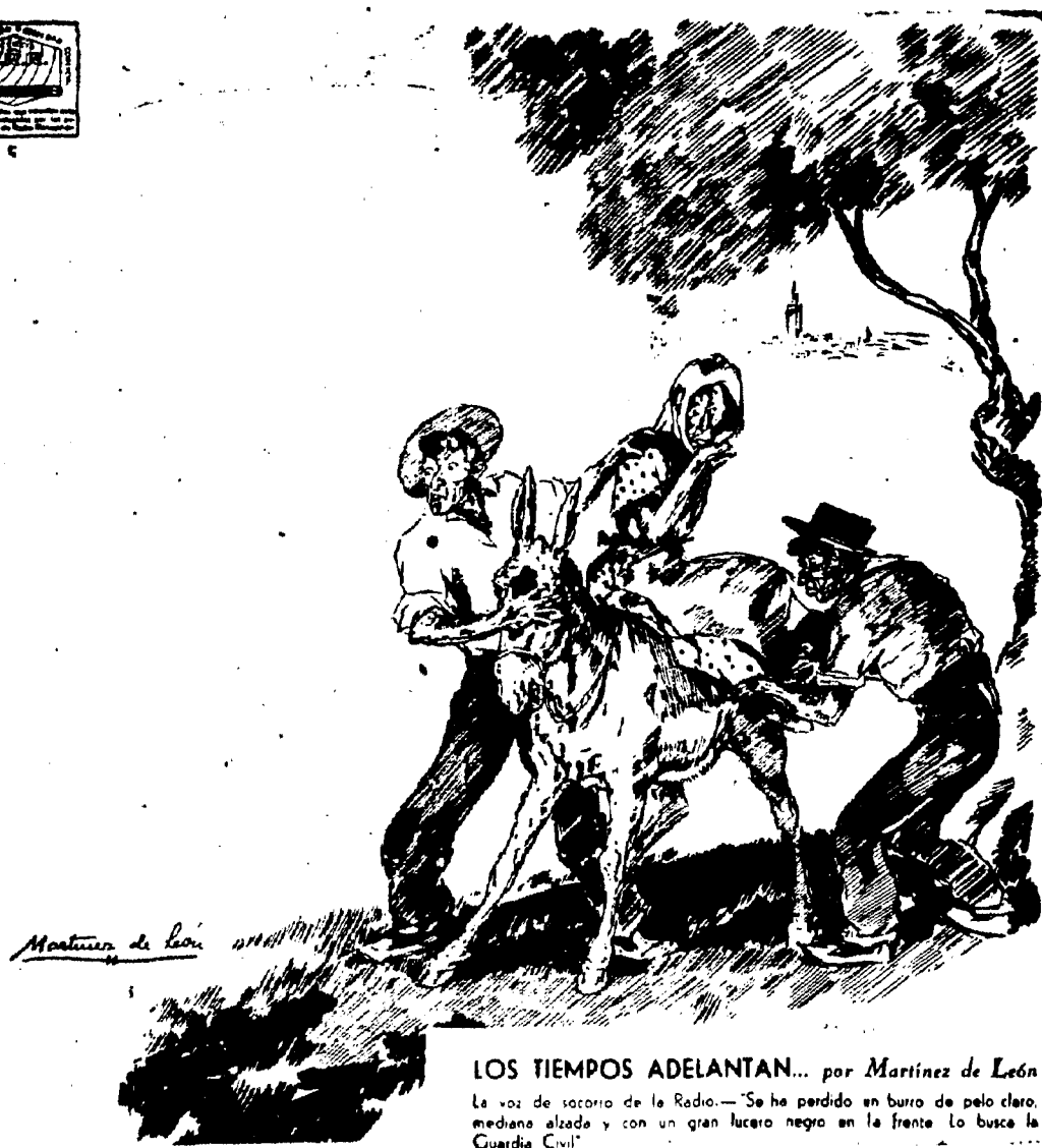
LOS TIEMPOS ADELANTAN... por Martínez de León La voz de socorro de la Radio.—Se ha perdido un burro de pelo claro, mediana alzada y con un gran lucero negro en la frente. Lo busca la Guardia Civil.

Escuche Vd. los famosos Philips "todas las ondas", "Receptodo" y "Nautilus", que reciben con extraordinaria musicalidad todas las emisoras del mundo.