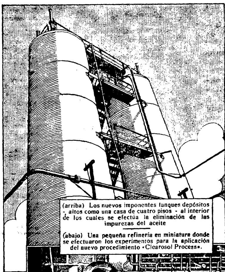
(arriba) Los nuevos imponentes tanques depósitos - altos como una casa de cuatro pisos - al interior de los cuales se efectúa la eliminación de las impurezas del aceite