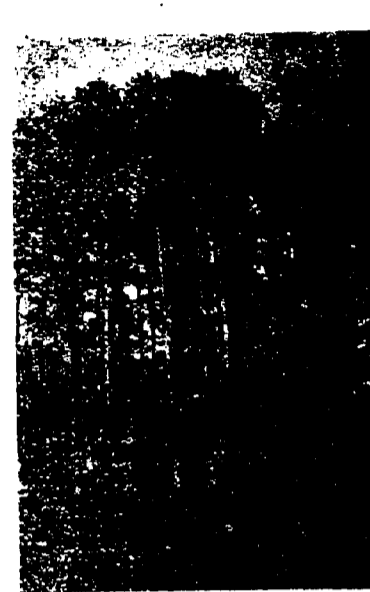
SIERRA DE CUENCA