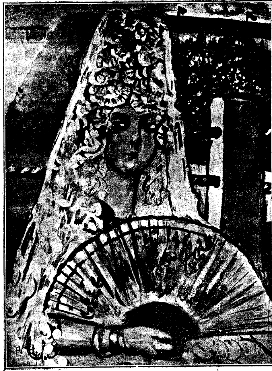
(Dibujo de Pedro Barragán)