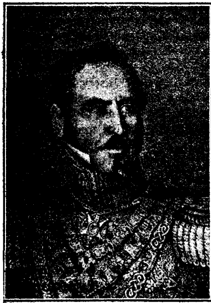
DÓN BALDOMERO ESPARTERO.

Vamos a pasar la tarde en el pueblo de Espartero, en la vecina villa de Granátula, donde el manchego ilustre, que había de sentarse en el trono de España, abrió los ojos a la luz. ¿Conoce la Mancha a Espartero...? ¿Las multitudes conformistas y resignadas de la Mancha, las «gentes» de la Mancha, con-