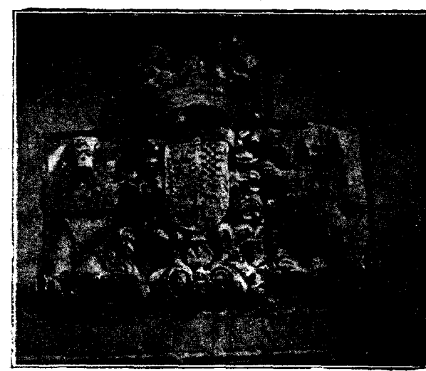
ALMAGRO.—Registramos hoy uno de los detalles escultóricos que honran el arsenal de las curiosidades artísticas almagresas, labrado sobre la portada de la Iglesia del Convento de Monjas de la Orden de Santo Domingo, construido a fines del siglo XVI.