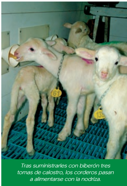
Tras suministrarles con biberón tres tomas de calostro, los corderos pasan a alimentarse con la nodriza.

decían que la oveja no se podía ordeñar a máquina....hoy prácticamente en todas las ganaderías de ovino hay sala de ordeño.