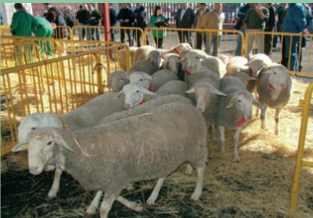
Los animales que van a ser subastados se agrupan por ganadería en distintos apartados.

La próxima Bolsa de Sementales coincidirá con EXPOVICA-MAN, Feria Agrícola y Ganadera de Castilla-La Mancha, y se celebrará el 18 de mayo en el Pabellón de Ovino del recinto ferial del IFAB (Albacete). Desde que en el año 1994 se comenzara a organizar estos eventos se han vendido un total de 2.323 animales, en 61 bolsas celebradas.