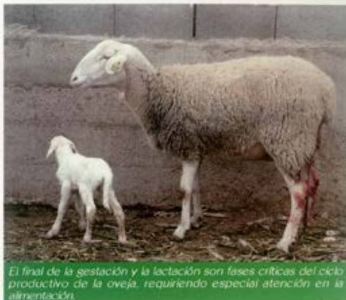
El final de la gestación y la lactación son fases críticas del ciclo productivo de la oveja, requiriendo especial atención en la alimentación.

Con la finalidad de lograr raciones equilibradas es obligado complementar el ensilado con otros alimentos, ya que de lo contrario la oveja no cubrirá sus necesidades energéticas, al ser estas mayores