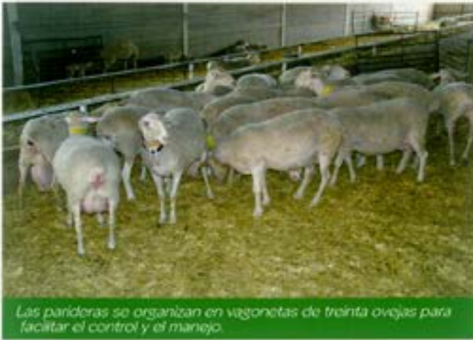
Las parideras se organizan en vagones de treinta ovejas para facilitar el control y el manejo.

componentes de la misma, cosa que en la práctica no se podía llevar a cabo con el ensilado.