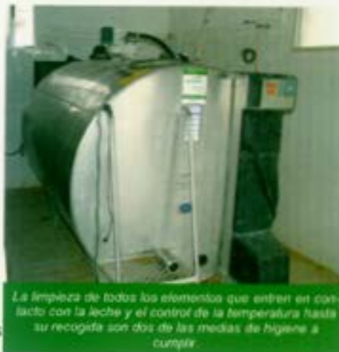
La limpieza de todos los elementos que entran en contacto con la leche y el control de la temperatura hasta su recogida son dos de las medidas de higiene a cumplir.

- Para cada movimiento de animales, se dispone de los certificados sanitarios adecuados.