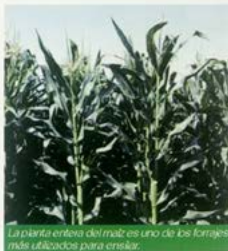
La planta entera del maíz es uno de los forrajes más utilizados para ensilar.

El ensilado de maíz es un producto muy energético pero pobre en proteína y minerales.