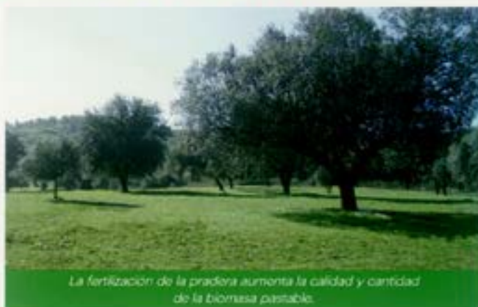
La fertilización de la pradera aumenta la calidad y cantidad de la biomasa pastable.

La unidad de fósforo es 1,5 veces más barata en el DAP que en el superfosfato, además el DAP contiene 18 unidades de nitrógeno.