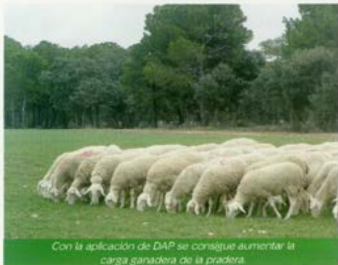
Con la aplicación de DAP se consigue aumentar la carga ganadera de la pradera