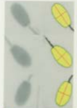
Imagen obtenida de una muestra de semen a través del programa informático que determina las medidas de cada espermatozoide.