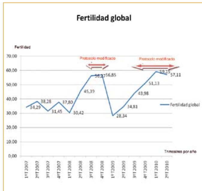
Gráfico 1: Aumento de la fertilidad entre 2007-2010 en los periodos de aplicación del protocolo de IA modificado.

Entre 2008 y 2010, en el periodo comprendido entre julio y diciembre de 2008 por un lado, y entre julio de 2009 y junio de 2010 por otro, obtuvimos 1.630 partos de 2965 inseminaciones, lo que corresponde a una fertilidad media de 54,4% . En época desfavorable de anestro estacional (primer semestre 2010), obtuvimos 583 partos de 1000 inseminaciones (58,3% de fertilidad) y en época favorable de reproducción ovina (2º semestre 2008 y 2º semestre 2009) logramos 1.115 partos de 2.121 inseminaciones, es decir una fertilidad igual a 52,5%. Estos resultados están casi 20 puntos por encima del año anterior (2007) : donde se realizaron 4.212 inseminaciones y parieron 1.481 animales (35% fertilidad).