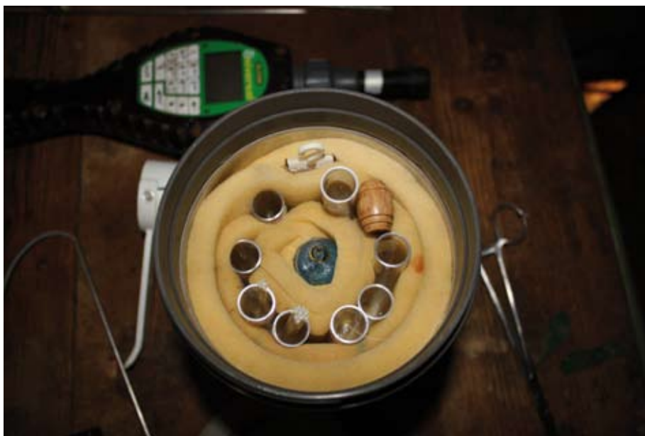
En esta imagen del interior del termo se puede observar la banda de goma espuma de poliuretano, alrededor de la que se disponen las dosis seminales, y la ampolla de ácido acético que, colocada en el centro, permite que la temperatura en el interior del termo se mantenga entre 15 y 16° C.

En Roquefort, las ovejas Lacaune no se ordeñan inmediatamente después de la IA, debido a que durante el ordeño