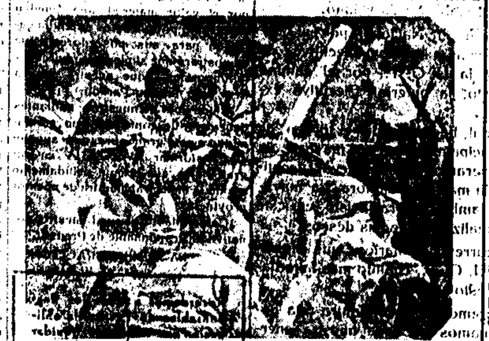
Intero a este momento, los trotskistas de la izquierda de España, se unieron a la unidad juvenil.