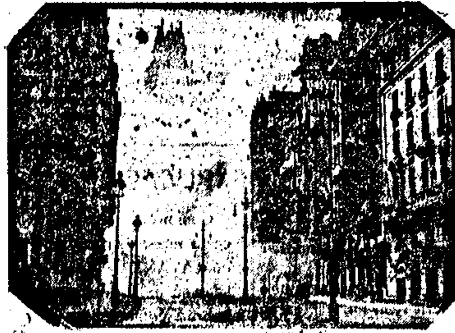
El fascismo venga sus derrotas disparando obuses sobre Madrid. He aquí el momento de hacer explosión uno de estos, en la tan martirizada telefónica.