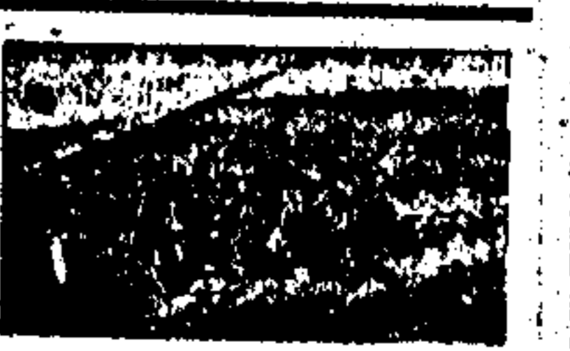
Un grupo de soldados de la República