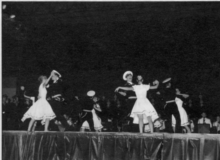
Excepcional representación de los Coros, Ballet y Orquesta de la Marina Rusa.

La Caseta Municipal Joven también se pudo ver llena de personas que disfrutaron con las actuaciones de grupos musicales que están en pleno éxito, tales como «La Unión», «Gabinete Caligari», «La Trampa», «Greta y los Garbo», llenos de animación y buena música.