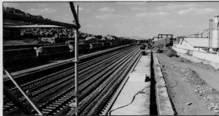
Vista general de las obras de la nueva red de vías y andenes para el AVE.