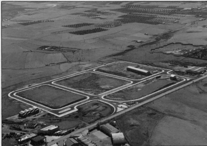
El Polígono Industrial SEPES en la actualidad.

Hasta el momento SEPES ha recibido un total de sesenta peticiones de compra. Estos 60 industriales recibirán en breve una carta informativa de SEPES, en la que, además del precio y condiciones de la