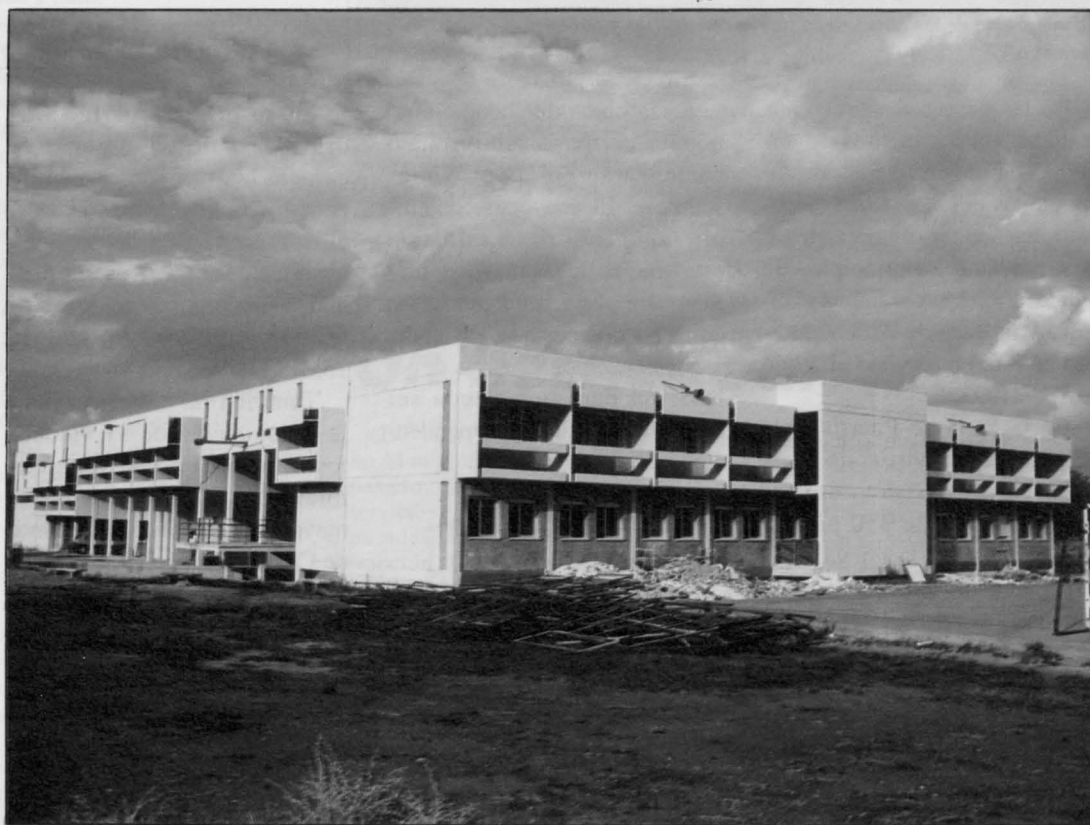
El nuevo Instituto de Bachillerato Dámaso Alonso.

C.P. «Giner de los Ríos», «Gonzalo de Berceo», «Calderón de la Barca» y las próximas a comenzar en el «Menéndez Pelayo».