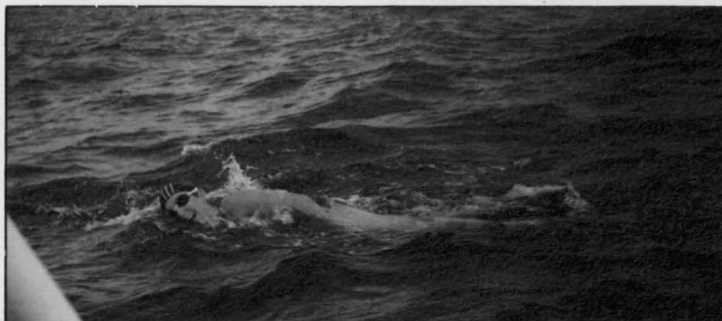
Un momento de la travesía en la que invirtió casi 11 horas.