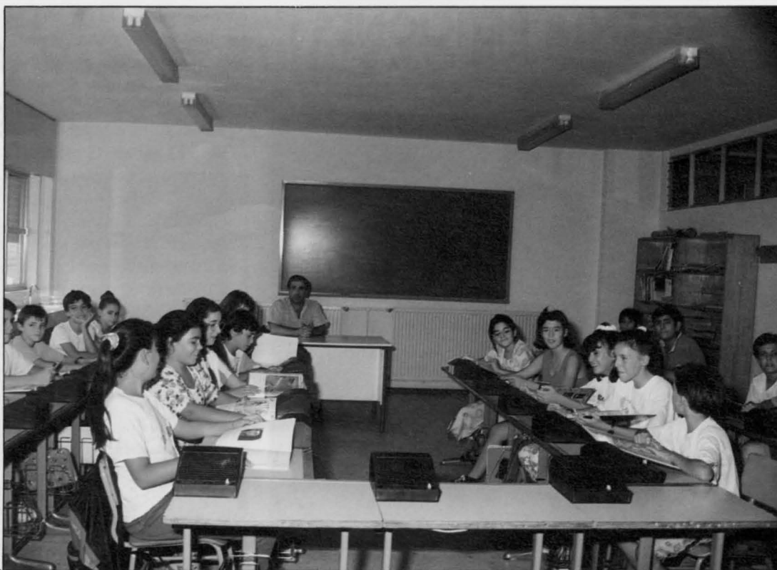
Los colegios de Puertollano están dotados con un equipamiento cada vez más completo

En Puertollano existe un Consejo Escolar Municipal. ¿Cómo puede potenciarse desde la Dirección Provincial? ¿Qué participación