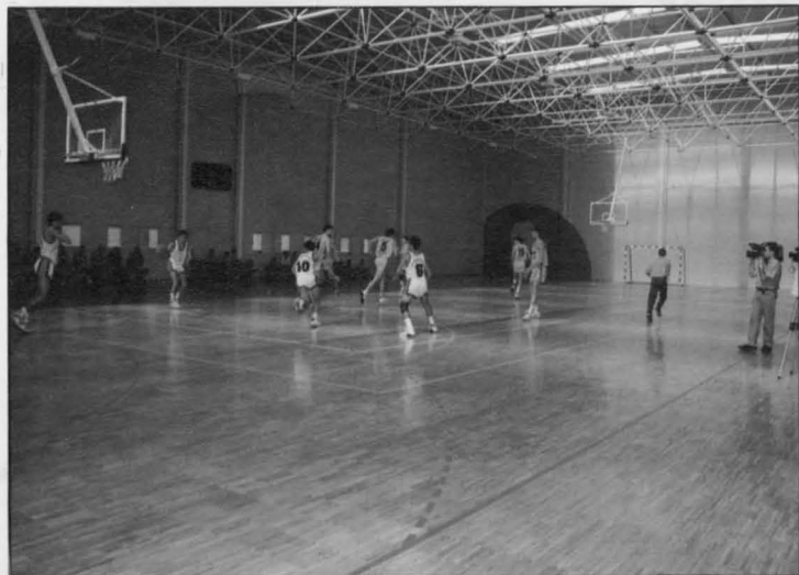
Un momento del partido de baloncesto entre el Dinamo de Kiev y el equipo local en el nuevo Pabellón Polideportivo.