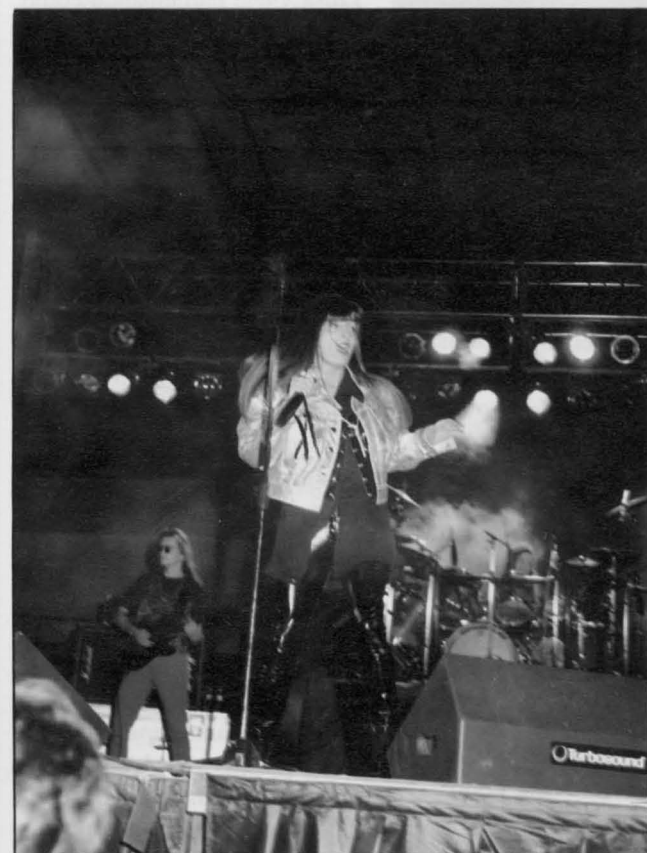
Actuación de «Greta y los Garbo» en la Caseta Municipal Joven.

Han completado el programa de actividades de «Estelasolar 91», los concursos infantiles de dibujo y cuentos (tema: Universo), noches de observación astronómica y un viaje al Planetario de Madrid.