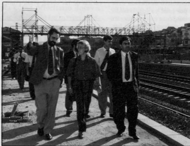
El Alcalde de Puertollano, Santiago Moreno, explica la situación de las obras de la nueva estación de ferrocarril a la Presidenta de RENFE, Mercé Sala, en compañía del Gobernador Civil de Ciudad Real, Tomás Morcillo.