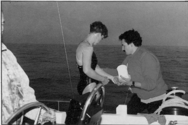
Al iniciar la travesía, unta su cuerpo de grasa para combatir las frías aguas del Estrecho.