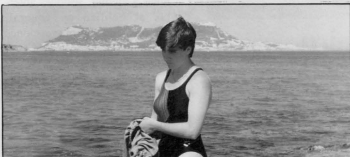
Antes de batir el récord con el Estrecho de Gibraltar al fondo.