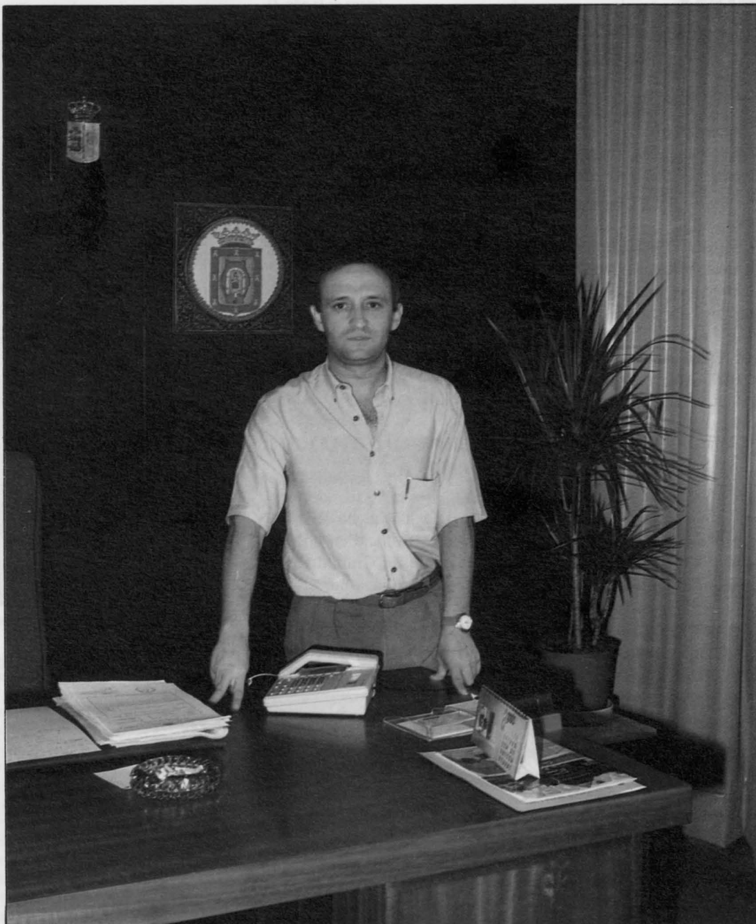
El Director Provincial en su despacho.

Yo destacaría, por el volumen de inversión, el Instituto Número 3 ya en funcionamiento y el n.º 4 cuya construcción ha sido aprobada. Junto a ellas las reformas en el Instituto «Dámaso Alonso» y en los