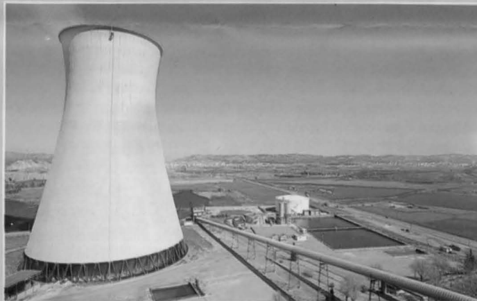
Vista general de la central térmica de Sevillana, cuya propiedad ha sido transferida a la empresa Eneco.

Esta operación no ha surgido repentinamente, sino que fue diseñada hace tiempo, dentro del marco de reordenación del sector eléctrico que se está produciendo en España. Ya en el año 1991, el acuerdo