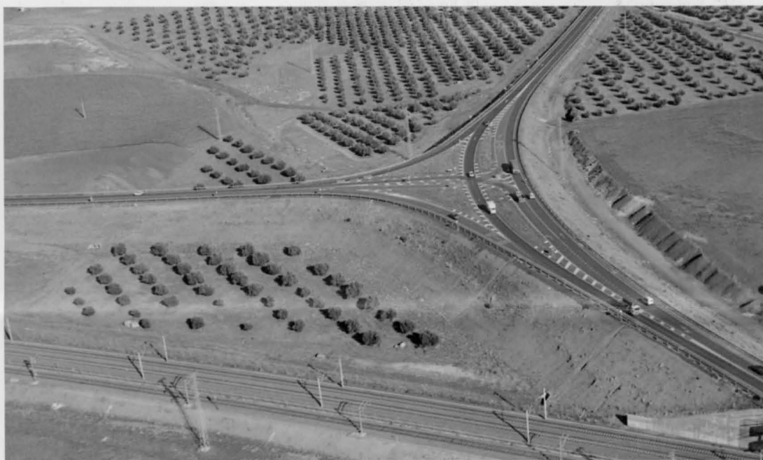
Vista aérea de la N-420 a su salida de Puertollano. En primer término la línea férrea de alta velocidad.

Además, la línea ferroviaria Manzanares-Ciudad Real pasará a utilizar alta velocidad, con lo cual los trenes alcanzarán los 250 kilómetros por hora en ese tramo. Todo ello contribuirá a mejorar sustancialmente las comunicaciones de nuestra Ciudad con el exterior.