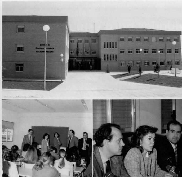
En la foto superior, vista general del nuevo instituto y en las inferiores la Directora General de Centros Escolares del MEC, Carmen Maestro, durante su visita a las aulas y la rueda de prensa posterior.

En estos momentos hay 348 centros que, como el Galileo Galilei, imparten la anticipación de la Secundaria en el territorio del MEC. Se prevé que en el próximo curso ese número se eleve hasta 470 centros. El plazo para generalizar la ESO en los institutos ya construidos es de dos o tres años.