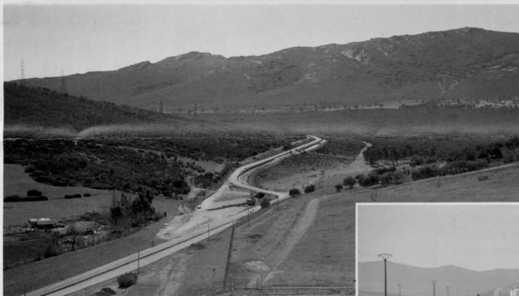
Vista parcial de las obras de mejora del trazado de la carretera a Mestanza y en el ángulo derecho detalle su desdoblamiento.

La carretera CR-502 que enlaza Puertollano con el Puerto de Mestanza se encuentra en la actualidad en obras con el fin de mejorar su trazado y reforzar el firme a lo largo de 8 kilómetros. Las obras, con una inversión superior a 166 millones de pesetas, permitirán ampliar las posibilidades de conexión de nuestra