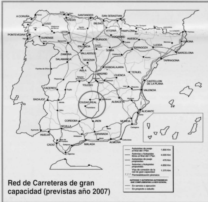
Red de Carreteras de gran capacidad (previstas año 2007)

Entretanto, la línea ferroviaria Ciudad Real-Manzanares va a ser acondicionada para que los trenes que circulan por ese tramo puedan aumentar sensiblemente su velocidad, hasta alcanzar entre 200 y 250 kilómetros por hora, lo que redundará en una mejora más en las comunicaciones.