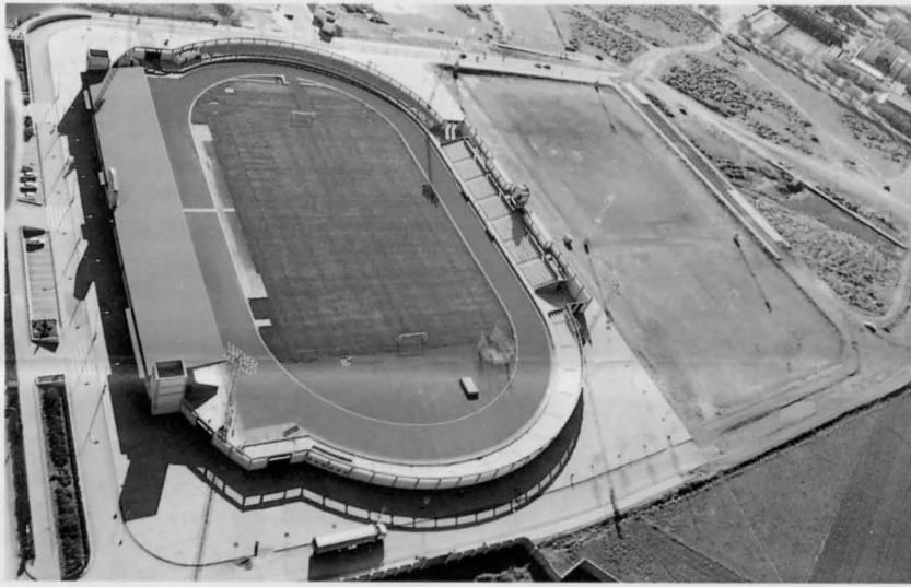
El nuevo Pabellón Polideportivo Cubierto se construirá junto al Estadio Municipal, según se muestra en la fotografía aérea, y tendrá un aforo de 1.500 espectadores.

Después de este gran pabellón, le seguirá la construcción de otro polideportivo en la zona sur de la Ciudad.