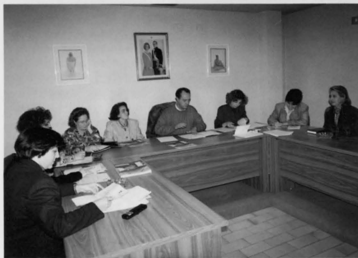
Reunión del Consejo Local de la Mujer, presidido por el Alcalde.

Según la dirigente de I.U., en unos tiempos de crisis como los actuales, la mujer corre el peligro de que sus reivindicaciones queden aparcadas, o incluso de que haya retrocesos en su avance hacia la igualdad. ■