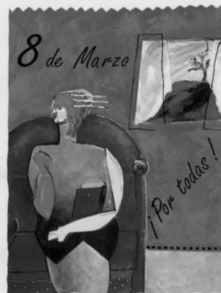
AYUNTAMIENTO DE PUERTOLLANO CONCEJALÍA DE MUJER