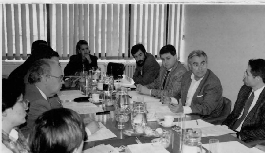
Reunión de los miembros del Comité Organizador de las II Jornadas sobre Ciudades Saludables.

En estas jornadas, cabe destacar las actividades de sensibilización y control de vertederos, de vacunación anti-rabia y de control e información en puntos donde se