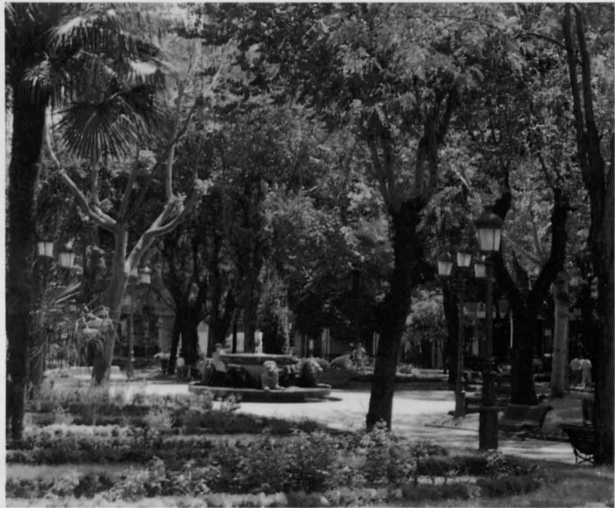
El nuevo sistema de riego del Paseo de San Gregorio se surtirá del agua existente en el subsuelo de Puertollano

La Presidenta de la Red Nacional de Ferrocarriles Españoles comunicó al Alcalde su intención de visitar Puertollano cuando se ponga en marcha, próximamente, la Oficina de Promoción Empresarial.