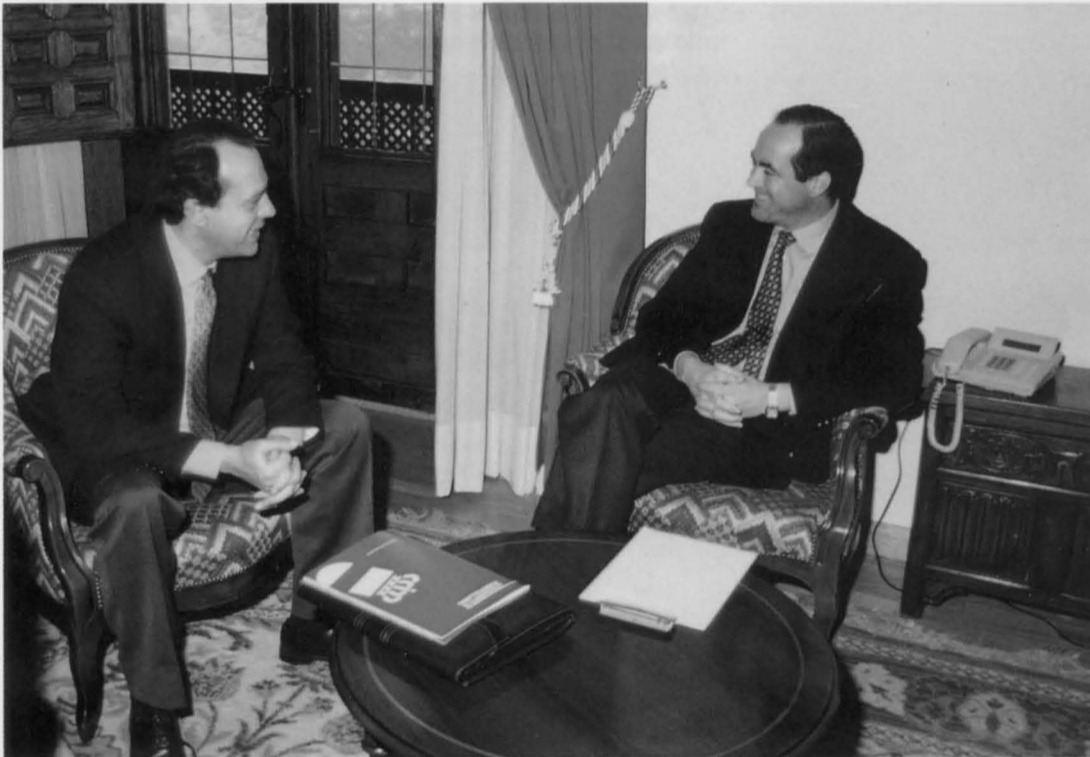
El Alcalde presentó el pasado 3 de diciembre al Presidente de la Junta, José Bono, el Plan de Inversiones.

El Alcalde de Puertollano ha presentado al presidente regional, José Bono, un proyecto de plan de inversiones para nuestra Ciudad durante los dos años 1994 y 95, que incluye actuaciones urbanísticas, de promoción industrial, cultural y de equipamientos. El presupuesto del plan de inversiones ronda los 4.000 millones de pesetas, de los que se espera que la Junta de Comunidades financie 2.000 millones. José Bono se mostró receptivo ante Manuel Juliá y destacó el futuro prometedor que tiene ante sí Puertollano.