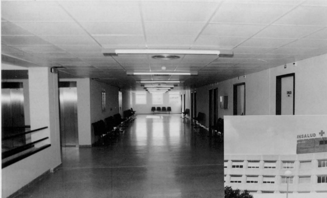
Vista general de las nuevas instalaciones de consultas externas y del exterior del Hospital de Santa Bárbara.