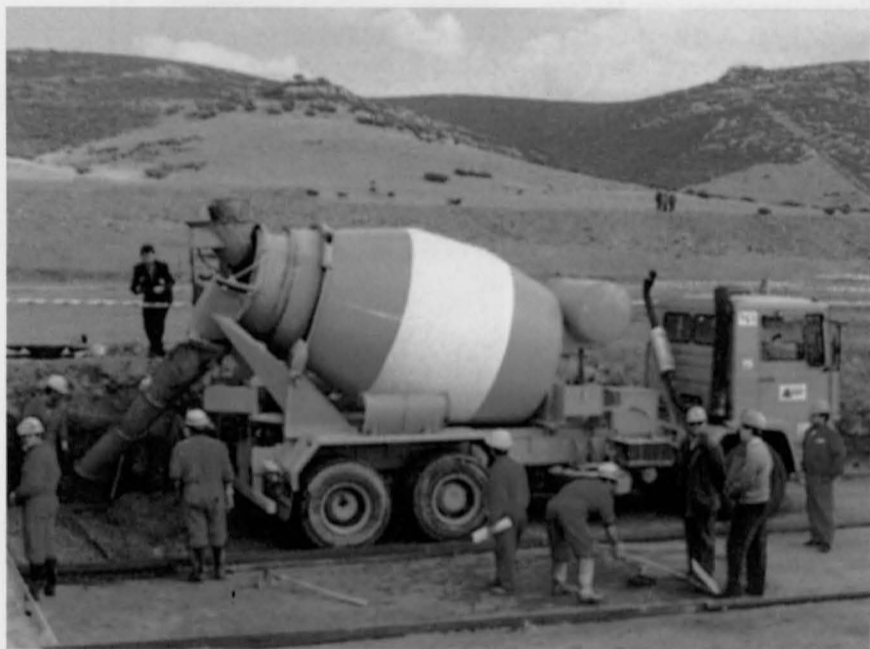
El 26 de octubre comenzaron los trabajos de cimentación del edificio que albergará la turbina de gas