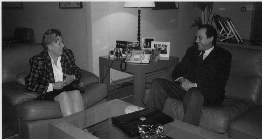
La Presidenta de Renfe, Mercé Sala, confirmó también en su encuentro con el Alcalde que la empresa estatal estará presente en la Promoción Industrial de Puertollano

Además, colocarlo y retirarlo es fácil, y su estructura pasa desapercibida a simple vista. El goteo facilita también un mejor desarrollo de las plantas, puesto que las sales minerales se disuelven y reparten perfectamente, según demuestran los estudios técnicos realizados.