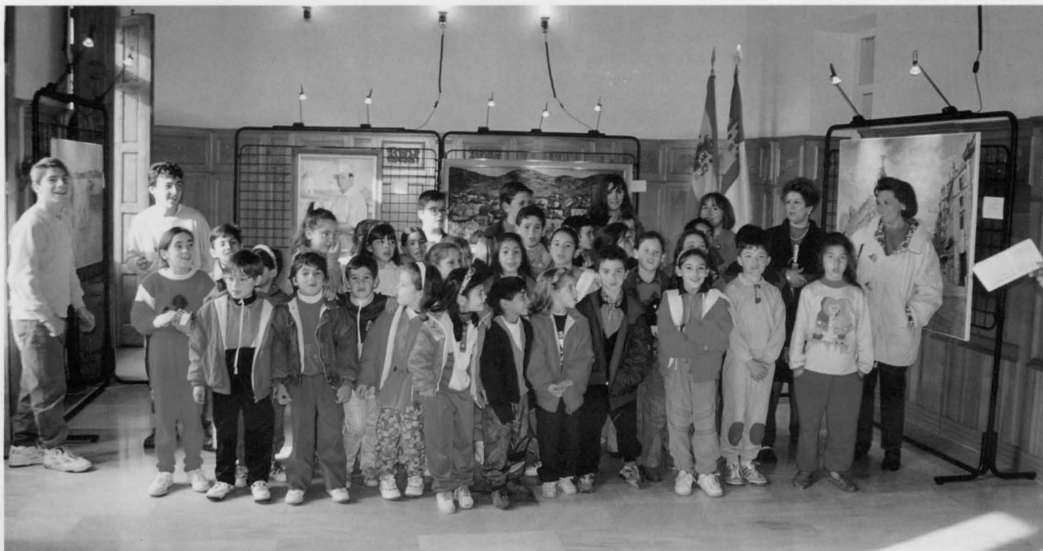
Los escolares de Puertollano han sido los principales visitantes de un Museo vivo y dinámico

El Museo Municipal de Puertollano ha cumplido un año de vida, con un balance satisfactorio tanto por el número de visitantes como por la cantidad y calidad de las obras expuestas. Los responsables del Museo van a mantener la política de exposiciones temporales llevada a cabo en estos meses, concluirán el catálogo de la colección municipal, e intentarán involucrar más a los puertollanenses para que contribuyan a hacer, entre todos, un museo "vivo y dinámico".