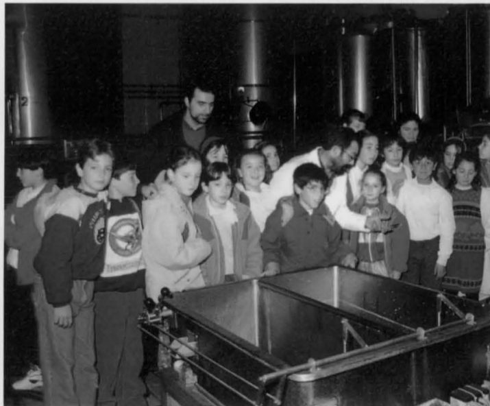
Escolares durante una visita a una industria de alimentación para conocer el proceso de producción

Estos dos últimos han sido los elegidos por los responsables de los centros mencionados. Las enseñanzas teóricas que imparten