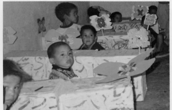
Los niños saharauis aprenden en improvisadas escuelas con cajas de cartón pintadas que sustituyen a las mesas.

Los saharauis aspiran a ocupar su tierra, controlada por Marruecos después de que España la abandonase a raíz de la "Marcha Verde" (1975). Su segunda lengua oficial es el español, y conservan costumbres muy vinculadas a España. ■