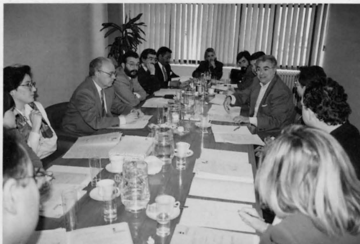
Reunión de la comisión de expertos que prepara el encuentro.

En este encuentro intervienen, entre otras personalidades, la consejera de Sanidad de la Junta regional, el presidente de las Cortes de Castilla-La Mancha, la alcaldesa de Albacete, el director general de agua y calidad ambiental, el director general de alta inspección del Ministerio de Sanidad, o el comisario de aguas del Guadiana.