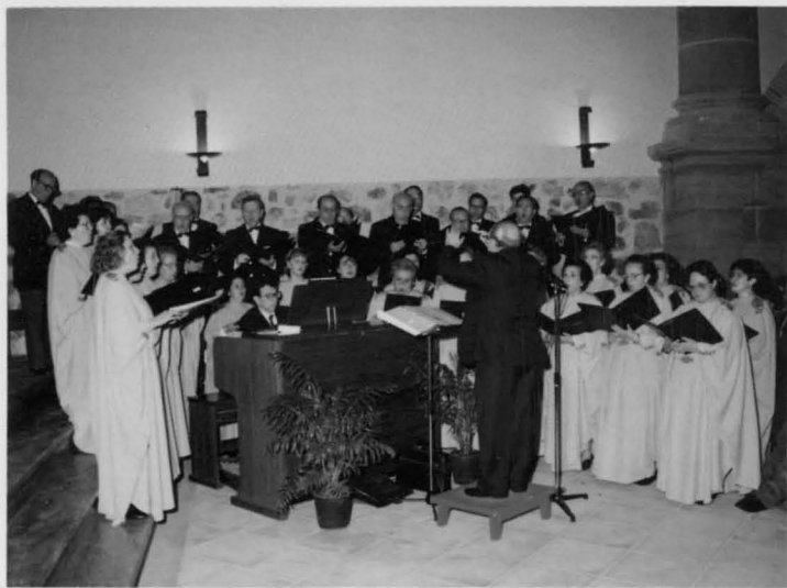
Coral polifónica de Ciudad Real y orquesta de cámara del Ampurdán.