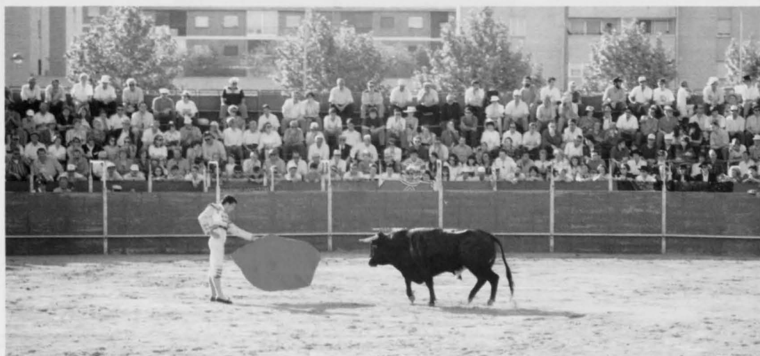
Las corridas de toros son ya un ingrediente fijo de las ferias.