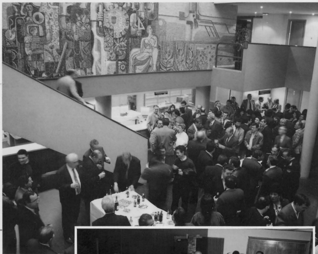
Vista general del vestíbulo del Ayuntamiento durante la copa que se sirvió tras el nombramiento del nuevo Alcalde.