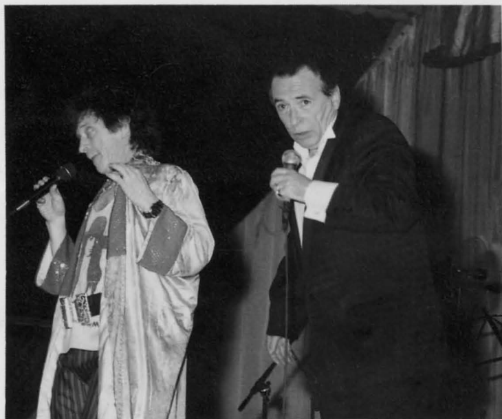
El humor de los hermanos Calatrava hizo reír a todos..

Ese mismo día 1, domingo, tuvo lugar la primera actuación musical. El grupo Celtas Cortos con-