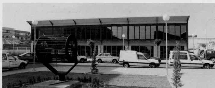
Edificio anexo a la Estación del AVE para la Oficina de Promoción.

Este esfuerzo colectivo tiene como finalidad propiciar la realización de proyectos empresariales viables en Puertollano y su comar-