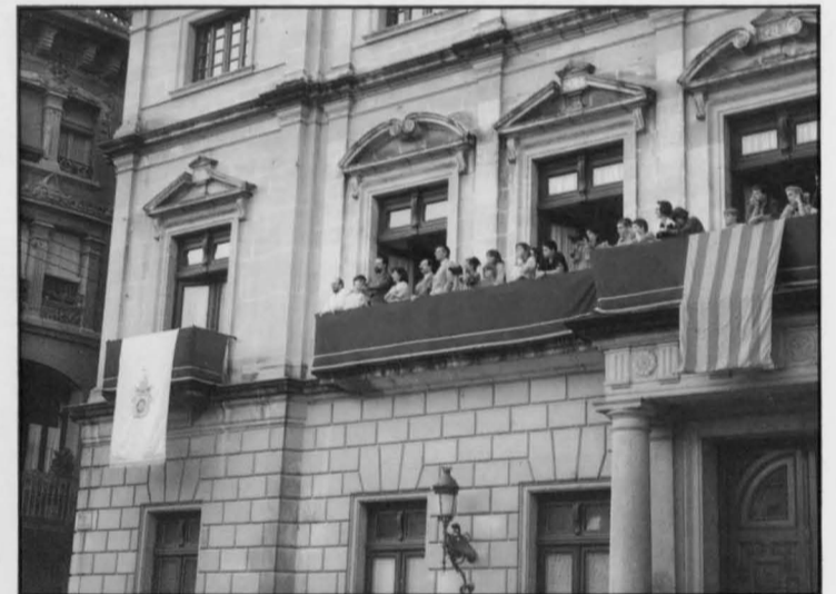
Los Alcaldes de ambas ciudades presencian desde el balcón de la Casa Consistorial la demostración de "Castellers".

ciones de vídeos, exposiciones, festivales folklóricos, teatro, etc., acercando aun más nuestra cultura a la comunidad catalana. ■