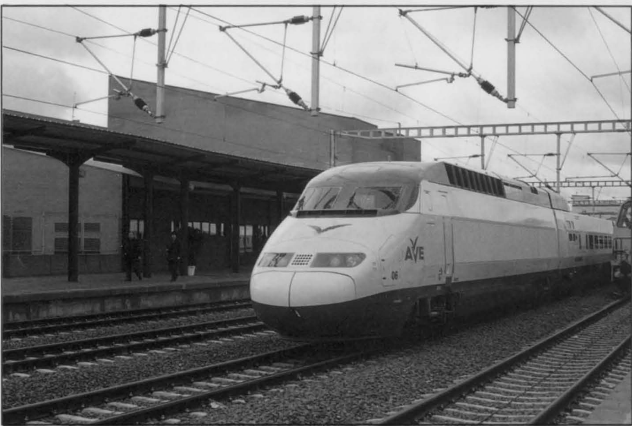
Un tren Lanzadera en la Estación de Puertollano.

ce a 1.800 pesetas, y a 2.400 pesetas en las otras dos. El viaje entre Ciudad Real y Puertollano será de 400 pesetas en Turista, y 500 en las otras dos.