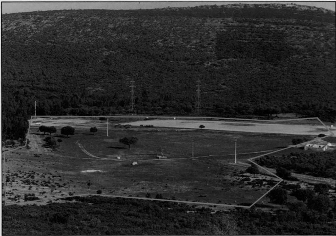
Vista general de los terrenos en el paraje de la Dehesa Boyal que ocuparán el complejo al aire libre y la Escuela-Taller de Medio Ambiente.

Como es sabido, el grueso de las futuras instalaciones se encuentran situadas sobre una finca propiedad del Ayuntamiento