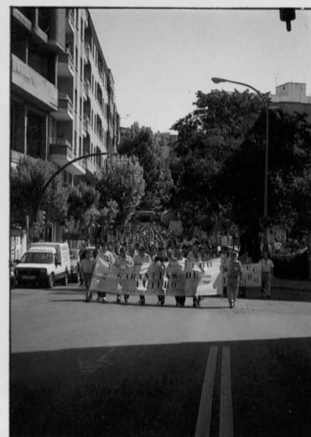
Los trabajadores de Fesa-Enfersa recorren las calles de Puertollano reivindicando la apertura de la factoría.

en su mano, pero prometió a los representantes de los trabajadores que hará lo posible por conseguir la continuidad de la fábrica de Puertollano.