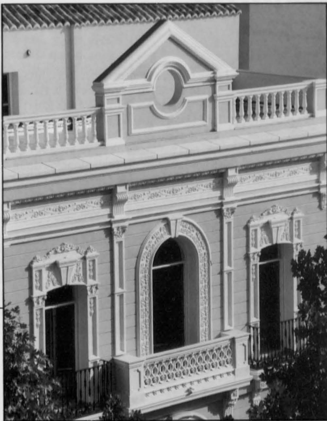
Detalle del balcón principal y el friso que corona el edificio.

El antiguo salón de Plenos se ha llevado el trabajo más laborioso con una fiel restauración de su artesanado y paredes.