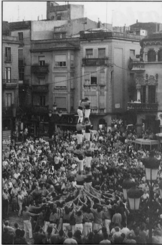
Los famosos "castellers", torres humanas, ofrecieron una exhibición ante el Alcalde de Puertollano