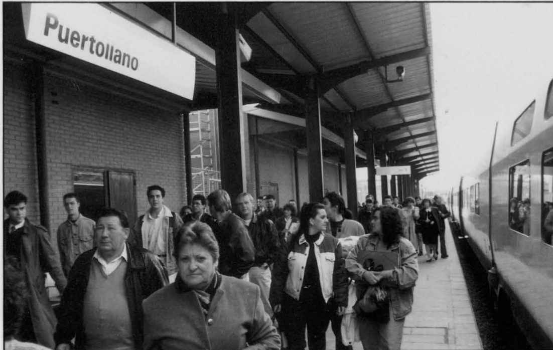
En apenas unas semanas las Lanzaderas se han convertido en el medio más utilizado para ir a Ciudad Real.

El servicio de trenes Lanzadera realiza el trayecto Puertollano-Ciudad Real-Madrid y viceversa cinco veces diarias. Con esta ampliación de servicios, la provincia de Ciudad Real dispone de un total de ocho trenes AVE en cada sentido, todos ellos unidos con Madrid. El enlace con Sevilla se mantendrá mediante tres trenes diarios.