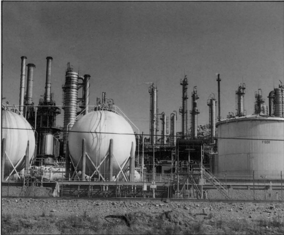
Repsol-Química prevee importantes inversiones tecnológicas para modernizar las instalaciones que muestra la fotografía.

La Moción sobre Repsol-Química, aprobada por unanimidad a iniciativa de Izquierda Unida, fue uno de los puntos más importantes tratados por el Pleno de la Corporación en la sesión ordinaria celebrada el pasado 15 de Septiembre. Otras 3 mociones, dos de Iniciativa Ciudadana y una del Grupo Popular, dos propuestas del Grupo Socialista, la aprobación de las cuentas del año 1991 y la convocatoria pública para cubrir varias plazas en el Ayuntamiento, fueron los asuntos más destacados de los abordados en la citada sesión.