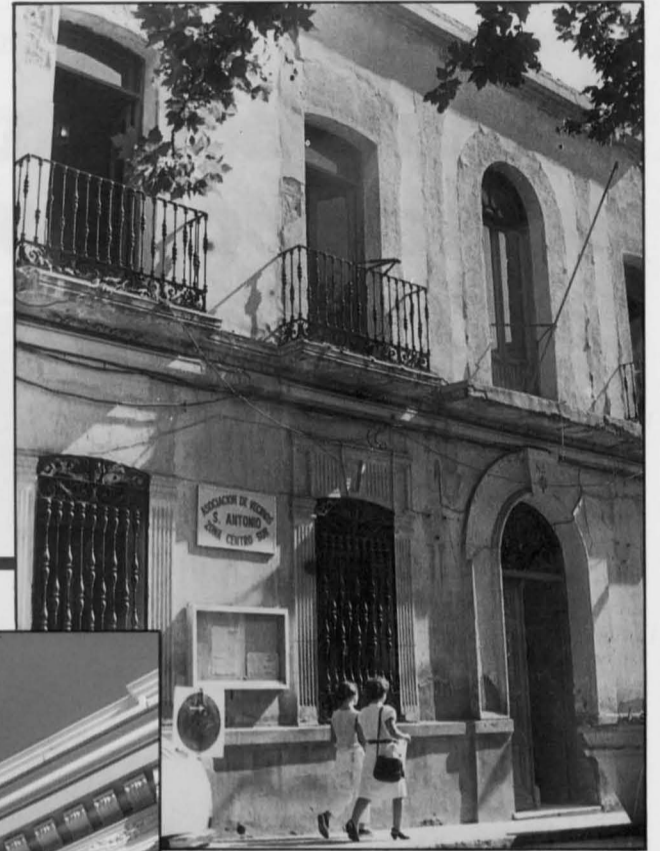
Vista general de la fachada del nuevo Ayuntamiento tras las obras de rehabilitación, comparada con el estado que presentaba hace unos años.

El Museo Municipal contará con diversas salas de exposición y ubicará el Archivo Histórico Municipal. La distribución definitiva de las salas en las diversas dependencias está aún por determinar. ■