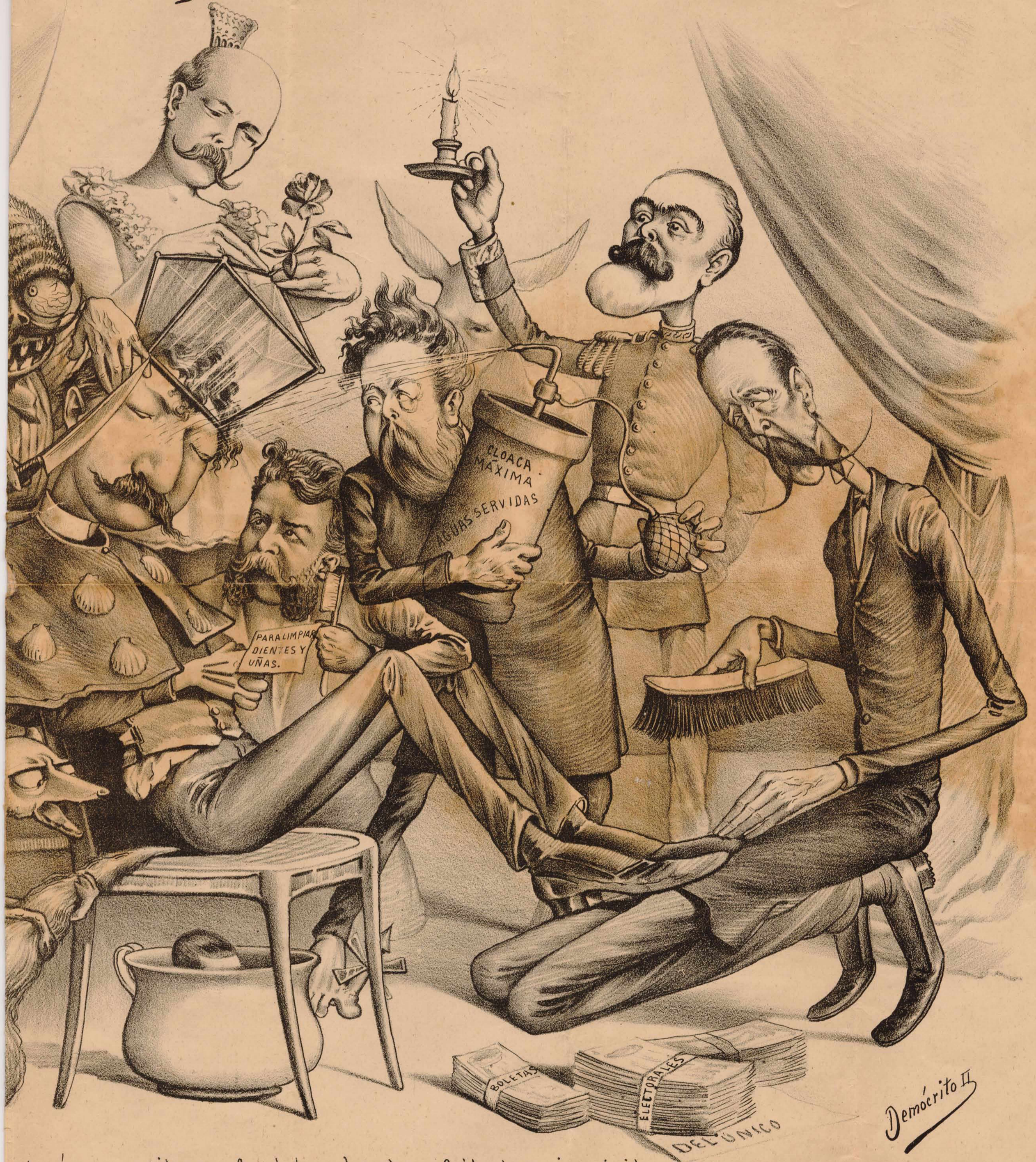
quedará en su casita, con farol ó con bonete, afeitado y sin visita.