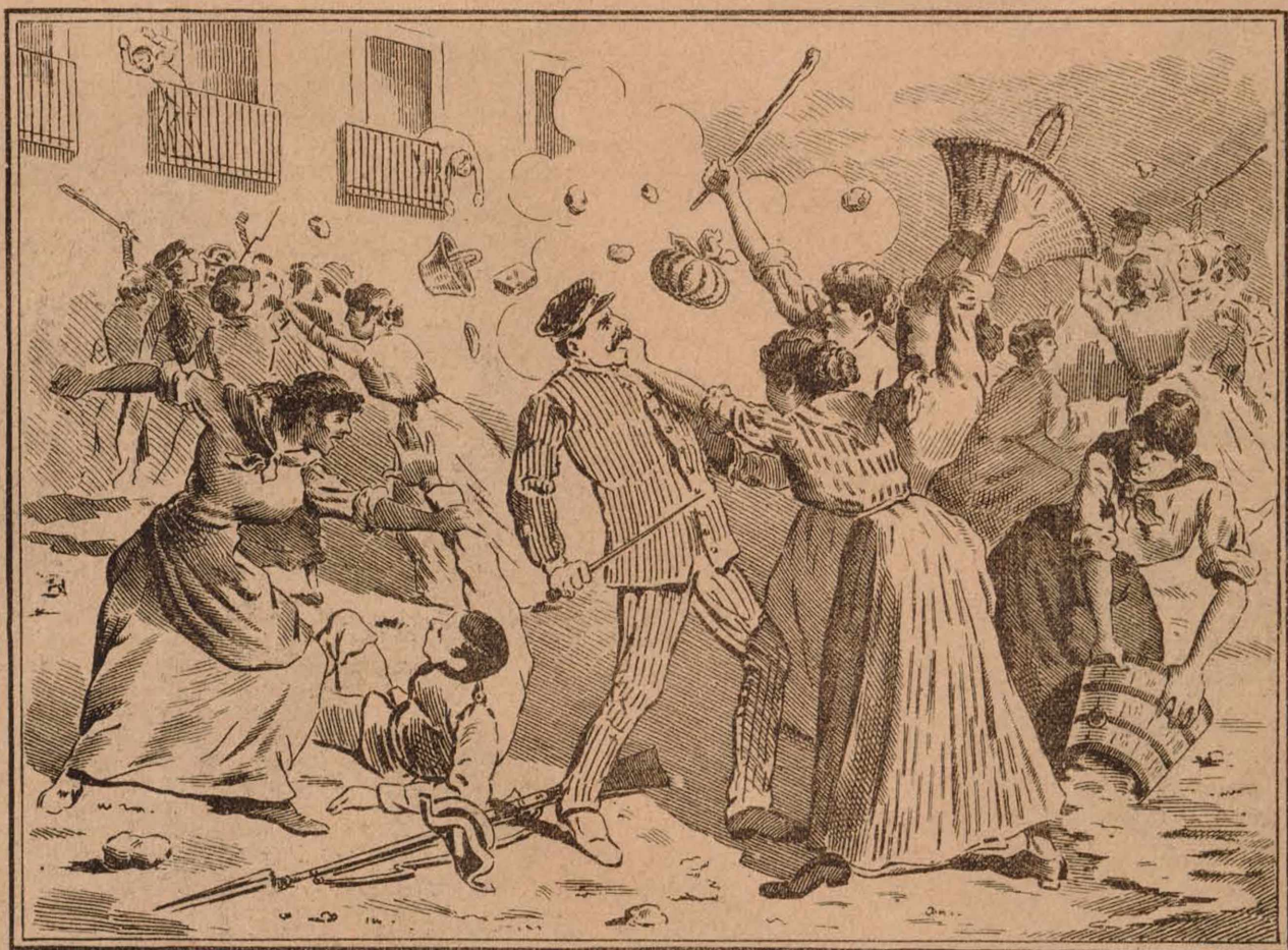
Es copia aqueste motín del que ocurrió en Pontevedra ¡Si Cánovas no se arredra, es porque tiene un mastín!