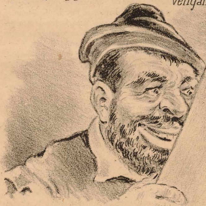
Buena oleografía publica el "Don Quijote." ¡ Ole ya! Valla una REPUBLICA que sale el día 11.