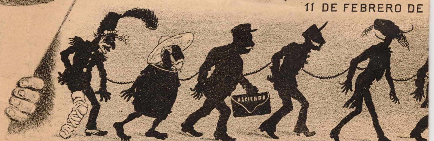
Comparsa política apresada el domin