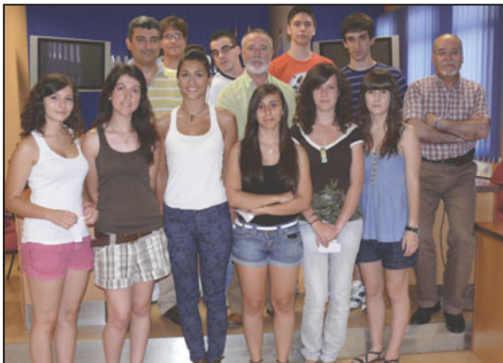
Alumnos premiados de 2º de bachillerato

En una segunda fase, a finales de septiembre o prime-