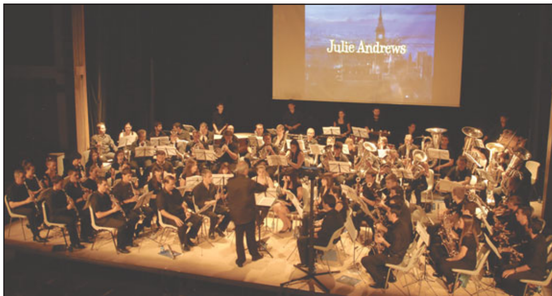
Concierto «Música en el cine»

« Música en el cine »: se celebró por primera vez el día 12 de diciembre de 2010 con motivo de la inauguración del teatro-cine Paz con un lleno absoluto, por lo que se volvió a realizar el 27 de marzo en el mismo lugar con el mismo éxito de público, es decir, lleno absoluto. Este concierto es una forma novedosa de hacer Música en coordinación con las imágenes de las películas respectivas; se puede decir, sin temor a equivocarse que es una verdadera labor de chinos ya que primero hay que ensayar