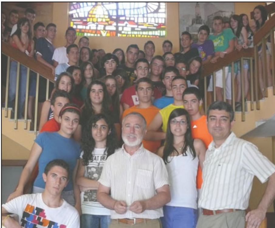
Alumnos premiados de 4º de E.S.O.

ros de octubre, serán premiados algunos de los alumnos anteriores, más los mejores de Enseñanza Primaria, Educación de Adultos y Selectividad. En ese momento les serán entregados diplomas a todos,