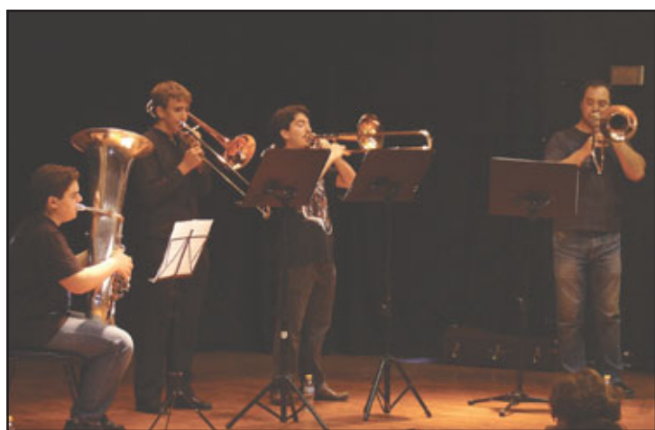
Distintos momentos de las audiciones de fin de curso

Todas las actuaciones fueron memorables. Tan solo, por destacar alguna de ellas, hablar del extraordinario concierto que nos ofrecieron las bandas juveniles de Aldea del Rey, Moral de Cva y Miguelturra, destacando el magnífico comportamiento de estos jovencísimos músicos (algunos en edad y otros en cuanto a los años que llevan recibiendo clases de su especialidad instrumental). El objetivo principal de la banda juvenil es que los alumnos de la escuela de Música de cualquier disciplina instrumental, aprendan a interpretar Música en conjunto, sabiendo escuchar, matizar en conjunto y compactar su sonido con el de los demás; este objetivo se ha superado con creces en este extraordinario concierto que nos ofrecieron en Junio que entusiasmo literalmente al público que abarrotó el salón de actos de la casa de la cultura. El futuro está asegurado.