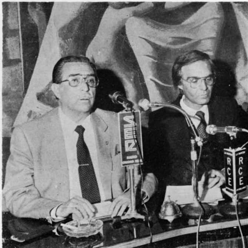
El presidente de la Diputación da la bienvenida al presidente de la región en su primera visita institucional a la provincia de Ciudad Real