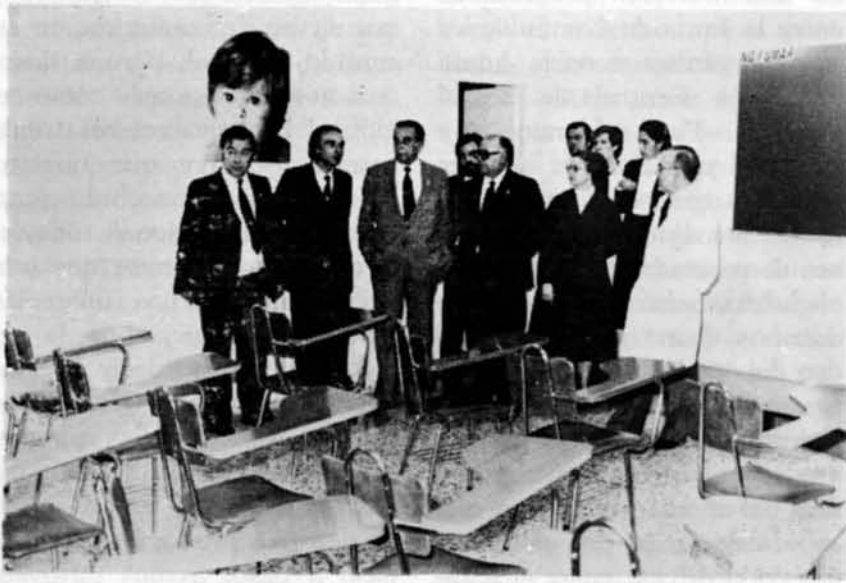
Visita a la Escuela Universitaria de Enfermeras

presidente de la Diputación provincial, Eloy Sancho, quien afirmó «hemos tenido suerte de tener un presidente de Castilla-La Mancha con gran dinamismo y capacidad de trabajo» , matizando que el señor Payo «engarzaba perfectamente lo autonómico con lo nacional, por ser diputado en el Congreso, con lo cual es un buen timonel o capitán de la nave regional» .