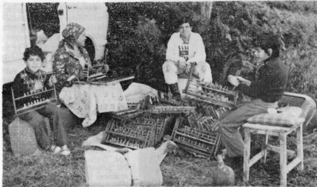
Nuevas generaciones se incorporan a la apicultura. Un momento de la preparación de los pertrechos necesarios para obtener jalea real, en Horcajo de los Montes.