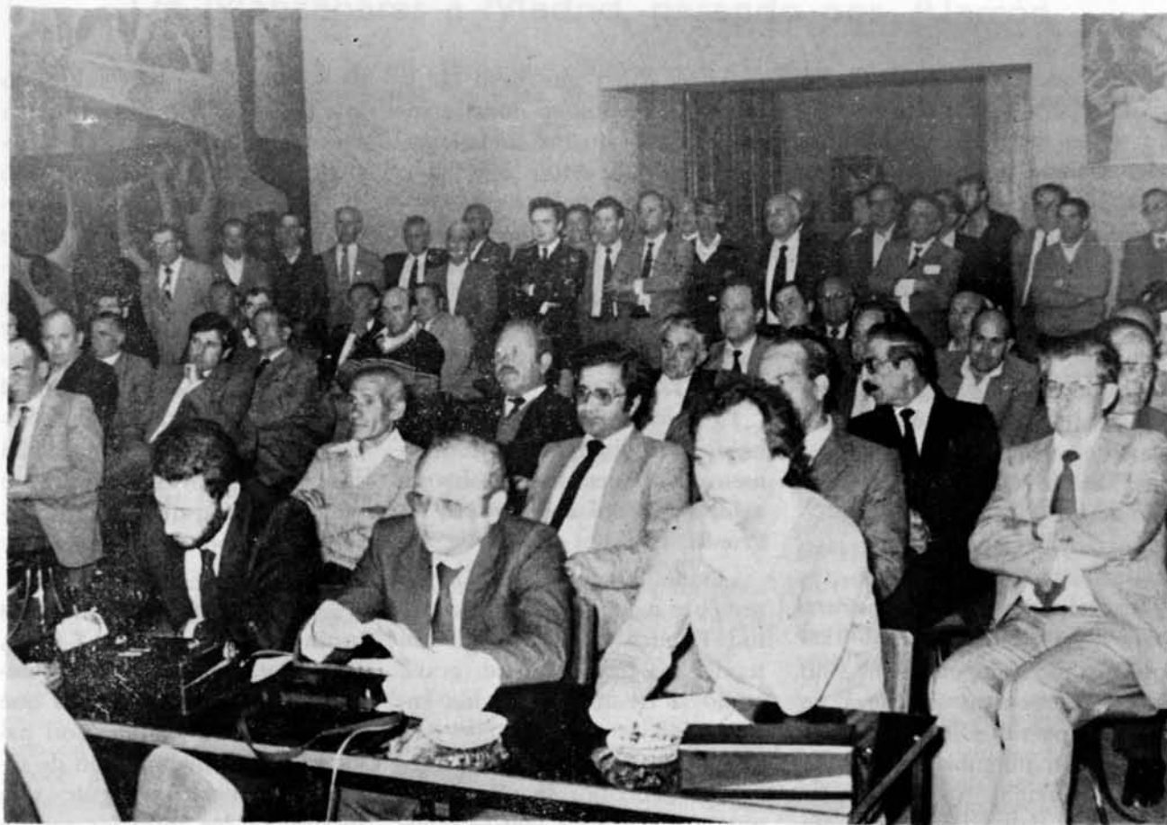
Aspecto del salón provincial durante la reunión con alcaldes y concejales de la provincia

«Siempre que se comparte una responsabilidad con la oposición, las cosas no son fáciles. Evidentemente, no se puede ser blanco y negro al mismo tiempo y no se puede tener una lucha política perfectamente lógica y normal dentro de la vía democrática y al mismo tiempo tener una colaboración como corresponde a personas que están en el mismo gobierno regional. Estamos partiendo de una conciencia regional escasa y tenemos bastantes problemas estructurales. Yo he sido siempre partidario, y la oposición lo sabe, de evitar conflictividades políticas en el seno del ámbito regional. Quizás sean foros más adecuados en el nivel nacional o en el nivel pro-