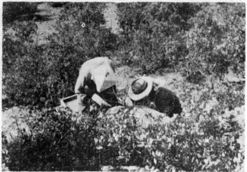
Se busca una reina...

«...Por la gran extensión de nuestra provincia, —dice la moción— se calcula que puede mantener un número no menor de quinientas mil colmenas, con un valor bruto de la producción superior a tres