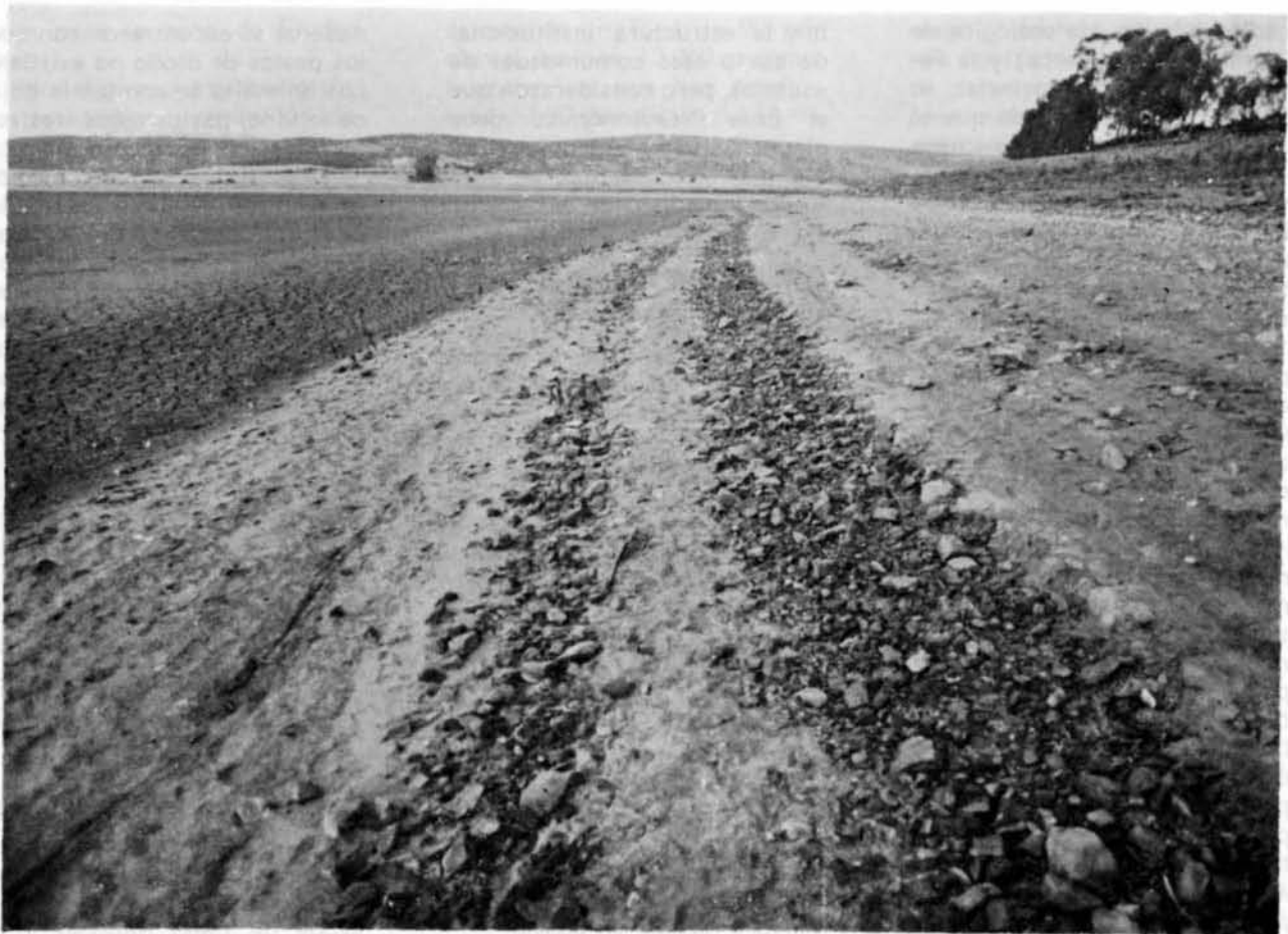
El Pantano de Gasset, al desnudo