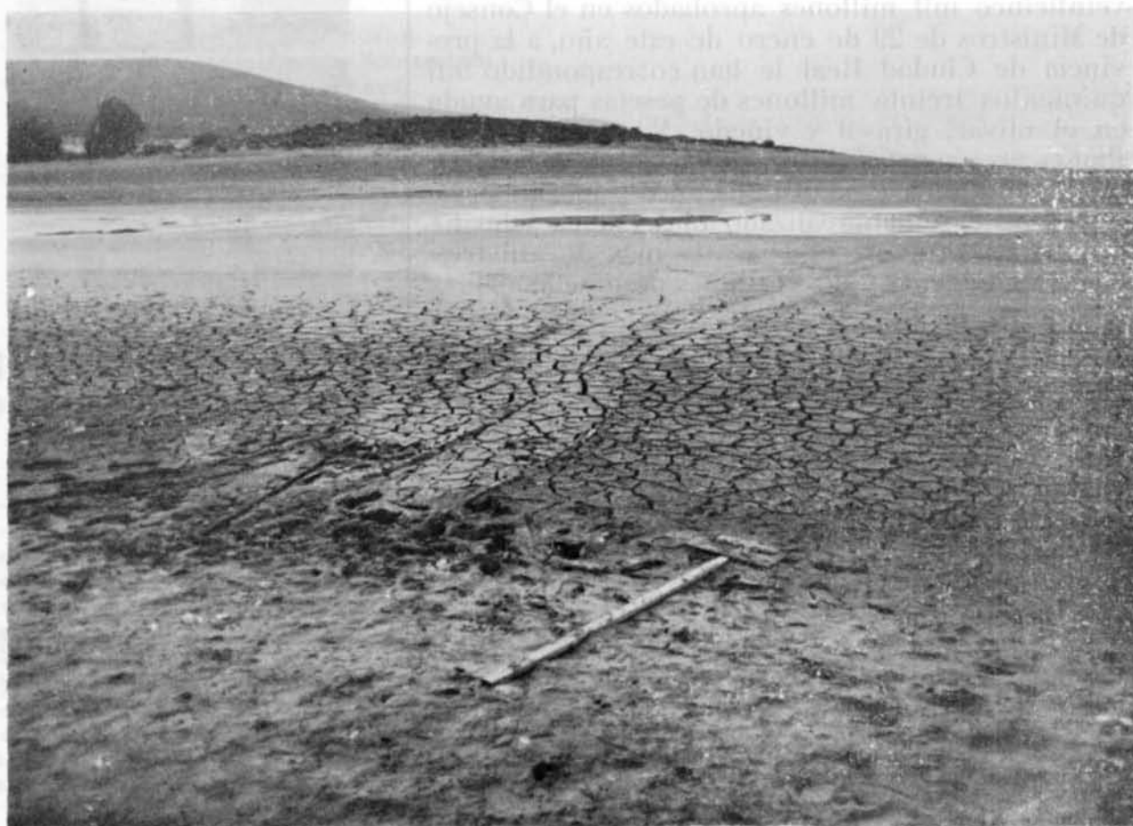
Espectacular imagen del Pantano de Gasset el día 6 de diciembre de 1981