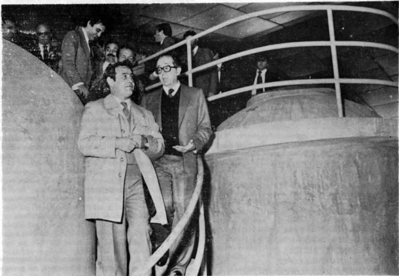
El ministro de agricultura durante su visita a la bodega de Bolaños