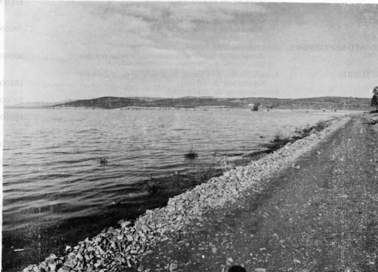
Reconfortante aspecto del Pantano de Gasset el 6 de febrero de 1982

Sólo en los dos primeros meses de este año se han aprobado un presupuesto total para obras hidráulicas que supera las cantidades de los dos años anteriores: 197.350.000 pesetas, según el desglose que se reseña más adelante. Las principales obras a realizar son nuevas captaciones y conducciones y construcción de depósitos, para que si en un futuro volvemos a padecer una sequía como la reciente, por lo menos no lleguen las poblaciones de la provincia de Ciudad Real a la situación de «Alerta roja», la «alerta roja» que vencimos.