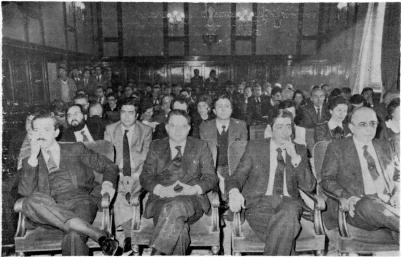
Aspecto del Salón durante la Sesión Plenaria

una Universidad propia está en la primera línea de las reivindicaciones de nuestra Región y constituye para Castilla-La Mancha una aspiración legítima imprescindible, de la que hasta esta última hora me hago portavoz enérgico ante el Parlamento y los poderes públicos. Sólo cuando se logre este anhelo habrá acabado la odiosa discriminación actual de ser la nuestra la única Región que no cuenta con Universidad. Por fortuna, las últimas gestiones realizadas por varios miembros de esta Junta y por mí mismo parecen haber proyectado sobre el tema alguna luz de optimismo.