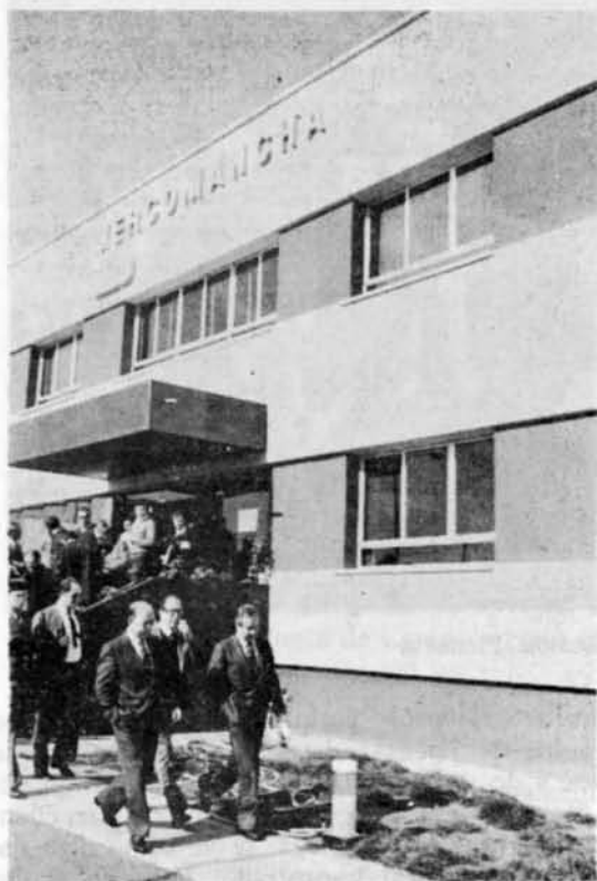
El ministro y sus acompañantes salen del edificio central de Mercomancha.

Protección decidida a los vinos manchegos