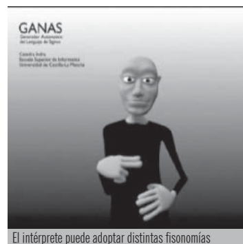
El intérprete puede adoptar distintas fisonomías

Entre las potenciales aplicaciones del proyecto GANAS cabe destacar su uso en lugares públicos como aeropuertos, estaciones, colegios, oficinas de empleo o turismo, para facilitar a la comunidad sorda la información