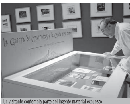
Un visitante contempla parte del ingente material expuesto

libro homónimo del historiador holandés Johan Huizinga que alude al juego "como una función humana tan esencial como la reflexión y el trabajo". Tempo incluyó, entre otras iniciativas, la exposición Tesis 2009 , del Instituto Europeo de Diseño de Madrid y el concierto del grupo Love of Lesbian.