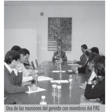
Una de las reuniones del gerente con miembros del PAS

Antes de que acabe el año, el gerente se habrá reunido con todo el PAS