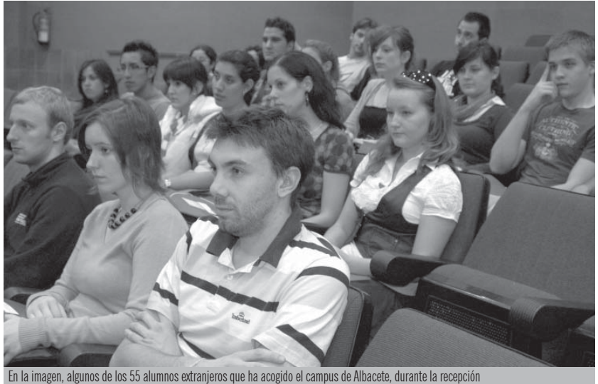
En la imagen, algunos de los 55 alumnos extranjeros que ha acogido el campus de Albacete, durante la recepción