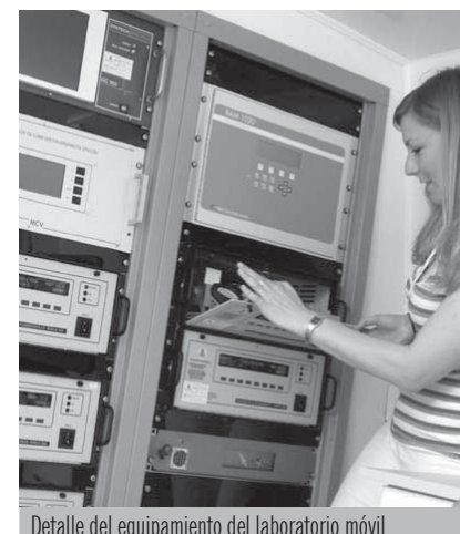
Detalle del equipamiento del laboratorio móvil