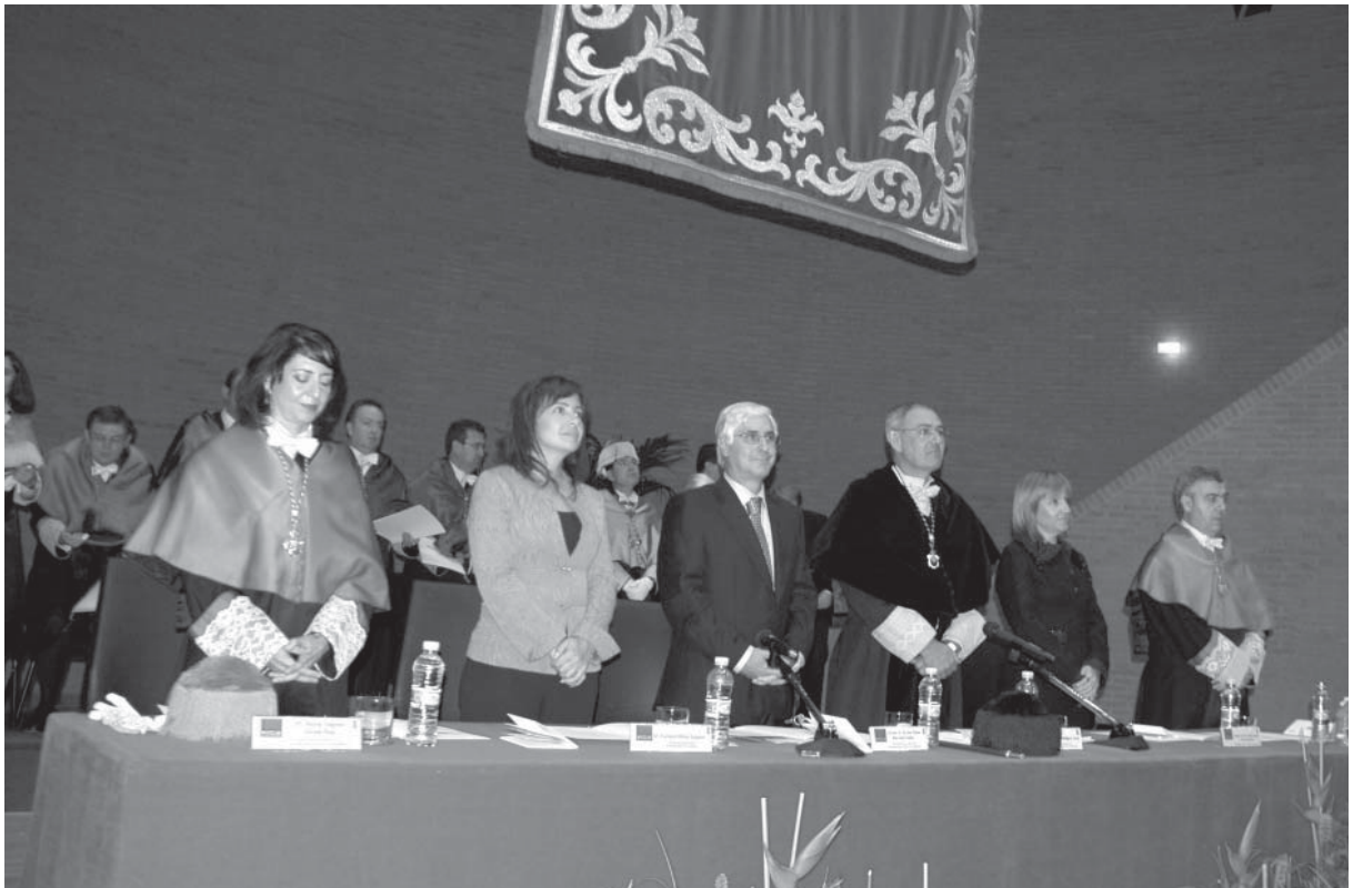
El rector, en el centro de la imagen, junto al presidente de la Junta de Comunidades, en la inauguración del curso académico, celebrada en el Campus de Albacete

La ceremonia de inauguración del año académico se celebró en el Campus de Albacete