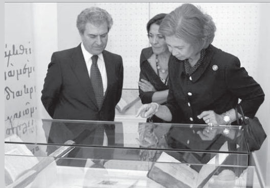
La Reina y el ministro de Cultura visitan la exposición comisariada por Miguel Cortés

más valiosas de las colecciones griegas conservadas en España, fundamentalmente de la propia Biblioteca Nacional, pero también de la Biblioteca del Real Monasterio de San Lorenzo de El Escorial, de la Biblioteca Universitaria de Salamanca y de la Biblioteca Histórica de la Universidad Complutense. Además se muestran piezas de arte bizantino procedentes del Museo Arqueológico Nacional entre otros. Tanto los manuscritos como las piezas arqueológicas, en total suman setenta obras, muestran qué fue Bizancio y cuál es su legado en España.