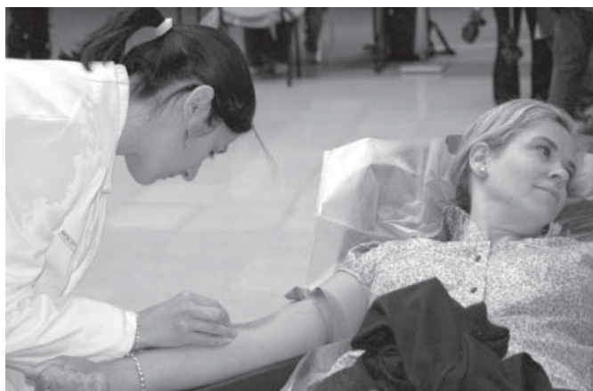
Donación de sangre

Estudiantes, profesores y personal de administración y servicios del Campus de Albacete han vuelto a demostrar su solidaridad participando activamente en la campaña de extracción de sangre organizada por Cruz Roja, al igual que sucedió hace unas semanas en Ciudad Real, cuando la respuesta de la comunidad universitaria a esta llamada también tuvo una respuesta masiva.