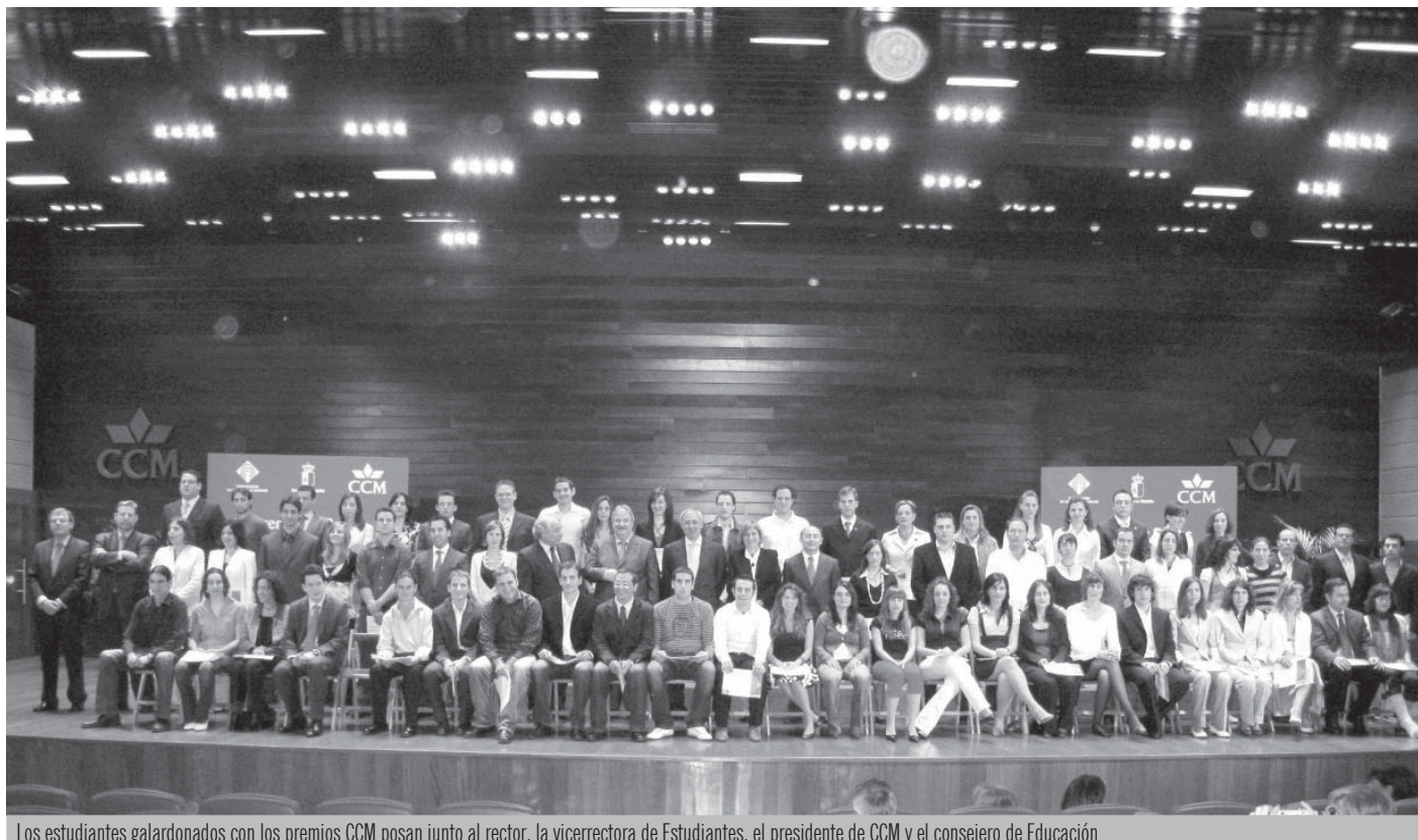
Los estudiantes galardonados con los premios CCM posan junto al rector, la vicerrectora de Estudiantes, el presidente de CCM y el consejero de Educación