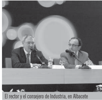
El rector y el consejero de Industria, en Albacete

En este sentido, el rector recordó que la UCLM está desarrollando un intenso trabajo en la promoción de la cultura emprendedora con la celebración de jornadas de motivación,