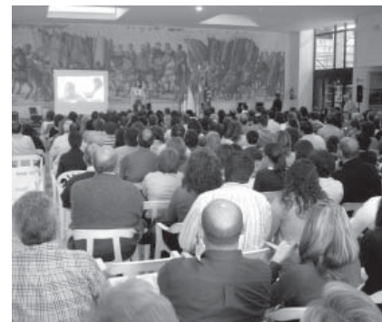
Distintos momentos de las jornadas de puertas abiertas en Albacete, Ciudad Real y Toledo