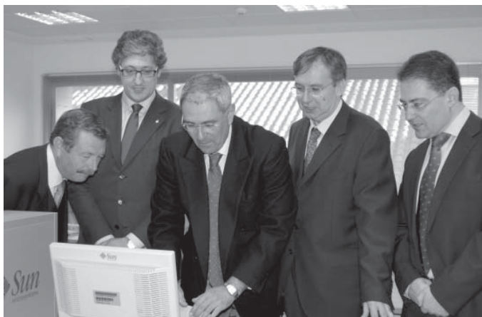
El rector, el vicerrector del Campus y el director de la Escuela de Informática, junto a los representantes de Sun

La cooperación entre la UCLM y Sun Microsystems se remonta a 2004, fecha en la que se suscribió un convenio de colaboración a través del cual la Universidad castellano-manchega entró a formar parte de la Red Universitaria de Socios Tecnológicos de Sun, formada en la actualidad por un total de 19 universidades de España y Portugal. Ello ha permitido la colaboración mutua en diversos ámbitos, pudiendo los alumnos de la UCLM acceder al software de Sun y los profesores a material docente y formación.