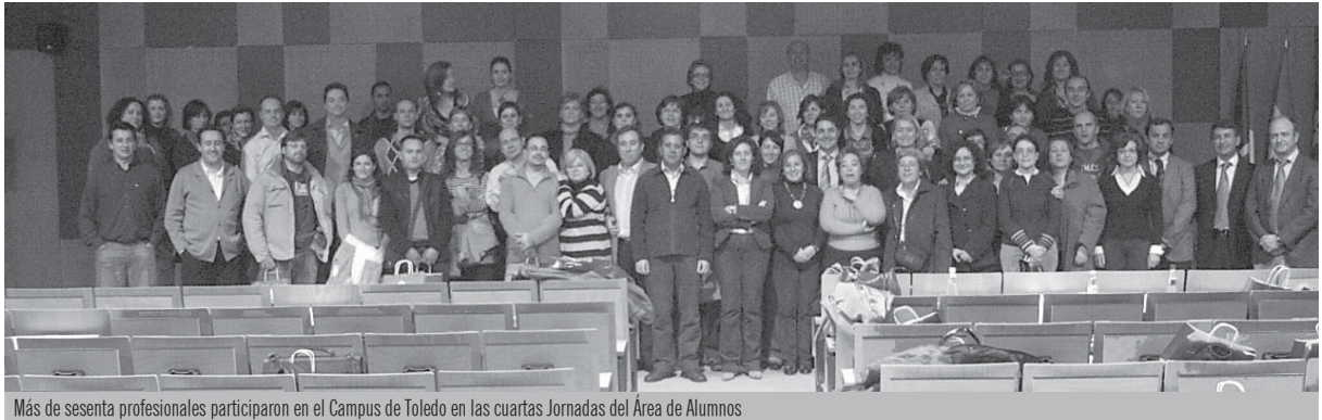
Más de sesenta profesionales participaron en el Campus de Toledo en las cuartas Jornadas del Área de Alumnos